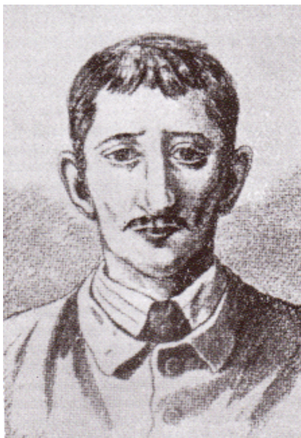
VI. Leopold Hilsner v době svého zatčení, in: ČERNÝ Bohumil a kol.: Hilsneriáda. K 100. výročí píseckého procesu, Polná: Linda 1999, str. 19