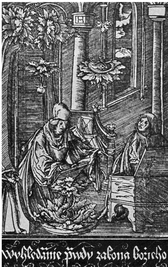
Jednota bratrská v obrazech 1457 – 1957, s. 28.

Příloha č. 6: Martin Luther jako profesor na známém obraze L. Cranacha st.