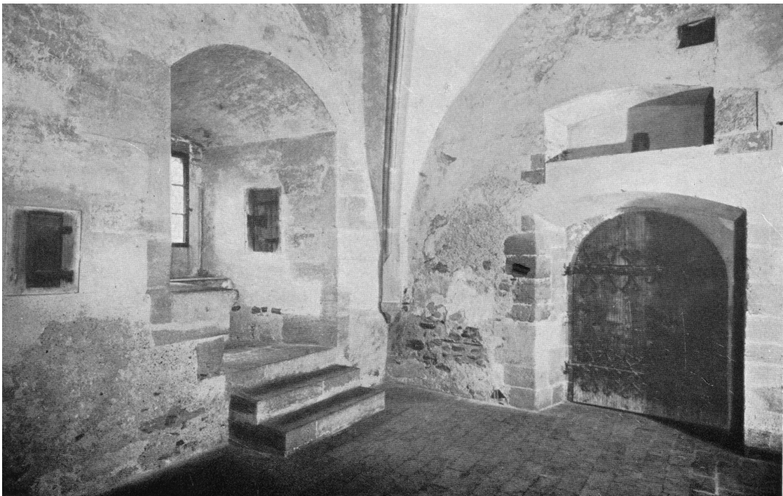
KALFUS, R. Jednota bratrská v obrazech 1457 – 1957, s. 41.