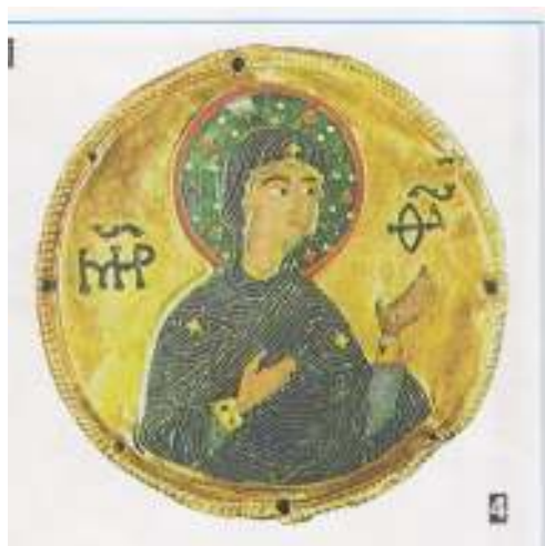
obr.4 66 “Řemeslná dovednost“

technické dovednosti. Dokládá to i tento medailon z 11. století“. A i další obrázky, které jsou uváděny na straně 9, ač s křesťanskou tematikou souvisejí, neodkazují na ni.