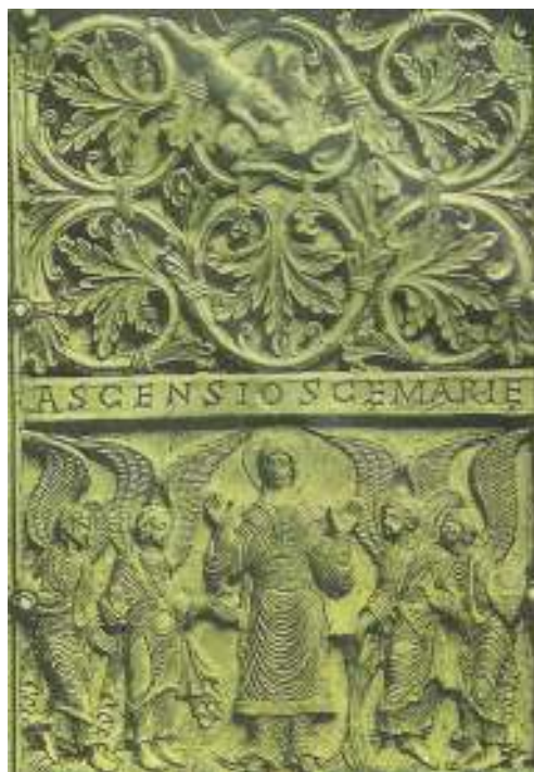
Obr. 2 30 Neutrálně hodnocený obrázek

U posuzovaného textu však pouhá informace k pozitivnímu hodnocení nestačí, ale jedná se i o skutečný pozitivní náboj.