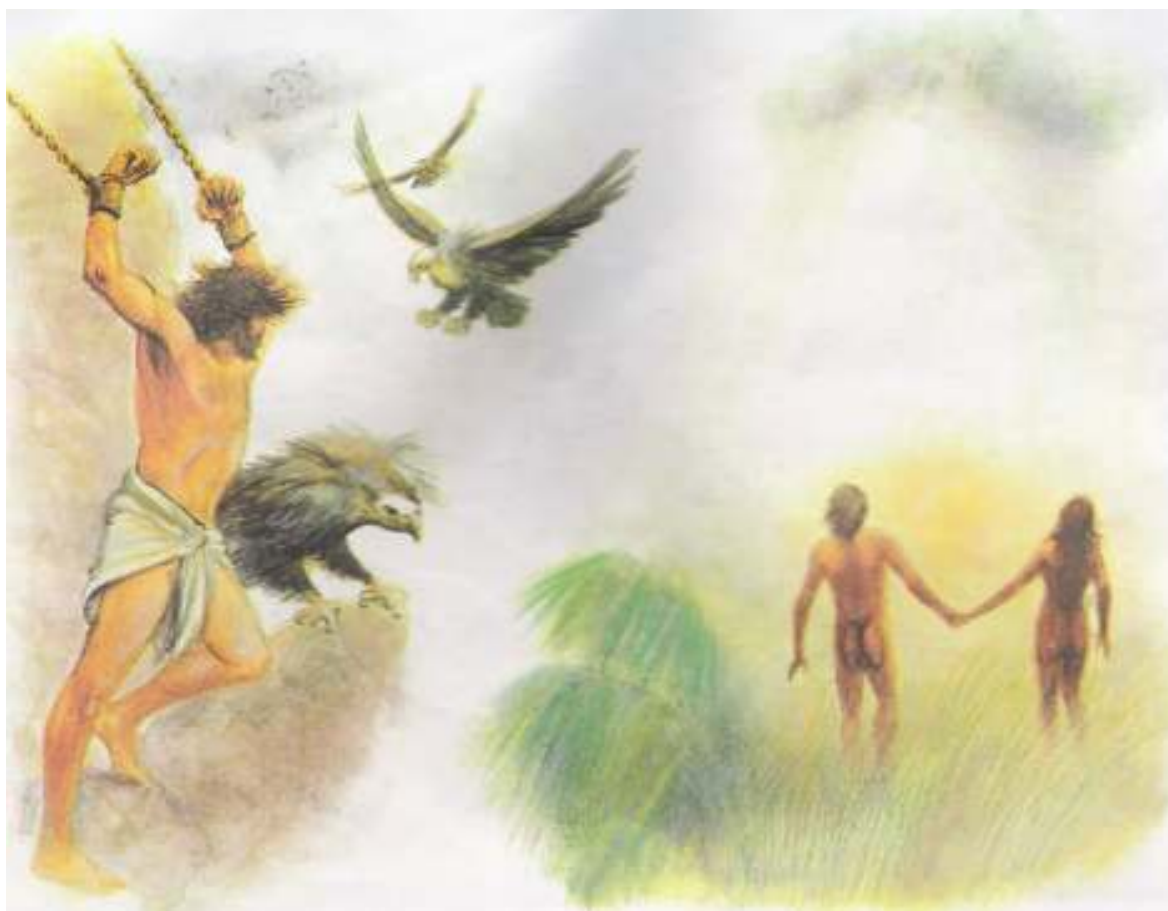
Obr. č. 3 34 Obrázek hodnocen negativně

V učebnici na straně 10 v kapitole pod názvem Vznik a vývoj lidského rodu - podkapitola Mýty a náboženství je uveden obrázek, viz obr. č. 3, který po řádné úvaze a rozboru byl vyhodnocen jako negativní, je ještě provázen textem, který byl též zhodnocen negativně. K uvedenému obrázku se již nevztahuje žádný text tzv. popiska k obrázku. Ve slovníčku odborných a cizích výrazů v učebnici se dozvídáme, že „mýtus je