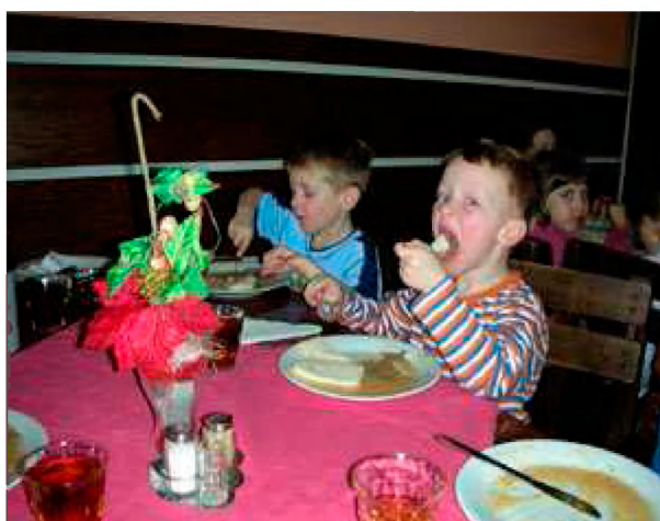
„Svíčková jako od maminky.“