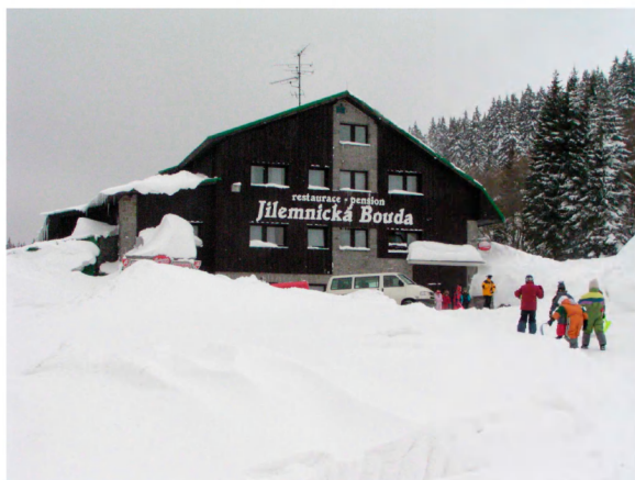
Krkonoše, Horní Mísečky