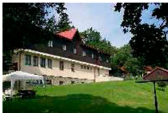
Nová budova Duncan