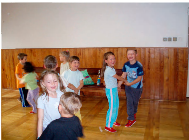
Využití tělocvičny přímo v objektu.