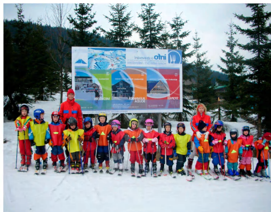
„Barevné vestičky, hurá na lyže!“