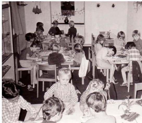
Kreslení ve třídě u stolečků.