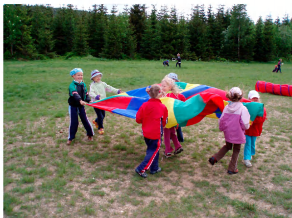
Spontánní pohybové činnosti dětí na pasece.