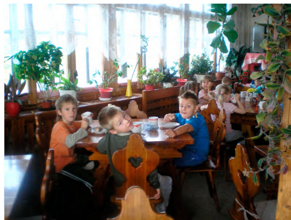
Snídaně ve stylové horské jídelně.