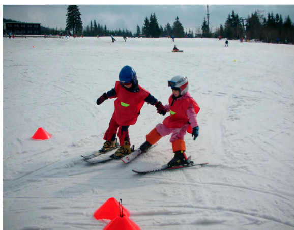
Jízda ve dvojici není příliš jednoduchá.