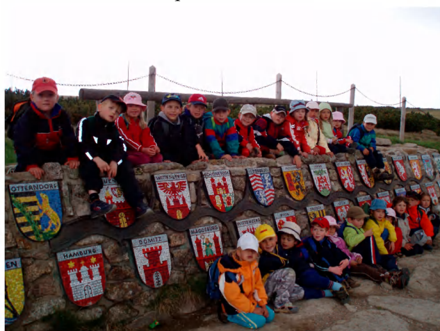
U pramene Labe