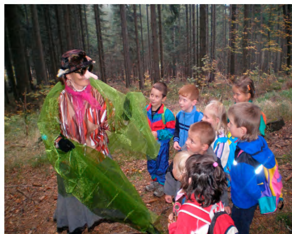
Babka kořenářka seznamuje děti s léčivými bylinkami