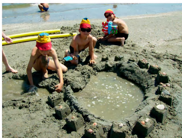
Stavby z písku – „Kraborárium“ pro záchranu krabů.