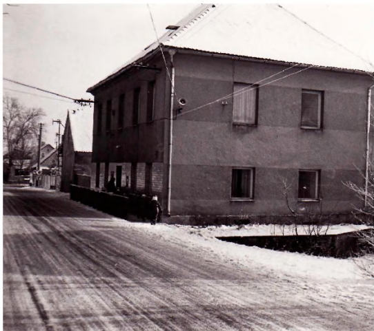
Budova školy v přírodě.