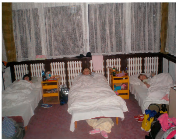
Dívčí pokoj před večerní pohádkou.