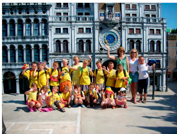
Návštěva italských miniatur.