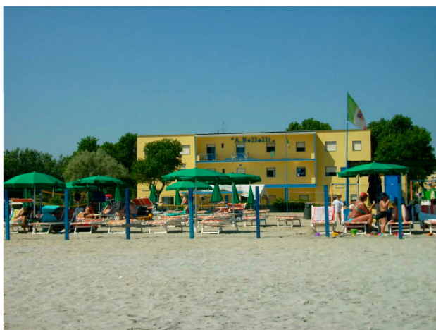
Itálie, Cesenatico, Bellelie