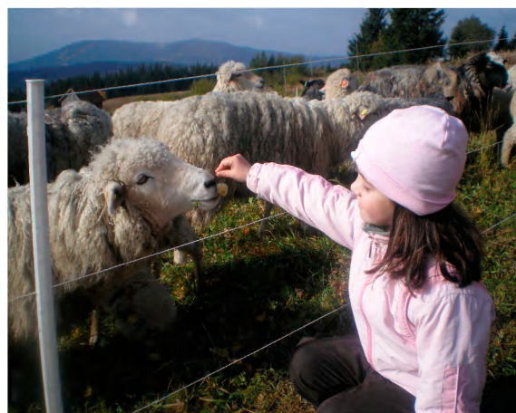
„Máme rádi zvířata.“