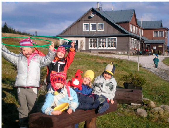
Krkonoše, Strážné, Chata Rozhled