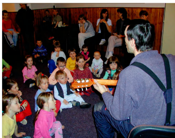
„Zpívání s kytarou a rodiči.“