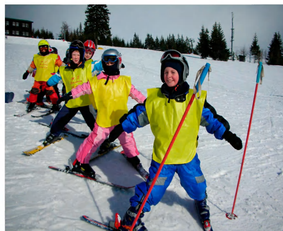
Letadla poletí jedno za druhým.