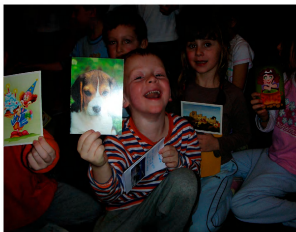
„To je pohled od mámy.“