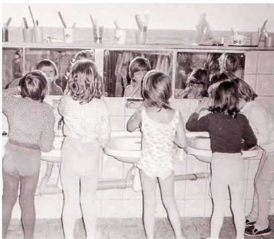
Ranní hygiena v umývárně.