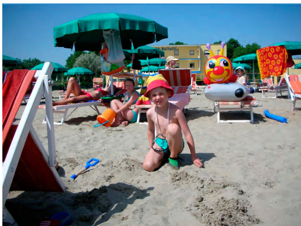
Každý má své lehátko a dvojice slunečník.