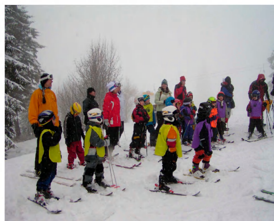
Lyžování před zraky rodičů.