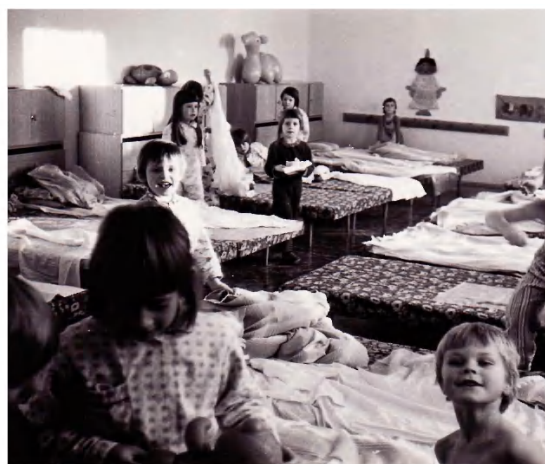
Příprava na spaní ve velkém pokoji.