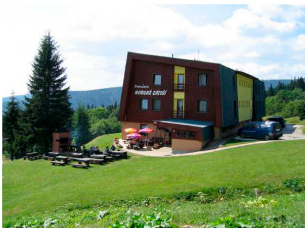
Krkonoše, horní Mísečky, Horské Zátíší