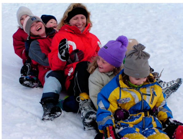
Veselá jízda na sněhových kluzácích.