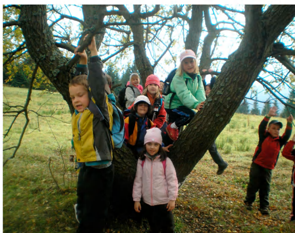
„Stromová prolézačka je nejlepší!“