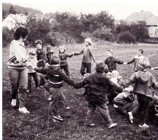
„Kolo, kolo, mlýnský“ na přilehlé louce.