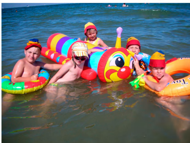
Trénink na závody na nafukovadlech.