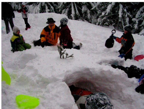
Stavba iglů pro neznámého tvora.