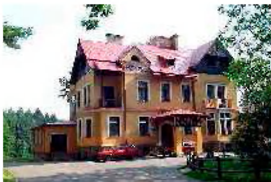
Stará budova Duncan

Ještě před snídaní si děti vynesou zavazadla na určené místo a uvolní pokoje pro úklid.