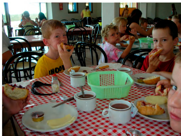
Snídaně jako doma.