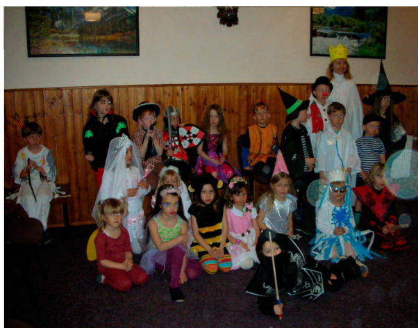
Příprava na skimaskiádu.