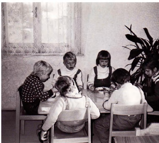
Oběd ve třídě.