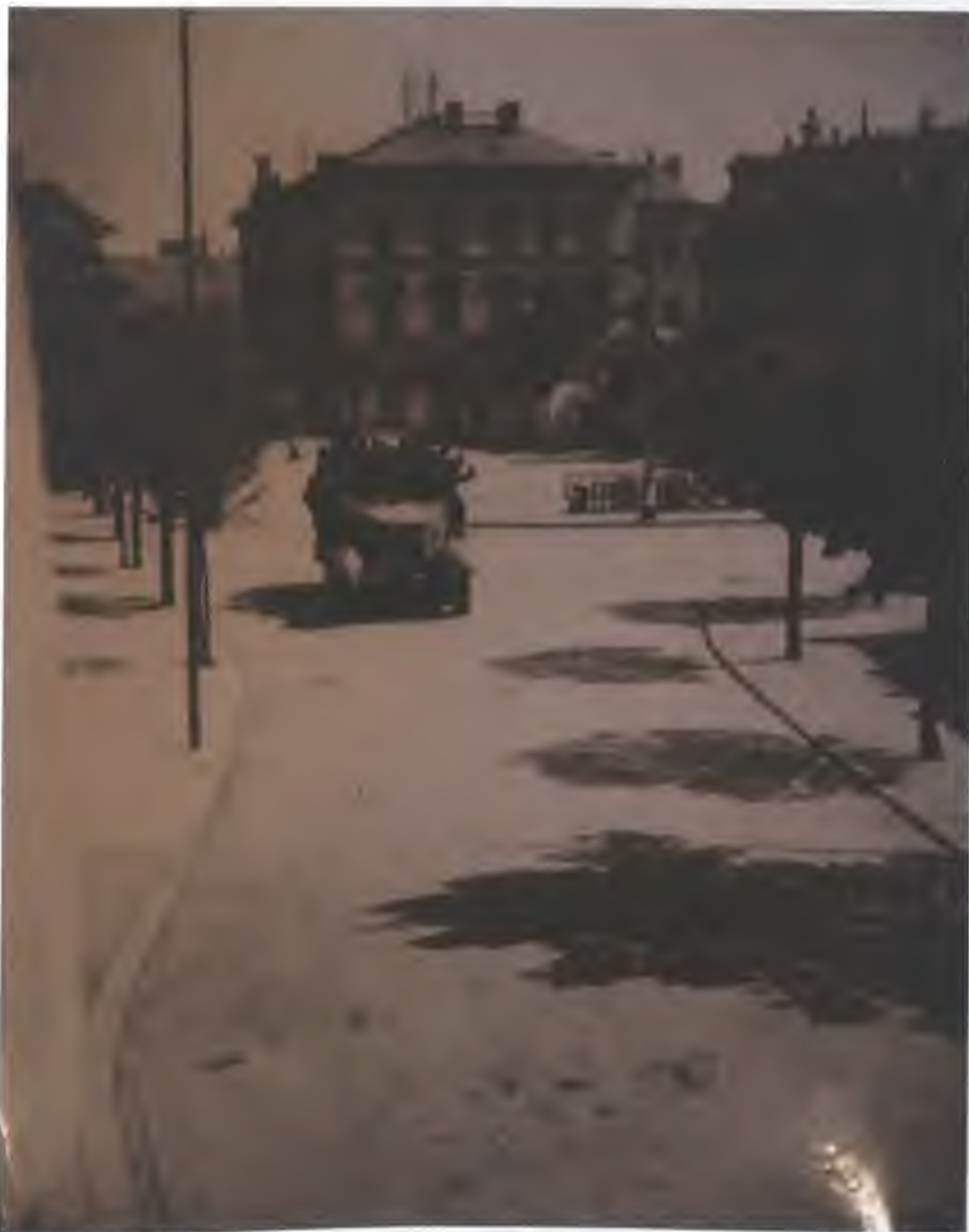
Fotografie č. 1