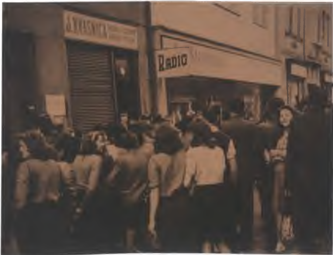
Fotografie č. 12