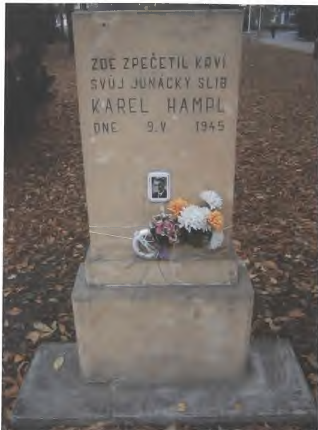
Fotografie č. 8