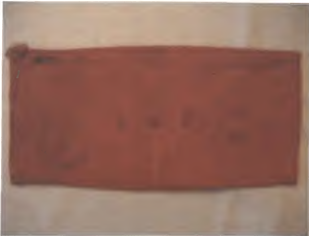
Fotografie č. 4