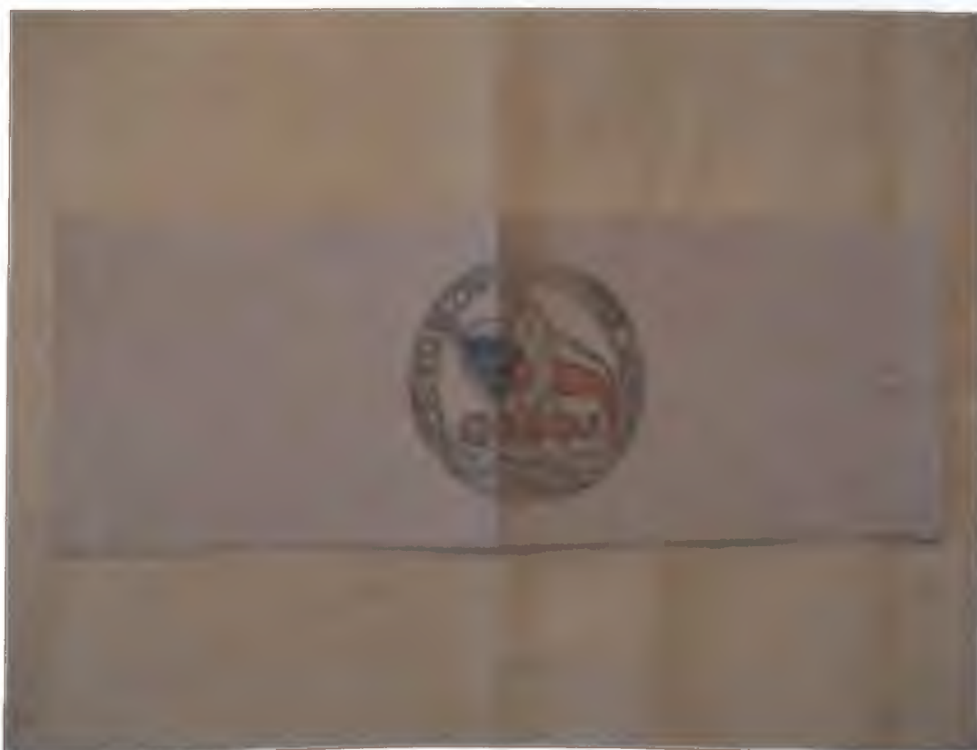
Fotografie č. 3