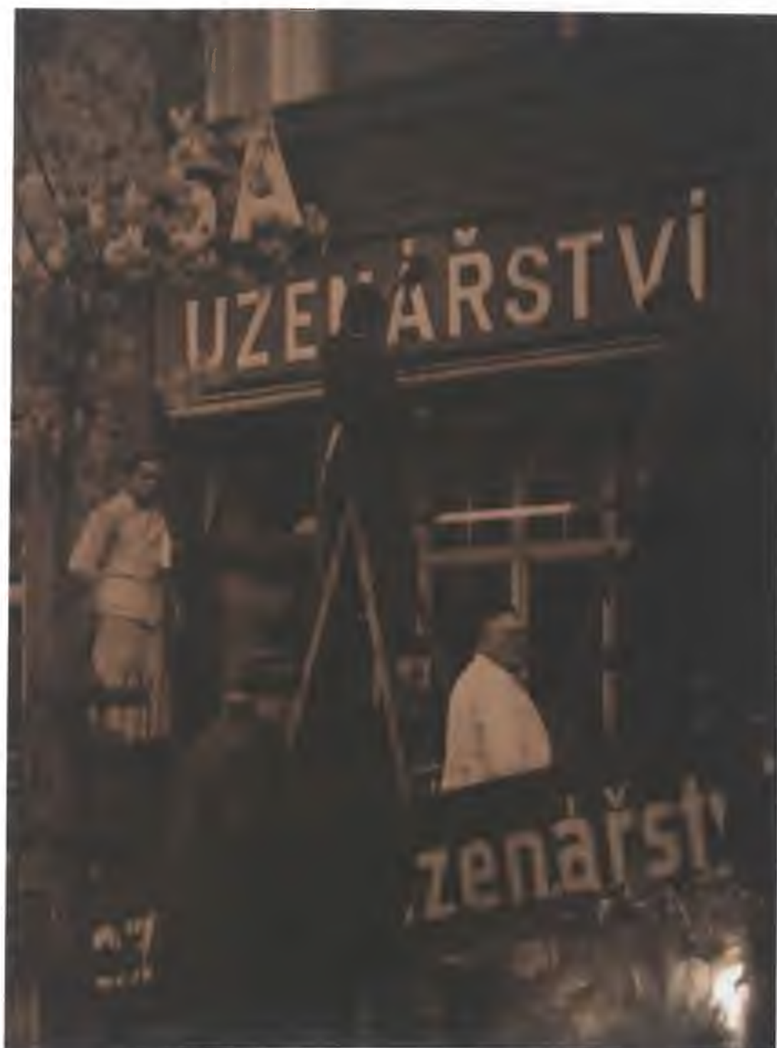
Fotografie č. 7