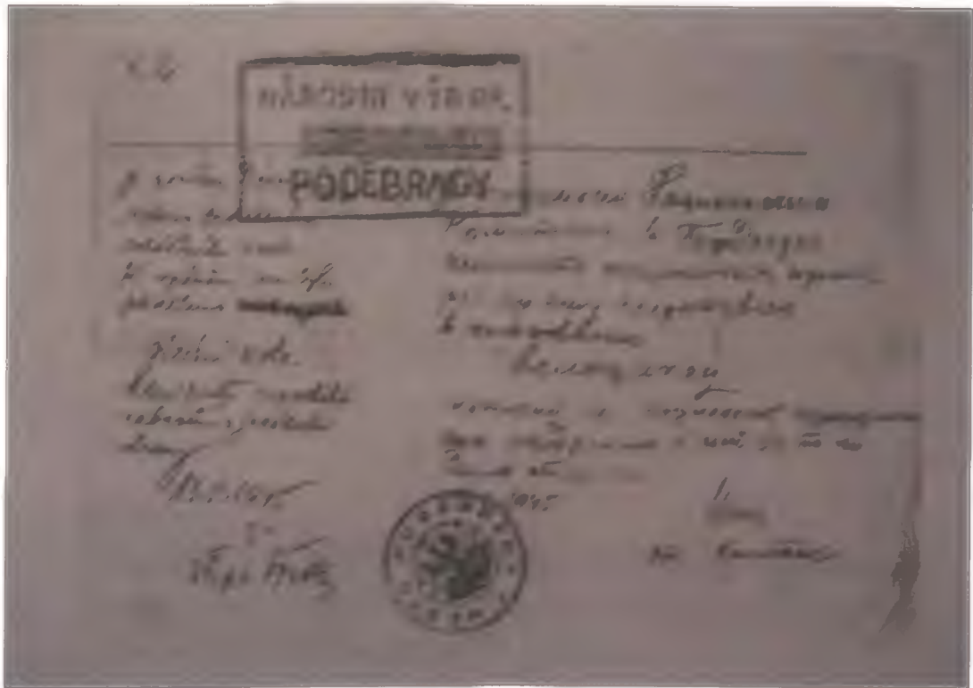
Fotografie č. 11