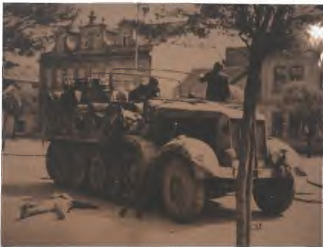
Fotografie č. 2