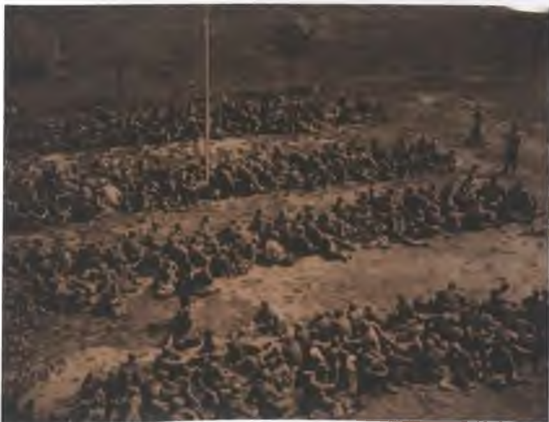
Fotografie č. 5