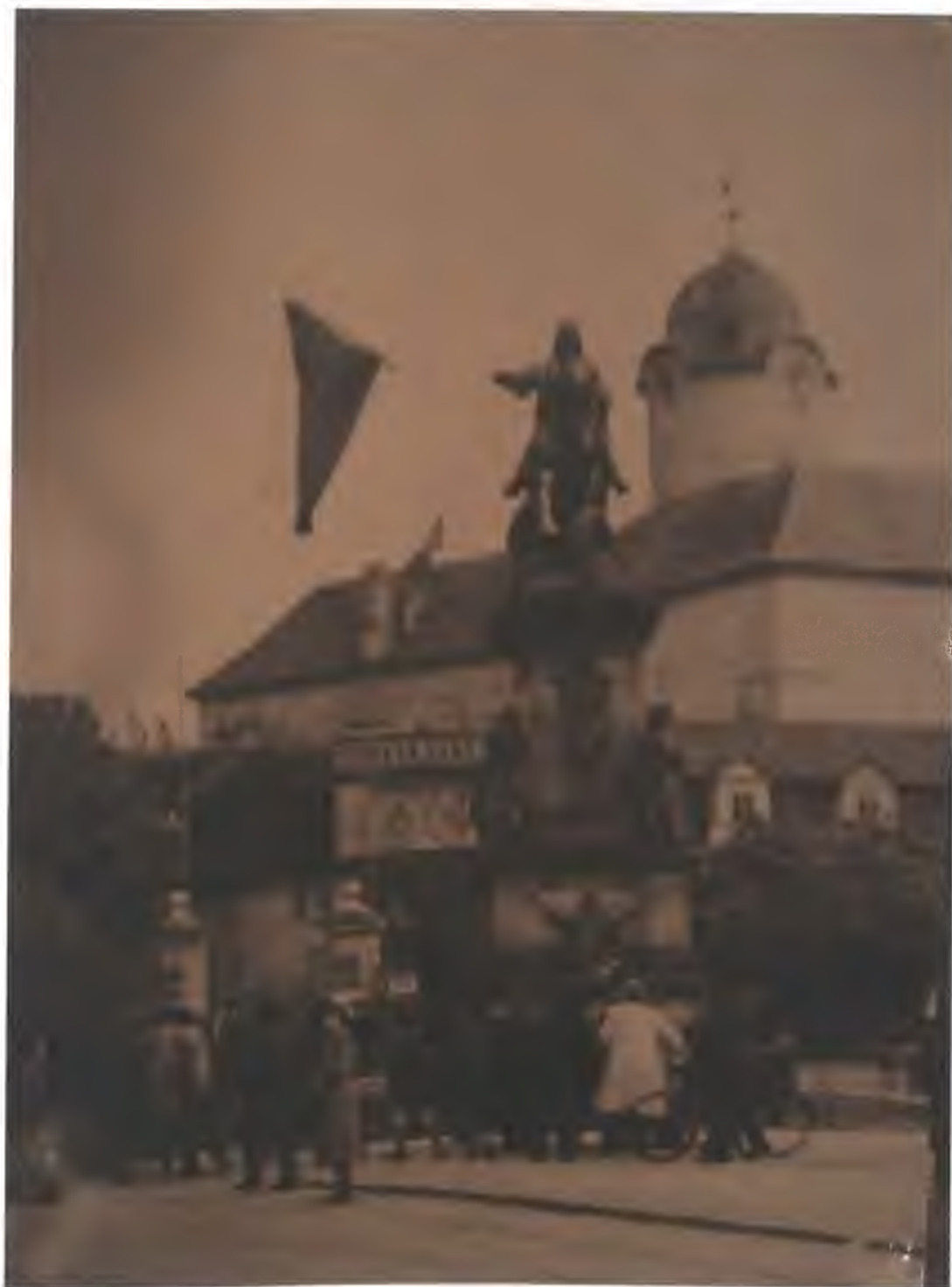
Fotografie č. 6