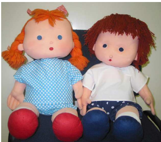
Obrázek 10 - panenky Jája a Pája oblečené