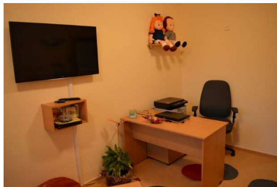
Obrázek 3 - výslechová místnost - pohled b