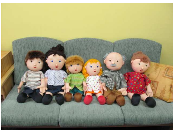
Obrázek 12 - panenky představující další členy rodiny