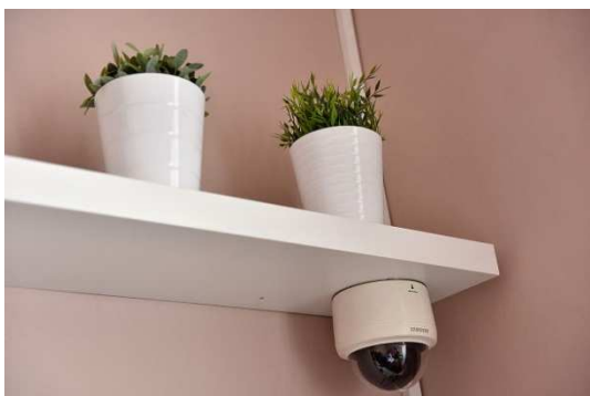
Obrázek 8- záznamová technika ve výslechové místnosti