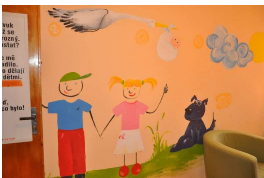
Obrázek 4 - dětské motivy na stěnách výslechové místnosti