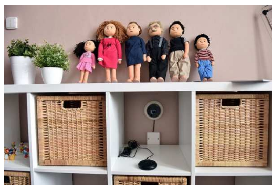
Obrázek 7 - demonstrační pomůcky