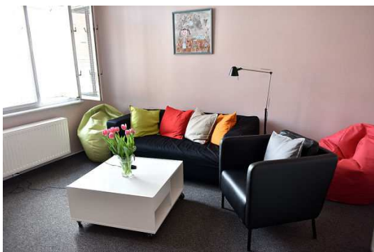
Obrázek 6 - výslechová místnost

speciálního výslechového bytu v pražské ulici Na Perštýně a jeho zařízení jsou zobrazeny na obrázcích Obrázek 6 až Obrázek 9 níže. 143