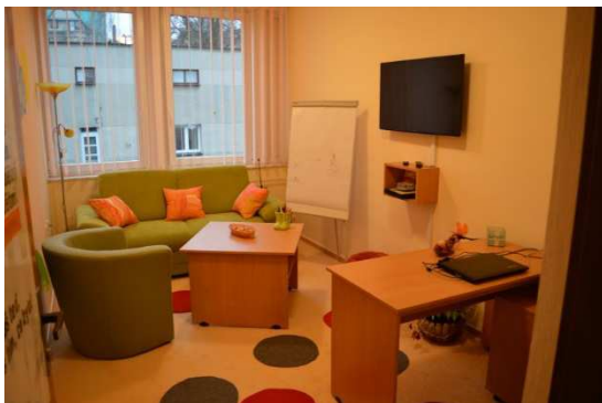
Obrázek 2 - výslechová místnost - pohled a

technikou, která je však schovaná tak, aby ji oběť nevnímala a nebyla jí stresována. 141 Fotografie uvedené speciální výslechové místnosti v Jablonci nad Nisou jsou zobrazeny na obrázcích Obrázek 2 až Obrázek 5 níže. 142