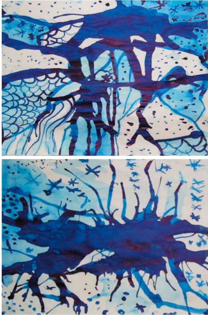
Obr. 19 - 20: Obrazová příloha k lekci Jak si hraje Mráz a Meluzína