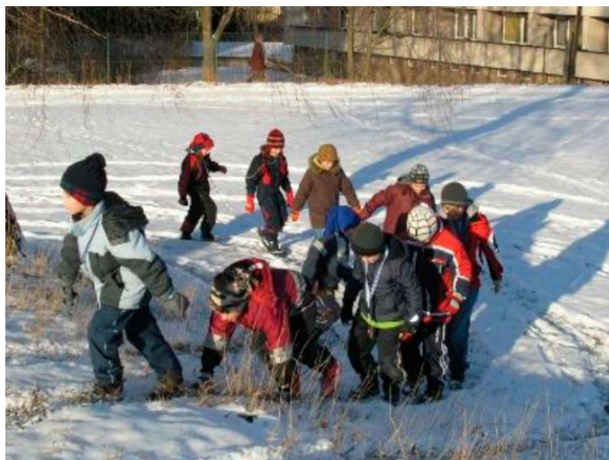
Obr. 16 : Obrazová příloha k lekci Labyrint

neměl trvale proměnit či poškodit. Nejsem si však jista, zda jsem jim tento úmysl dokázala dostatečně podat a vysvětlit. Myslím si ale, výtvarná akce byla určitým pokusem o souznění dětí s prostředím, s druhým člověkem.