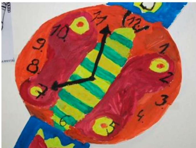
Obr. 23 - 24: Obrazová příloha k lekcí Hodinky