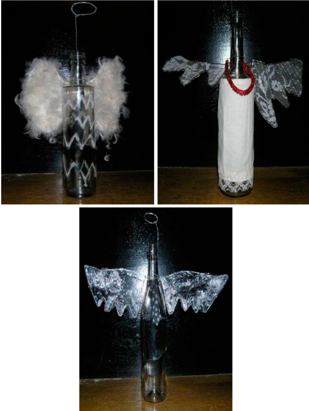
Obr. 5 - 7: Obrazová příloha k lekci Andělská párty