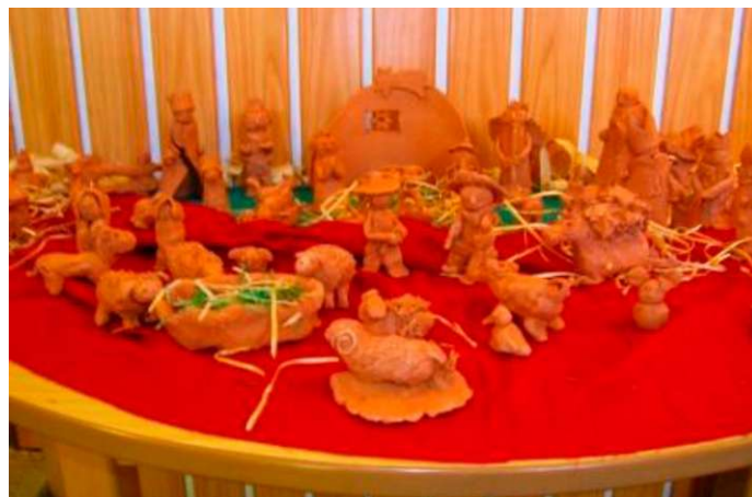
Obr. 11: Obrazová příloha k lekci Betlém

Matěj (6 let): „Nám nešla udělat postava, tak jsme z ní udělali kuličku a vymodelovali jsme z ní ovečku, ta se nám povedla.“