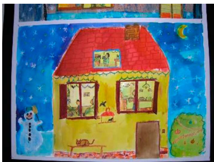
Obr. 12: Obrazová příloha k lekci U nás doma

Jára (7 let): „Vánoce mám moc rád, protože táta má čas si se mnou hrát a máma mi čte pohádky.“