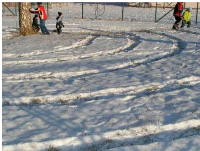
Obr. 17 : Obrazová příloha k lekci Labyrint