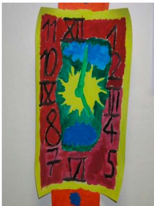
Obr. 21 - 22: Obrazová příloha k lekcí Hodinky