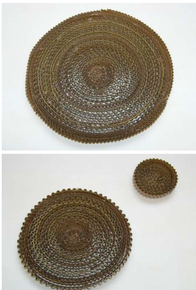
Obr. 27 - 28: Obrazová příloha k lekci Letokruhy