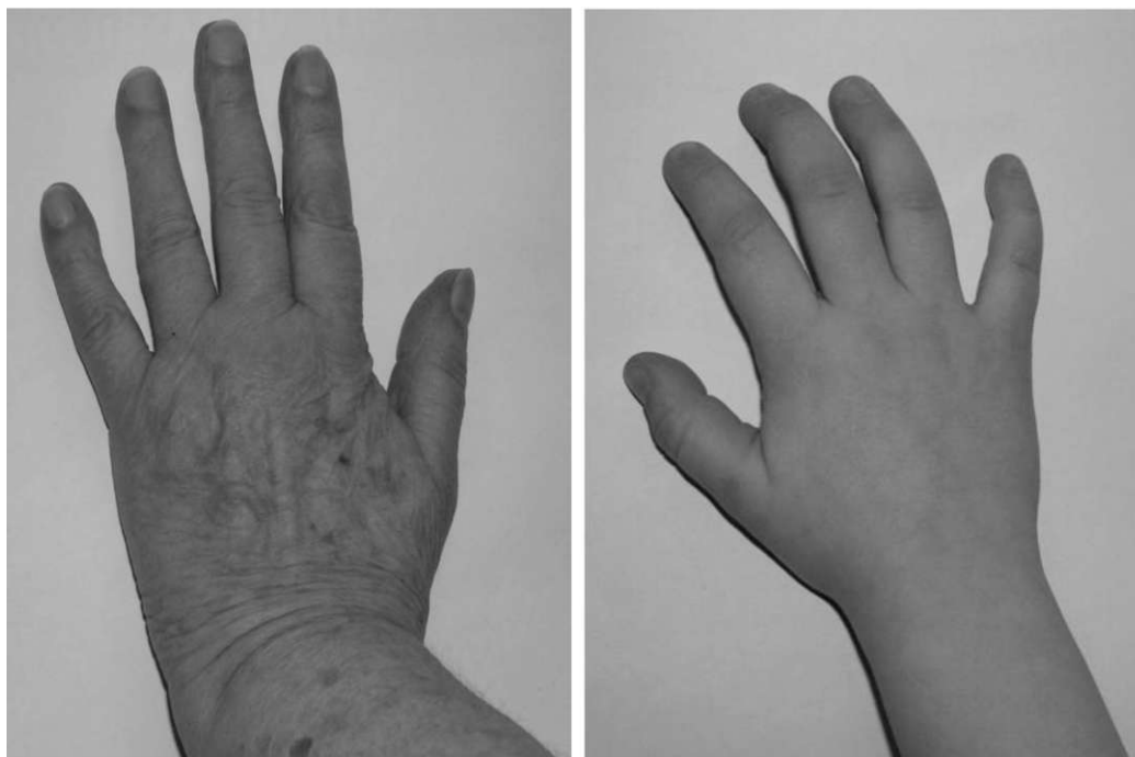
Obr. 32: Obrazová příloha k lekci Ruce

Anežka (7 let): „Já takhle stará nebudu.“