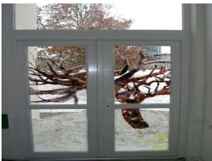
Obr. 13 -14: Obrazová příloha k lekci Co vidím za oknem