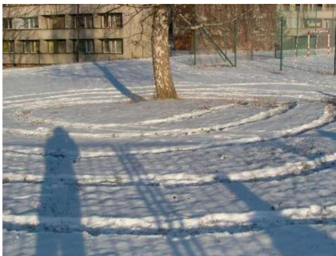
Obr. 18: Obrazová příloha k lekci Labyrint