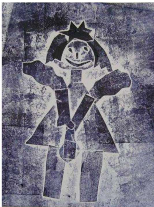
Obr. 1 - 4: Obrazová příloha k lekcí Anděl