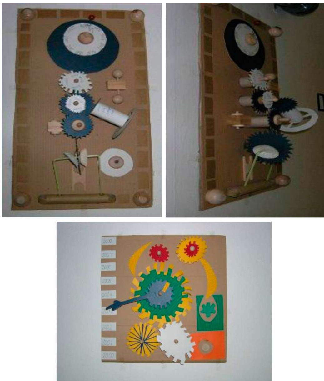
Obr. 29 - 31: Obrazová příloha k lekci Stroj času