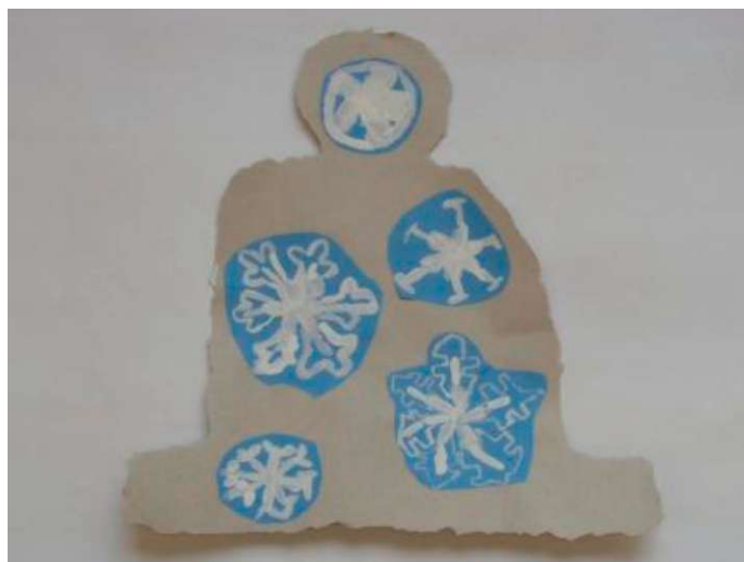
Obr. 15: Obrazová příloha k lekci Vločky na čepici

Matěj (6 let): „Ale byl bys užitečnej, voda, která by z tebe vznikla, by zase mohla pomoci někomu dalšímu - třeba stromům.“