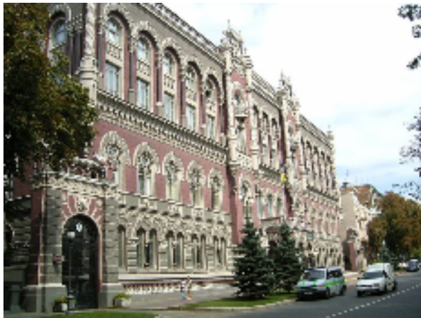
Obrázek 4. Budova NBU