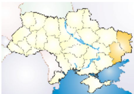
Obrázek 6: Doněcká uhelná pánev