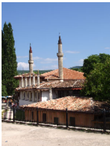
Obrázek 2: Chánův palác na Krymu

Kapitolu věnovanou všeobecným dějinám Ukrajiny jsem vytvořil na základě internetových stránek wikipedia.org, vycházel jsem z 3 verzí stránek: ruské, české a ukrajinské.