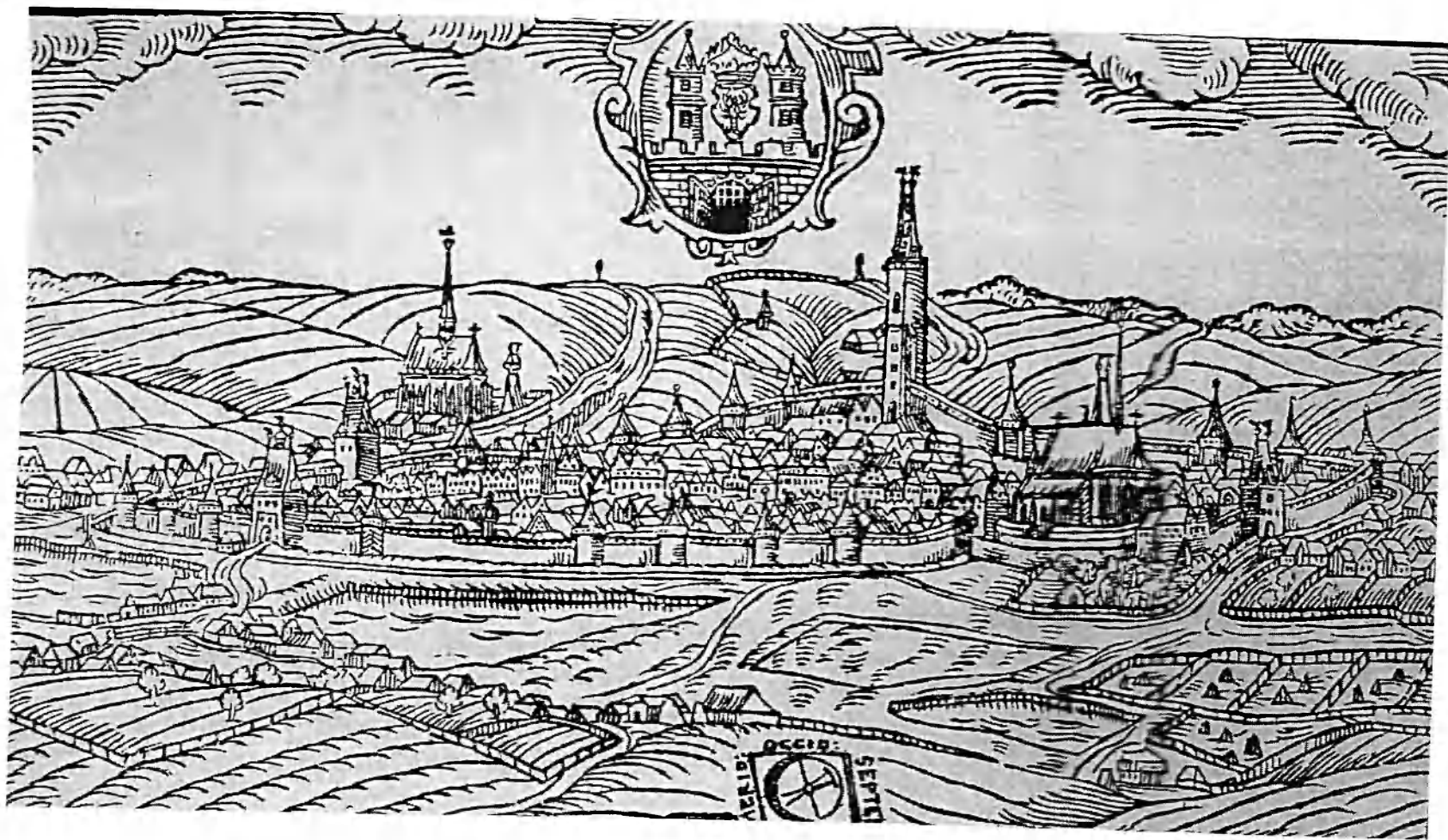
Obr. č. 1 Rakovník dle kresby J. Willenberga z počátku 17. století