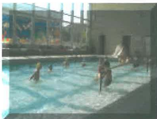
Foto č. 6 Tobogán