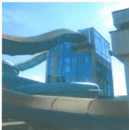
Foto č. 7 Sportovní Hala Města Příbram