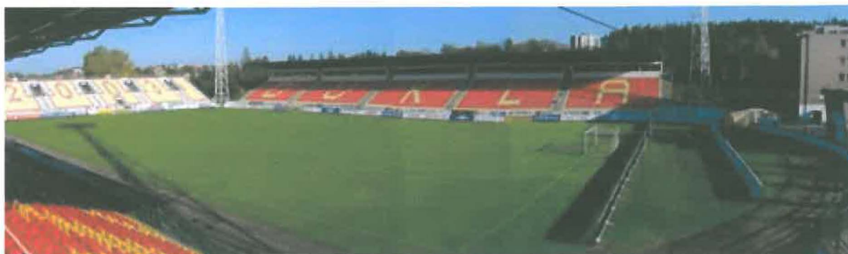
Foto č. 2 VO Vavex Příbram A-tým