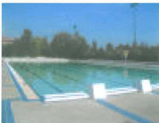
Foto č. 4 Dětský bazének