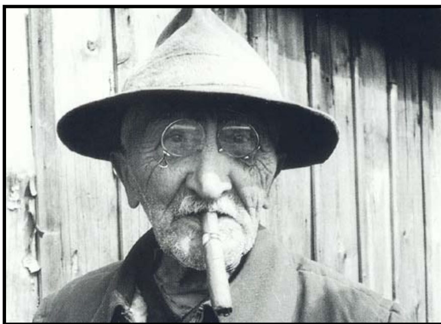
Obr. č. 4: J. Váchal ve Studeňanech (1967)

Přestože Váchal všechny uvedené znaky naplňuje, u prvního z nich se objevila jistá pochybnost. Vzhledem k tomu, že Váchal nespolehá na pozitivní změnu ve vztahu člověka a přírody, a naopak mnohokrát hovoří o budoucích katastrofálních důsledcích současného neblahého působení lidské společnosti na životní prostředí obecně, nevidí již cesty zpět a nedůvěřuje představám, že přijetí zodpovědnosti by na tomto údělu něco změnilo. Toto přesvědčení nacházíme částečně v Šumavě umírající a romantické , Putování Slovenskem s Calmetem a často na toto téma hovoří o mnoho let později v korespondenci. Jeho úvahy na toto téma se tedy pohybovaly poněkud v jiné rovině, než je dnes i mezi environmentalisty běžné. Své pomyslné kolegy totiž předčil ve svém pesimismu, neboť nedoufá v nápravu, i v optimismu, neboť se na rozdíl od nich domnívá, že budoucí katastrofa a následně silná redukce lidstva bude vítaná.