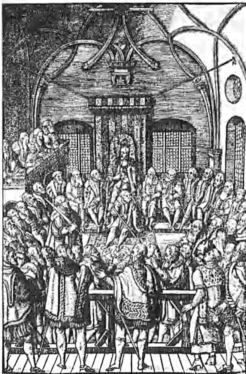
Obr. 4. Zemský soud na dřevořezu 1563

téměř všech přítomných jsou upřeny k panovníkovi, jehož pozvednuté žezlo naznačuje, že právě on nyní mluví. A je i patrné, že mluví směrem ke katedře. Hlavní komunikační osa tak probíhá mezi králem a nejvyšším písařem, což zdůrazňují nejen pohledy přítomných, ale i směr maršálkova meče a purkrabské hole. Dá se říci, slovy fotografie, že naše oči jsou „taženy“ na linii král – nejvyšší písař. Zda-li je to záměr, či náhoda, může napovědět jméno zadavatele vyobrazení. Je jím Volf