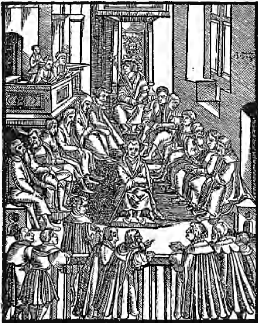
Obr. 3. Zemský soud na dřevorezu 1530

Nabízí se otázka, kdo je na tomto obraze nositelem akce, nepočítáme-li zástupce stran za šraňkami, kteří jsou v pohybu zobrazeni vždy. Vidíme na několika příkladech, že soudci mezi sebou hovoří a jsou to právě oni, kdo má mít hlavní slovo při vynášení nálezu. Role krále je zde pojata velmi staticky, tedy přesně tak, jak ji chtěla vyšší šlechta v době největšího rozmachu stavovské moci mít. Opačné vyznění lze však nalézt na dřevorezu z roku 1563, 319 kde je nositelem práva jednoznačně král. Oči