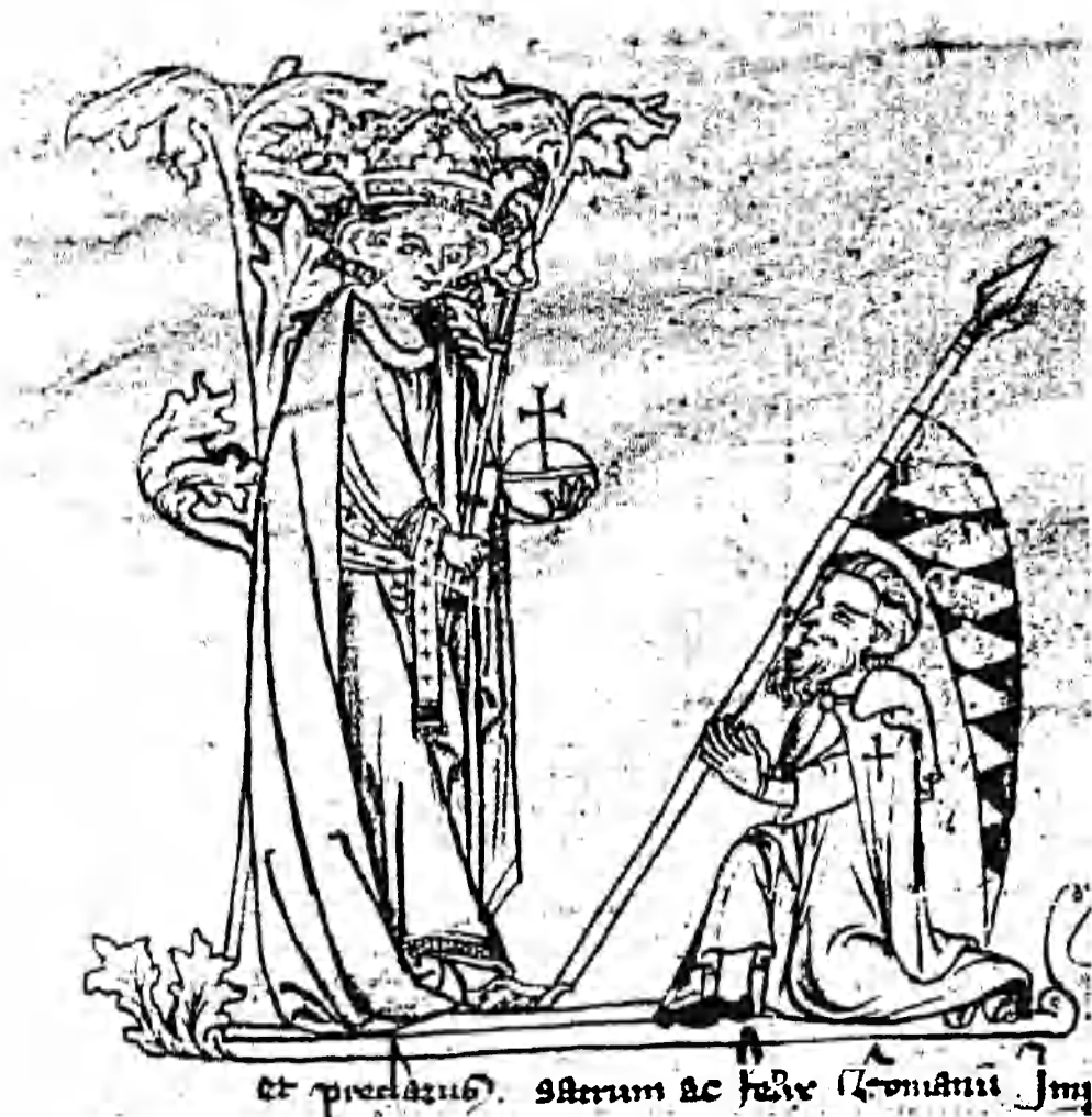
Obr. 2. Ludvík předává velmistrovi Řádu německých rytířů bavorský praporec

potvrzujících udělení erbu, jak se ustálila během pozdního středověku, obsahuje formuli, že uchazeč získává erb neboli znamení vladyctví. 26 Souvislost erbu a šlechtictví, která zřetelně vystupuje i z dalších pramenů, nicméně naráží na skutečnost, že se – pomineme-li právnické osoby jako církevní instituce či městská sídliště – poměrně záhy rozšířilo užívání erbových znamení i u měšťanů. Rozpaky v této otázce panují ostatně i v zahraničním dějepisectví. Základní práce německé historiografie,