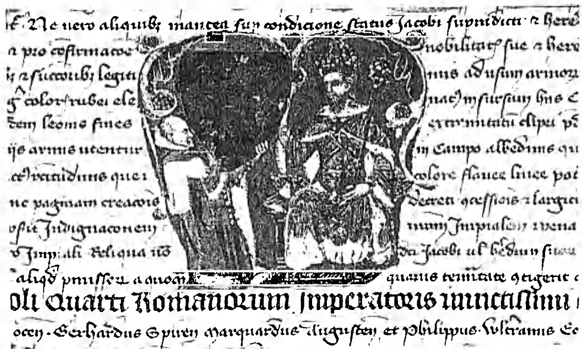
Obr. 1: Nobilitační listina pro Jakuba ze Santa Croce

časnějšího období, než dosavadní literatura předpokládala. Ovšem i pokud se přidržíme mlvy diplomatických pramenů a vročíme počátky nobilitací do období vlády Karla IV., nalezneme zde indicii, která může upomínat na starší vývoj. Je jí miniatura na jedné ze dvou v originále dochovaných císařových povyšovacích listin, v tomto případě pro Jakuba ze Santa Croce. 20 Iluminace ve tvaru unciálního M, která je umístěna do středu listiny, znázorňuje předání erbu. (Obr. 1) Na pravé straně se trůnící císař obrací ke klečícímu příjemci, který přebírá z panovníkových rukou štít s vymalovaným erbem. 21 Listina se svým ikonografickým programem liší od způsobu, jakým byly nobilitační listiny zhotovovány později. V naprosté většině se zde objevují pouhé erby; pokud byl na listině vyobrazen panovník, tak především v majestátu či jako strážce erbu (tuto funkci ovšem plnili spíše andělé). 22 V obou typech jde o