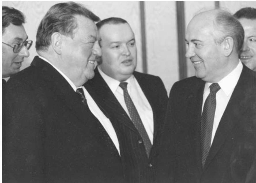
Franz Josef Strauss a Michail Sergejevič Gorbačov (Moskva, 1987)