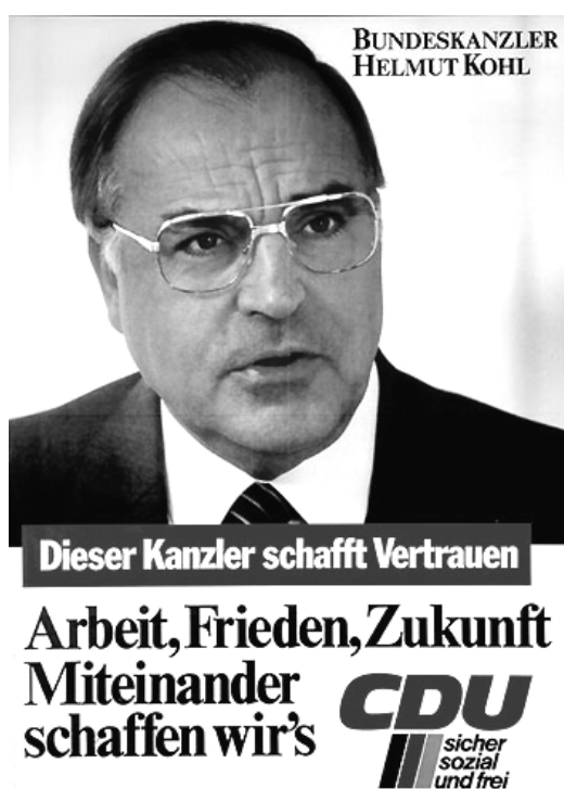
Helmut Kohl na volebním plakátu CDU (Bonn, 1983)