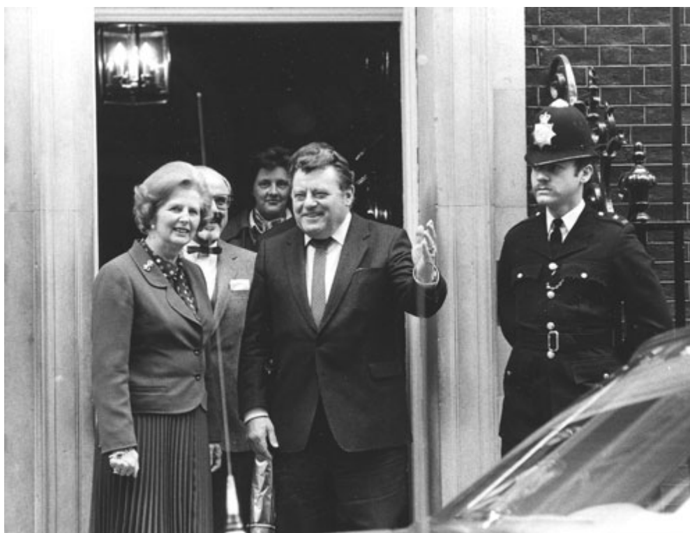
Franz Josef Strauss s britskou premiérkou Margaret Thatcherovou (Londýn, 1979)