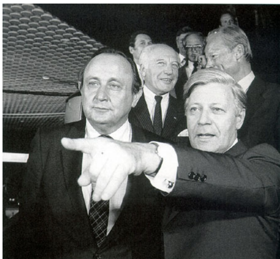
Spolkový kancléř Helmut Schmidt (vpravo) a ministr zahraničí Hans-Dietrich Genscher (Bonn, 5. října 1980)