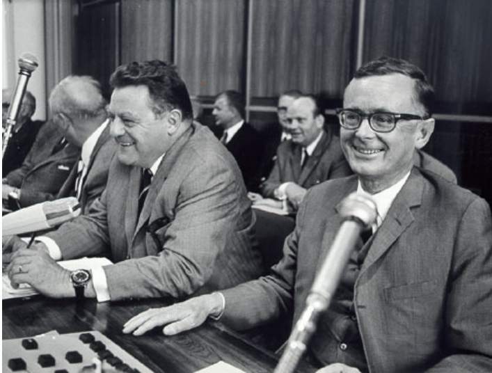
Ministr financí Franz Josef Strauss a ministr hospodářství Karl Schiller (Bonn, 1968)