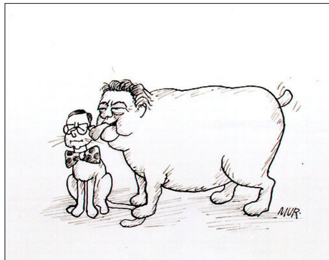
„Plisch a Plum“ (Strauss a Schiller)