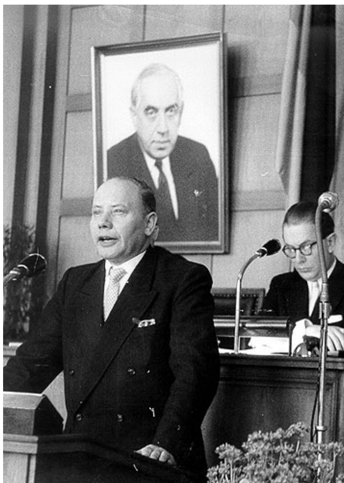
Ministr obrany Theodor Blank na zasedání Spolkové rady (Západní Berlín, 16. března 1956)