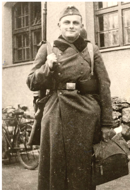
Vojákem na počátku 2. světové války (Landsberg nad Lechem, 1939)