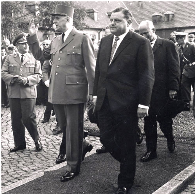
Francouzský prezident Charles de Gaulle s ministrem obrany Straussem při návštěvě důstojnické akademie Bundeswehru (Hamburk, 1962)