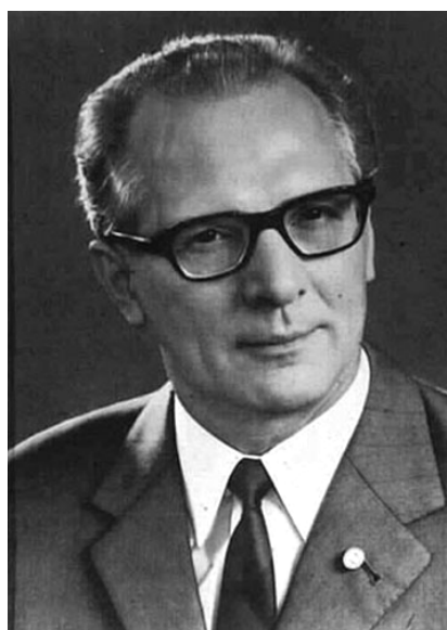
Portrét předsedy Státní rady NDR a generálního tajemníka ÚV SED Ericha Honeckera