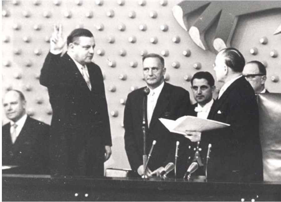
Nový ministr obrany Strauss skládá přísahu před Spolkovým sněmem (Bonn, 1956)