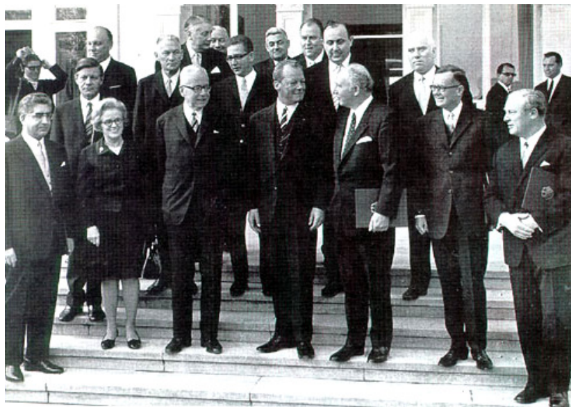
Koaliční kabinet SPD a FDP kancléře Willyho Brandta (Bonn, 22. října 1969)