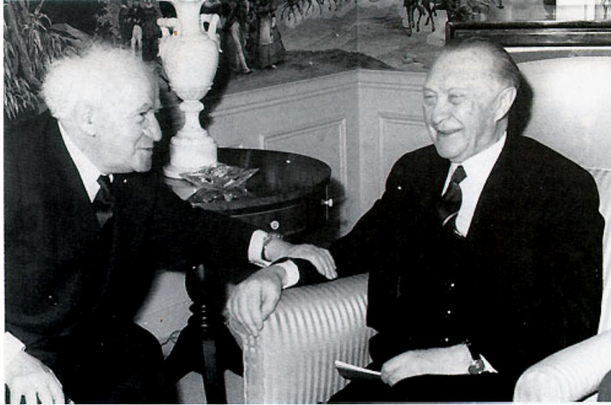
Izraelský předseda vlády David Ben Gurion (vlevo) při setkání se spolkovým kancléřem Konradem Adenauerem (New York, březen 1960)