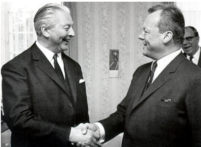
Spolkový kancléř Kurt Georg Kiesinger a ministr zahraničí Willy Brandt (vpravo) (Bad Dürkheim, 9. června 1968)