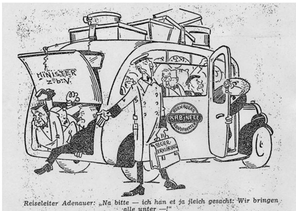
Druhý kabinet Konrada Adenauera (v kufu Franz Josef Strauss) (Münchner Merkur, 1953)