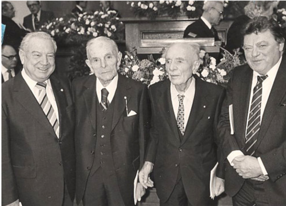
Čtyři bavorští premiéři – Alfons Goppel, Hans Ehard, Wilhelm Hoegner a Franz Josef Strauss (zleva doprava) (Mnichov, 1979)