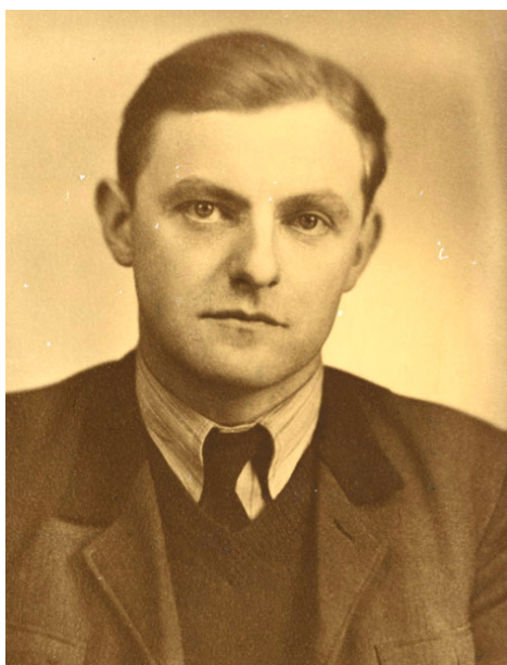
Zemským radou v Schongau (roku 1949)