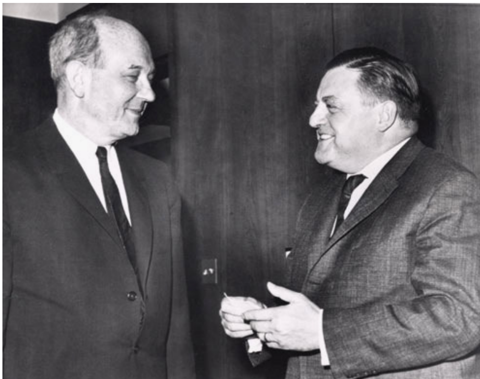
Strauss s americkým státním tajemníkem Deanem Ruskem (roku 1961)