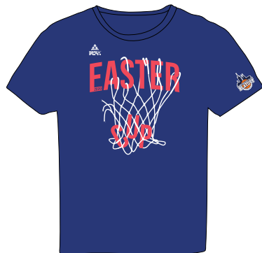
1. NÁVRH - PŘEDEK