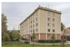
50. léta 20. století

1. Červeně ve fotografiích označte, co se změnilo, a modře, co zůstalo stejné. Popište označené body.