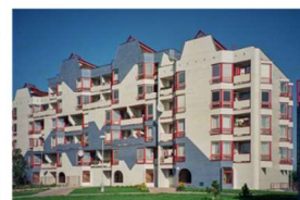
80. léta 20. století