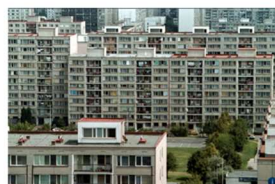
70. léta 20. století