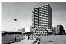
60. léta 20. století