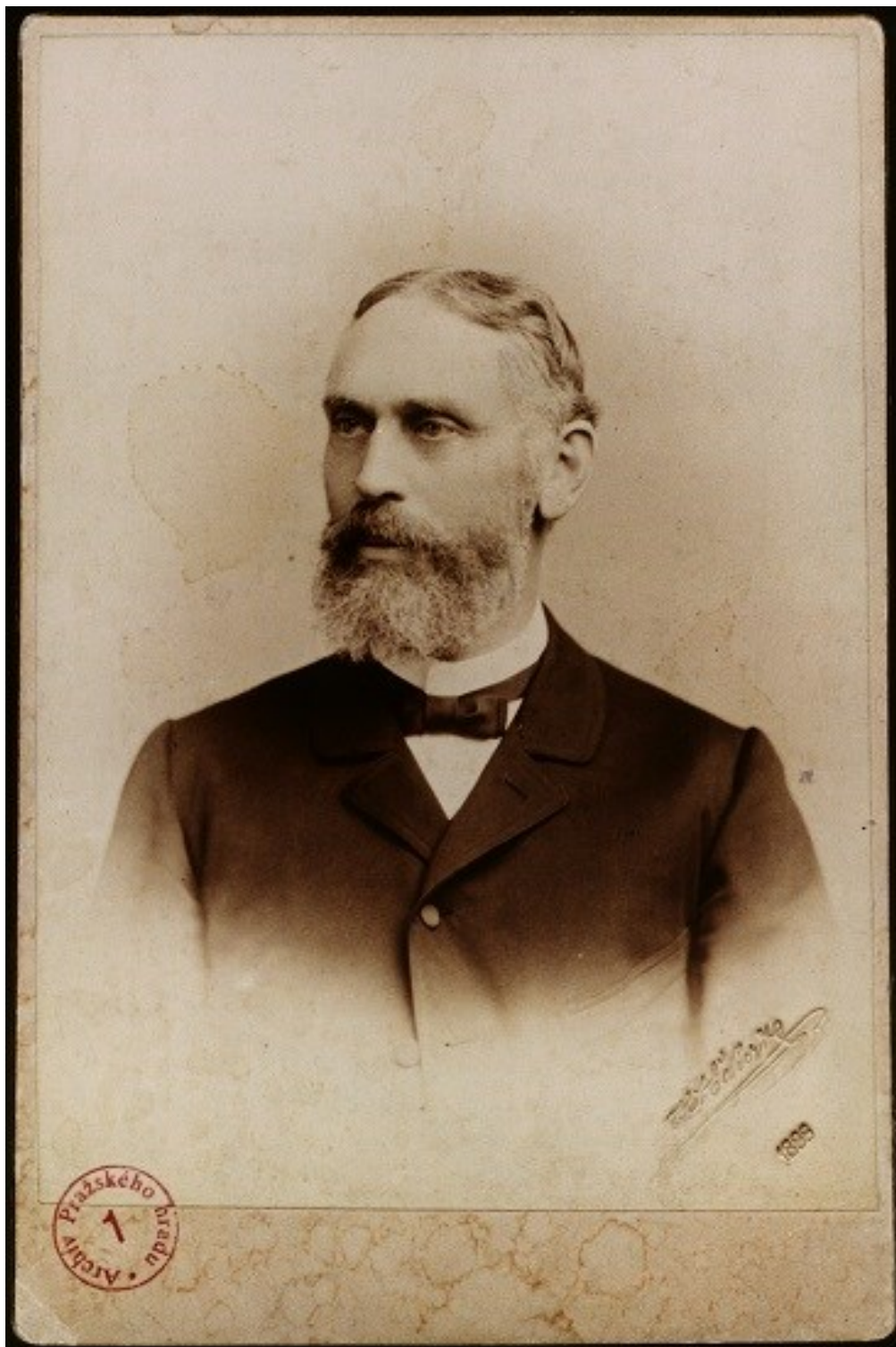
Obr. 1 Josef Mocker. Poslední vyhotovený portrét architekta před jeho smrtí v roce 1899.