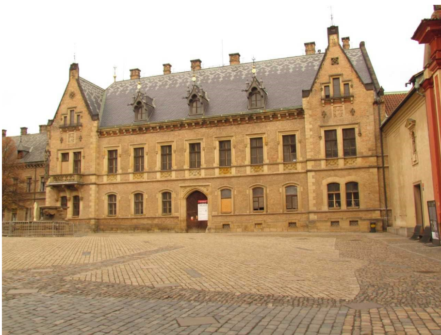
Obr. 8 Budova tzv. Nového probošství na Pražském hradě.