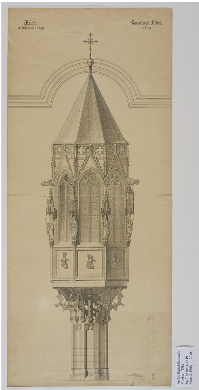
Obr. 6 Arkýř na Karolinum, 1881.

Archiv pražského hradu, Josef Mocker – osobní pozůstalost. T 66/1419.