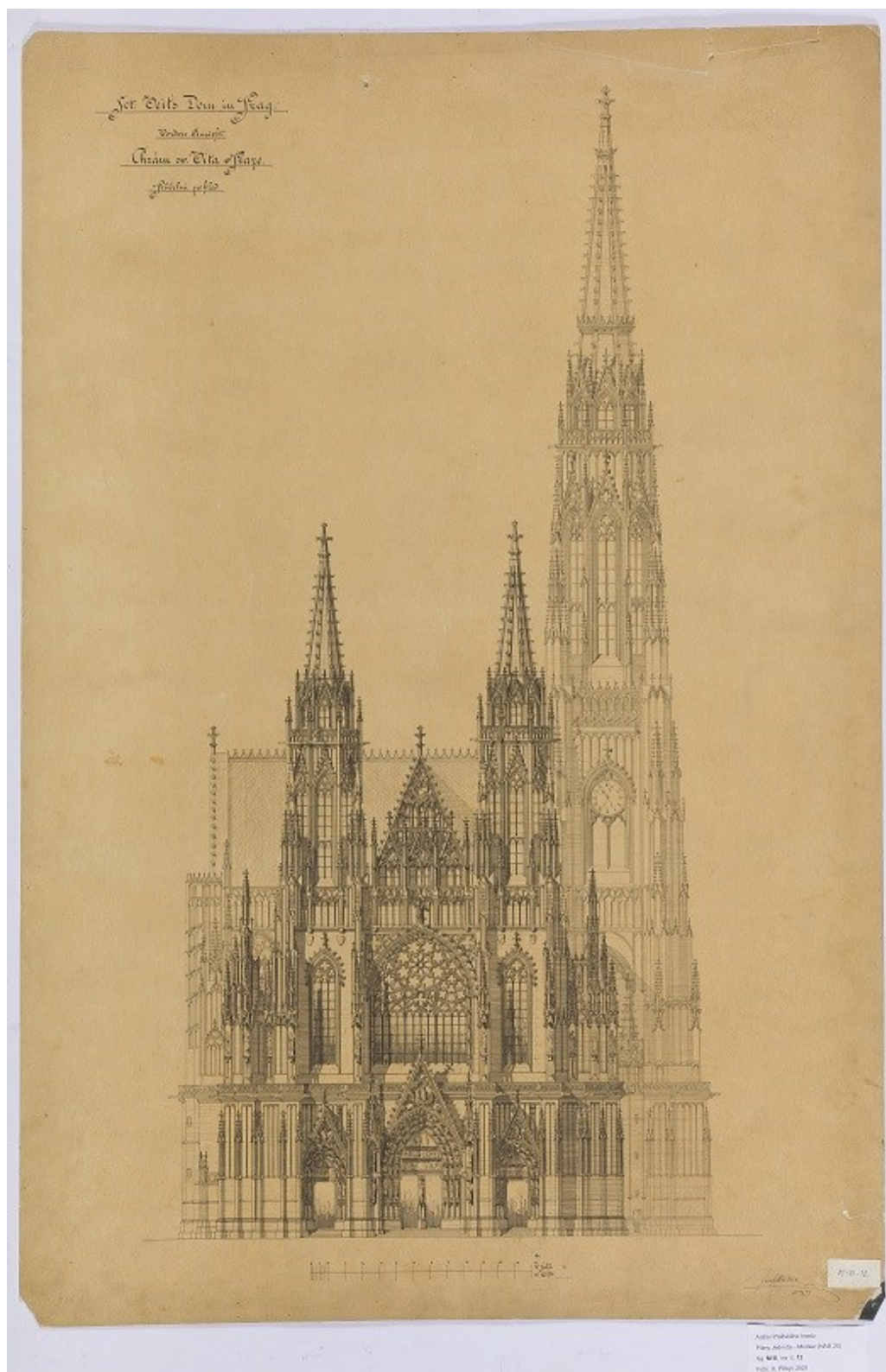
Obr. 3 Návrh západního průčelí včetně regotizované hlavní věže, 12.3.1877.

Archiv pražského hradu, Jednota – plány. Sg. M III, inv. č. 12.