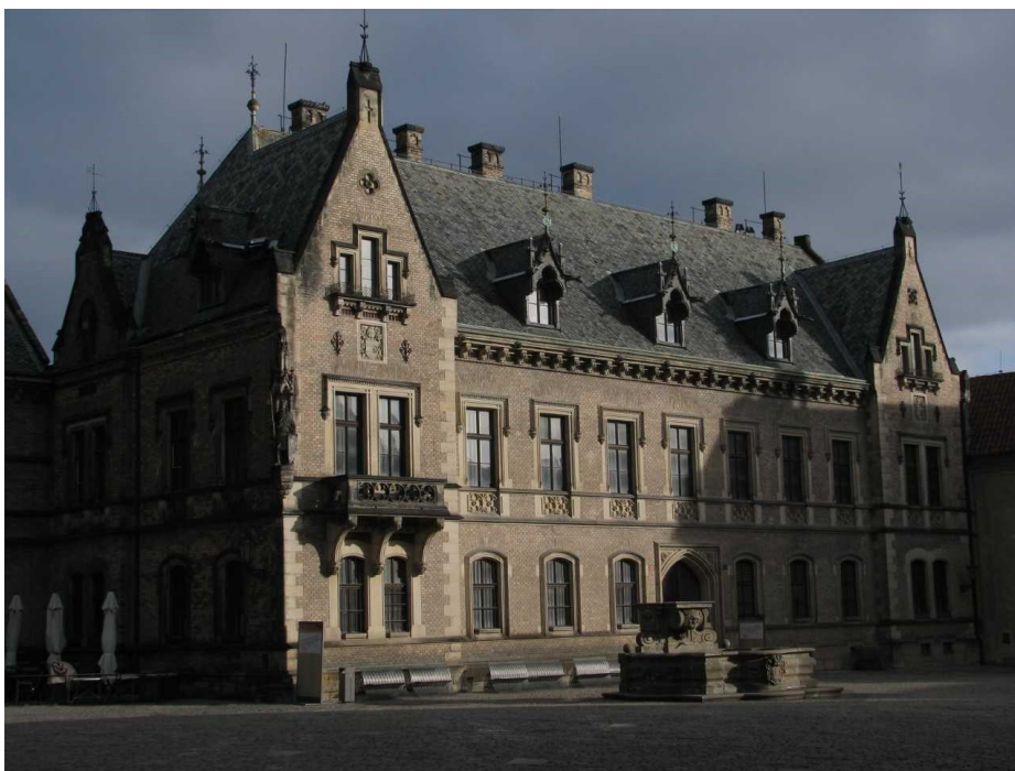
Obr. 7 Budova tzv. Nového probošství na Pražském hradě. Stav před rekonstrukcí.