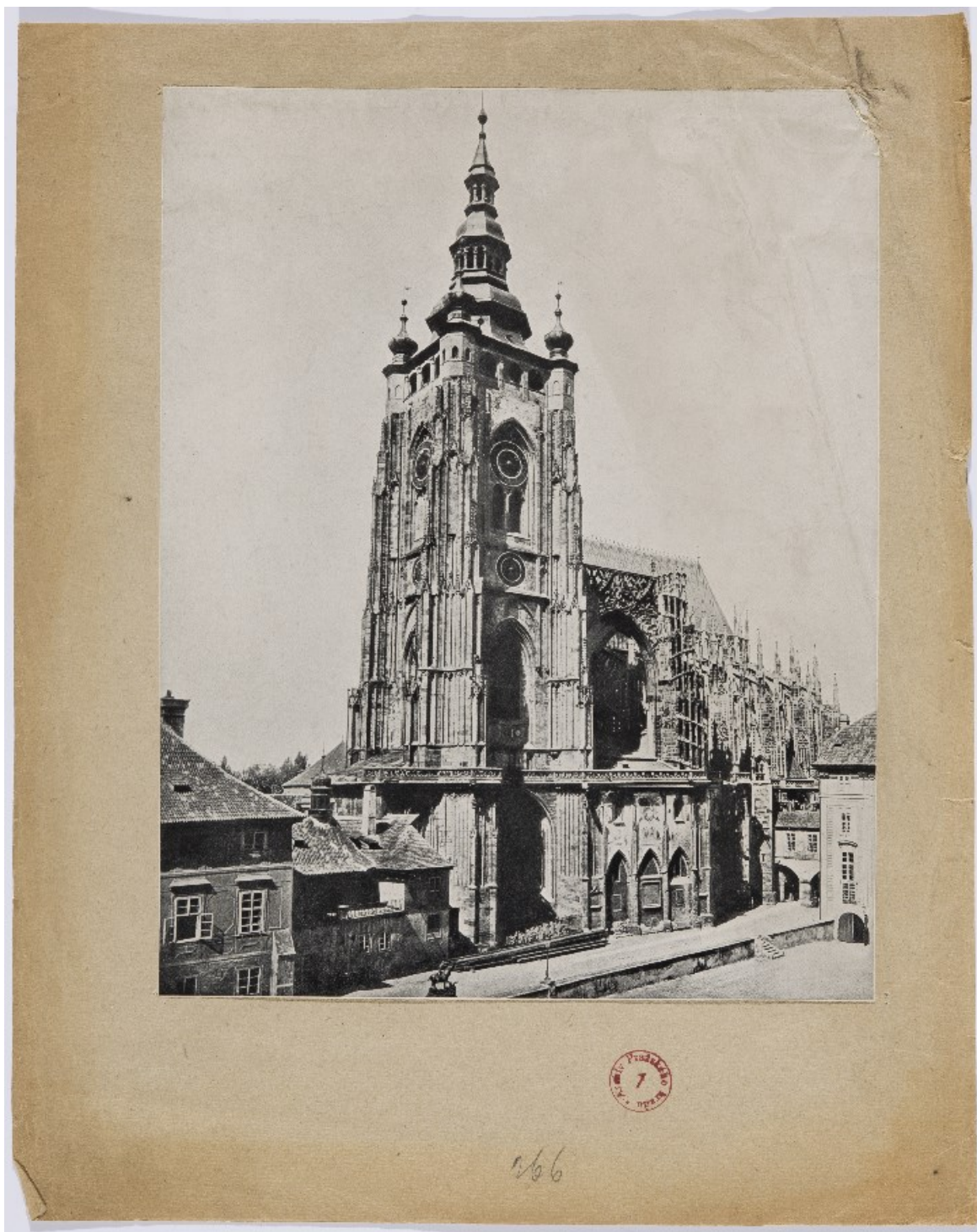
Obr. 2 Katedrála sv. Víta, Václava a Vojtěcha. Stav před dostavbou.

Archiv pražského hradu, Jednota – Foto, inv. č. 951.