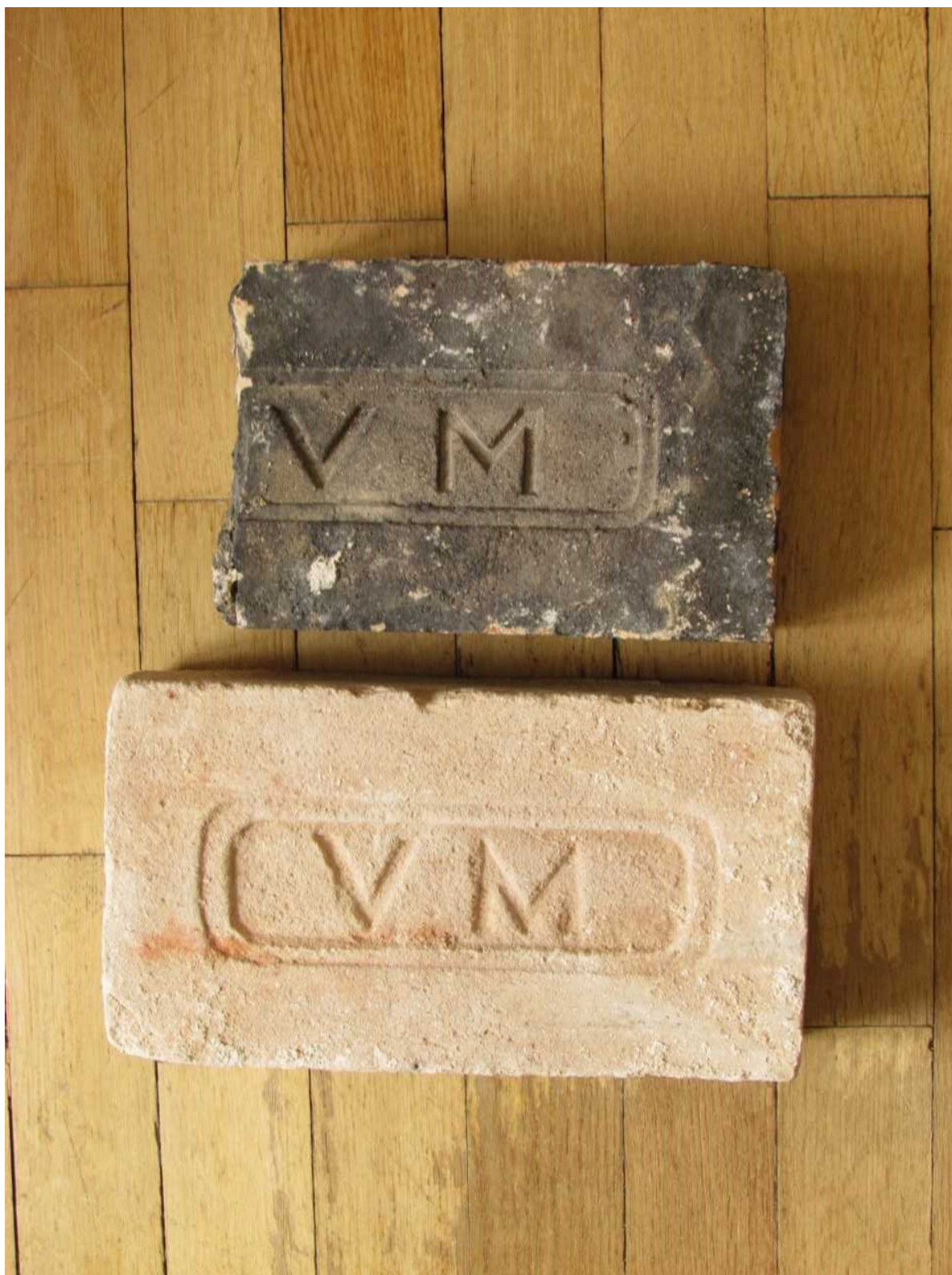
Obr. 9 Nalezené cihly z budovy tzv. Nového probošství na Pražském hradě s iniciálami „VM“. Produkce rodinné cihleny Václava Mockera, Cítoliby.