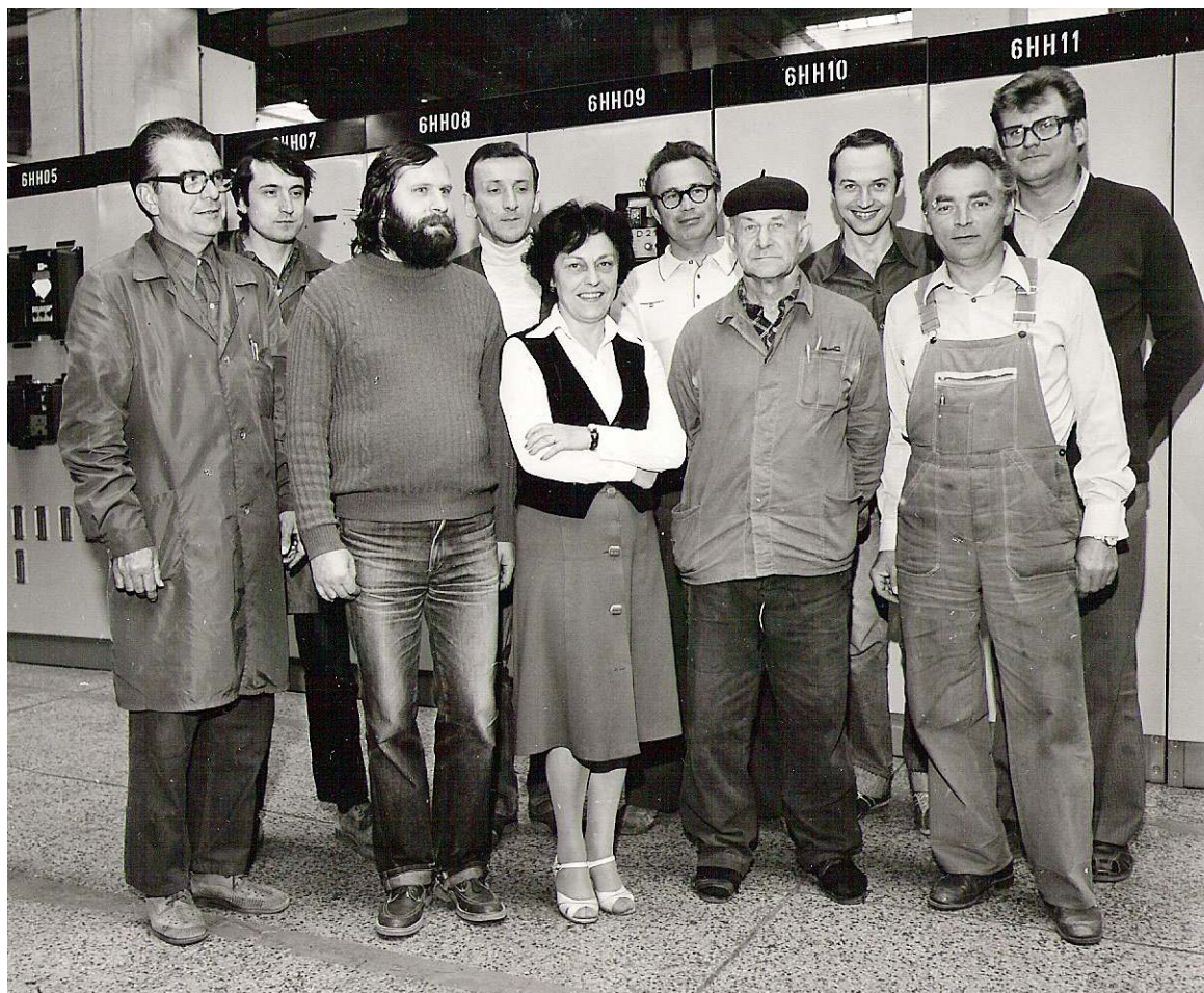
obrázek 1: BSP výstupní kontroly