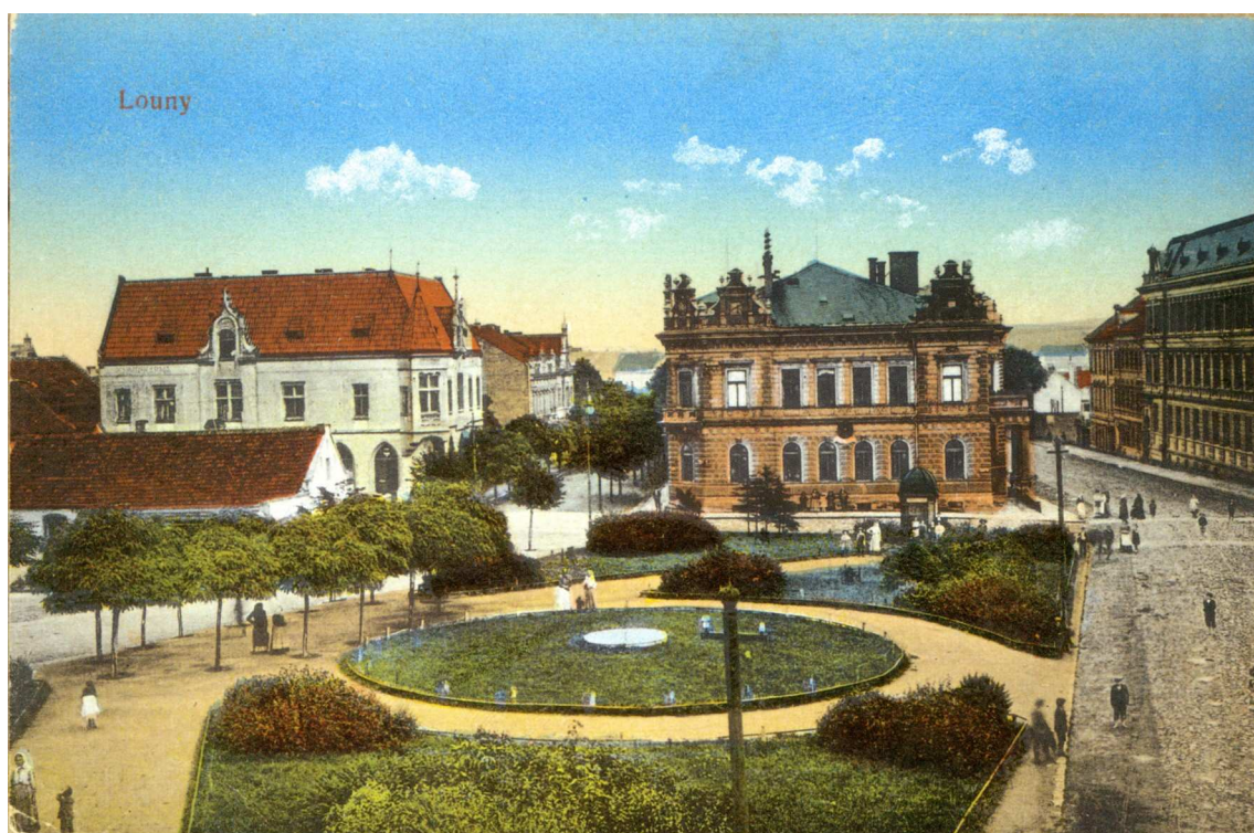
Park před sokolovnou na dobové pohlednici