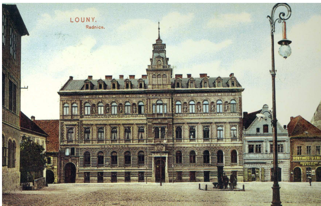
Nová radnice na dobové pohlednici

Ale zpět do osmdesátých let. Roku 1884 začal Hilbert uvažovat o stavbě nové radnice. Ta dosavadní byla umístěna v domě u Tří lip, který město vlastnilo od roku 1869. Zastupitelstvo se rozhodlo tento starobylý dům strhnout a na jeho místě postavit novou radnici. Ve veřejné soutěži zvítězil návrh architekta Saturnina Hellera. Podle jeho plánů byla postavena radnice nová, která napodobuje svým vzhledem renesanční sloh původního domu. Byla dokončena roku 1887 a od 7. prosince téhož roku se sem stěhuje obecní úřad.