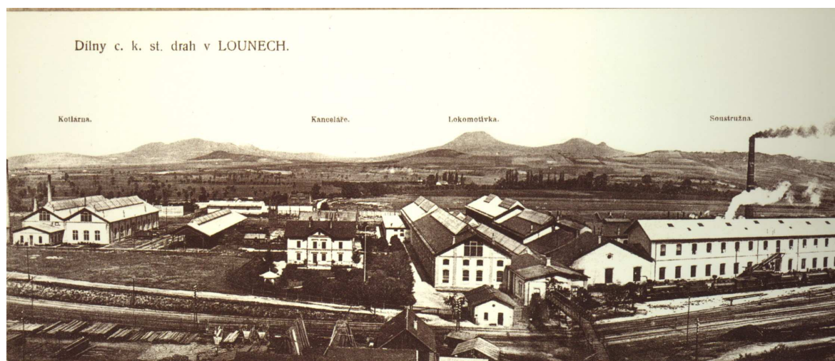
Dílny c.k. státních drah v Lounech