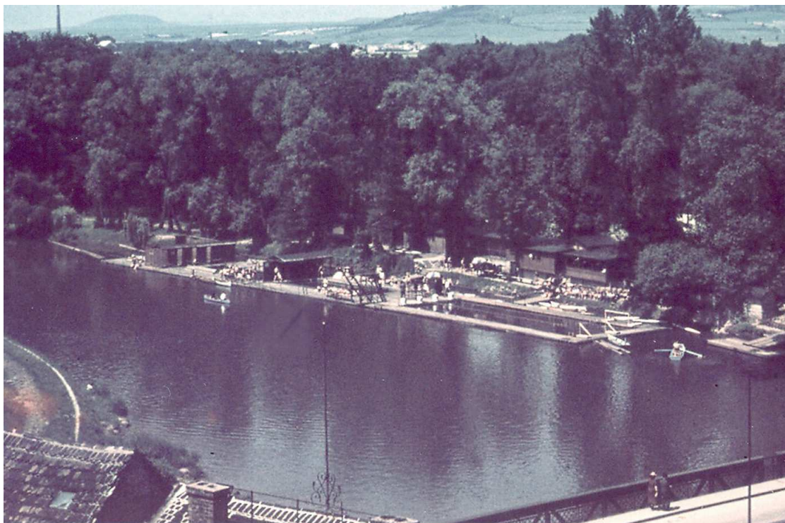
Fotografie lounské plovárny z 30. let 20.století