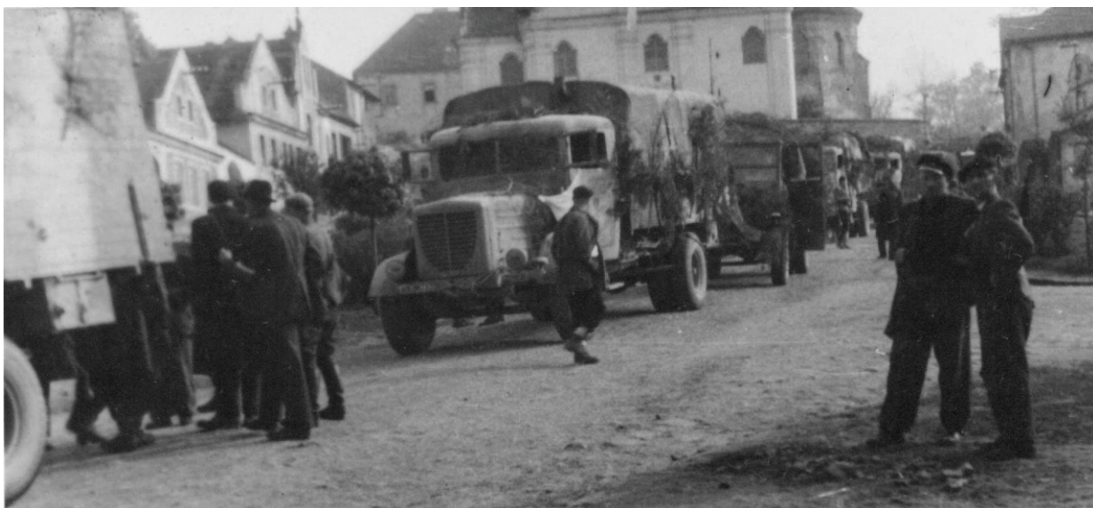
Obrázek 10 - německá armáda v Mnichovicích.