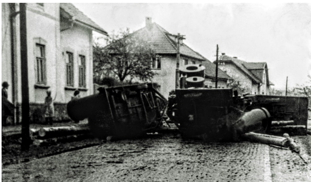
Obrázek 2- © Archiv Mníchovice, mníchovické zátarasý.