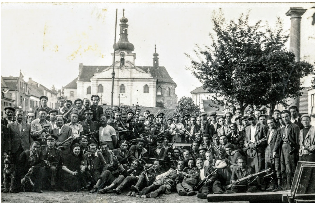
Obrázek 9 - © Archiv Mnichovice, mnichovičtí odbojáři a partyzáni.