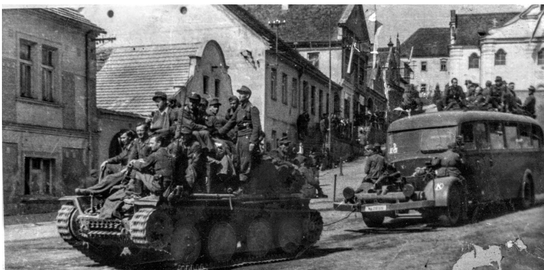
Obrázek 5- © Archiv Mnichovice, odjezd německé armády v Mnichovicích.