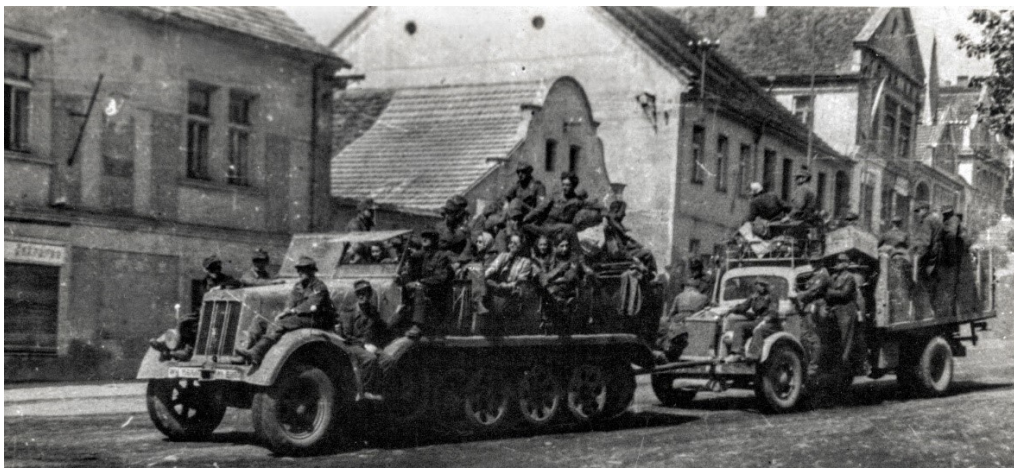
Obrázek 6 - odjezd německé armády v Mnichovicích.