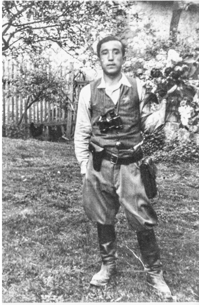
Obrázek 12