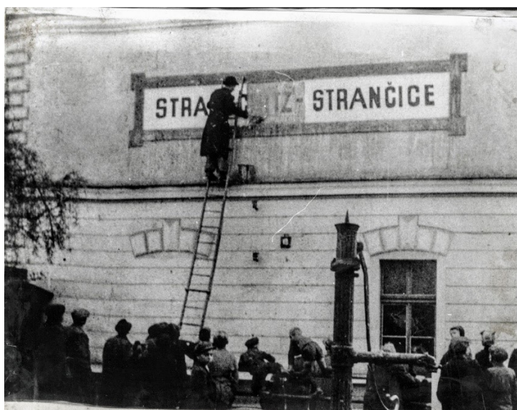
Obrázek 8 – zbavování se německých nápisů ve Strančicích.