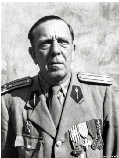
Obrázek 3 - © Archiv Mnichovice, Major Jiří Švehla.