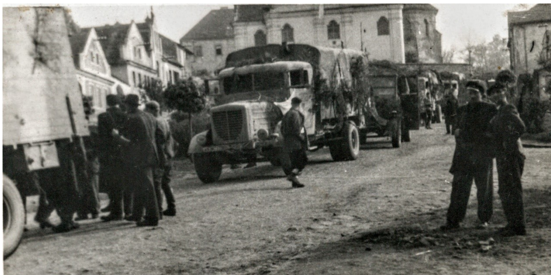
Obrázek 4 - © Archiv Mnichovice, odjezd německé armády v Mnichovicích.