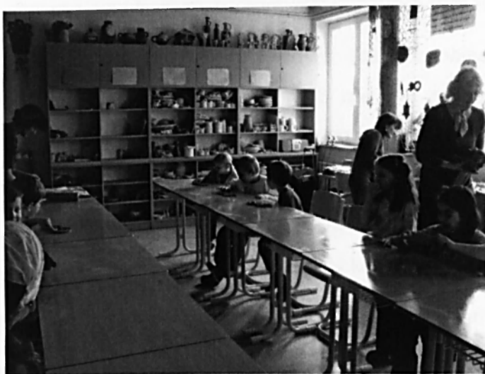
Návštěvníci kroužku keramiky v Brně- žabovřesky.

Zájmové kroužky: jsou zaměřené na zájmovou výuku v oblasti hudby, jazyků, ručních prací nebo sportu; vedle naučení dovedností je cílem kroužků také vytvoření vztahů ve skupině a vztahů k oboru zájmu.