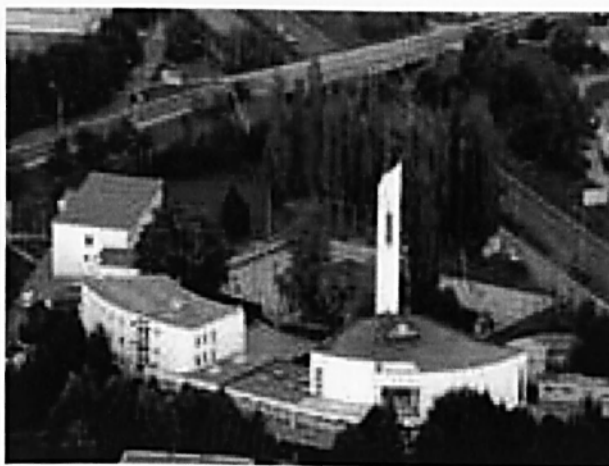
Letecký pohled na kostel, středisko a ubytovací prostory. 90

Poprvé mohou děti a mládež přijít do střediska nezávazně, podívat se, prohlédnout si všechno... Při druhé návštěvě si pracovníci střediska zaznamenají kontakt na rodiče a po zaplacení ročního příspěvku 100Kč se stávají registrovanými členy střediska. Tato registrace je vnímána jako výhoda, která umožňuje půjčování sportovních potřeb, vstup na kulečnický, do posilovny... Tento postup se pracovníkům zařízení osvědčuje, neboť vnímají určité riziko, které by plynulo z úplného a nekontrolovaného otevření střediska. „ Nechceme jít cestou nízkoprahového zařízení “, což vysvětluje výše zmíněný postup určité základní registrace příchozích. Podle pana ředitele však dost dobře nejde „rozlišovat otevřený klub a nízkoprahové zařízení“ , neboť otevřený klub navštěvuje víceméně problémová mládež z okolí.