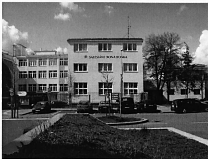
Pohled na část hlavní budovy.

Salesiánské středisko mládeže v Kobylicích je jediným nízkoprahovým zařízením na Praze 8. Středisko řeší potřebu „setkávání se“ mládeže, bez nutnosti organizovaných kroužků, jimiž se zabývají jiné organizace. Toto řešení se snaží předcházet sociálně patologickým jevům, které mohou být důsledkem nevhodného způsobu trávení volného času.