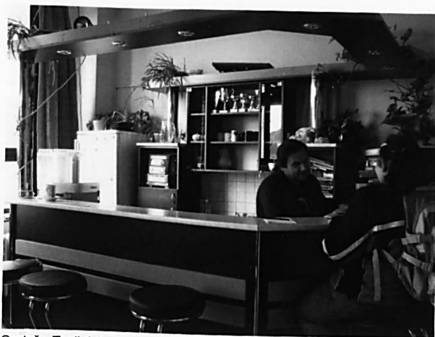
Oratoř v Teplicích