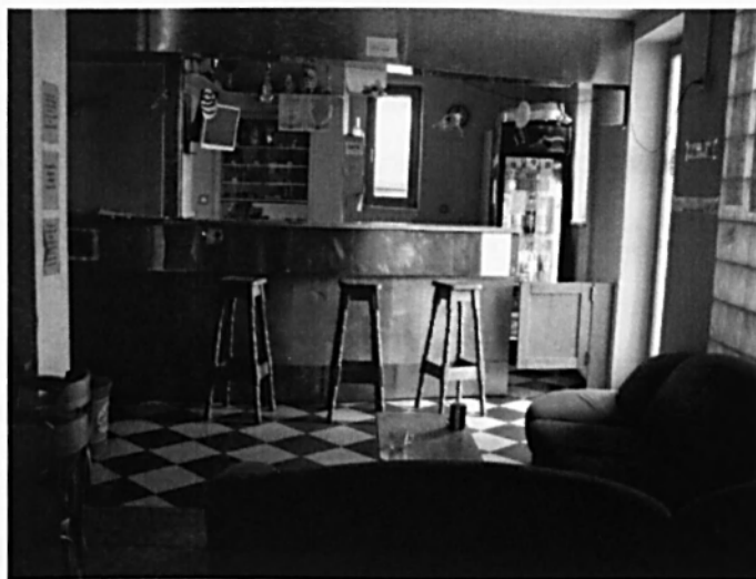
Pohled k nealkobaru.

V současné době nabízí středisko tyto druhy aktivit: kroužky, kluby (Balón, Vzduch/loď) a program pro děti a mládež s výchovnými a školními problémy (Střecha), které je centrem pomoci dětem, mládeži a rodině. Od roku 2003 má středisko i vlastní hřiště s umělým povrchem. V současné době se dokončuje nástavba, která by měla rozšířit prostor a odpovídat nárokům na stále se zvětšující zájem o různé aktivity.