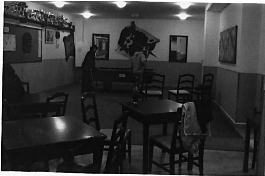
Oratoř v Pardubicích