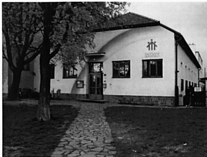
Vchod do střediska.

Program střediska v Budějovicích je tvořen tak, aby oslovil široké spektrum těch, kteří do střediska přicházejí. Jedná se nejen o mládež, která přichází z blízkého sídliště, ale i o celkem početnou romskou komunitu.