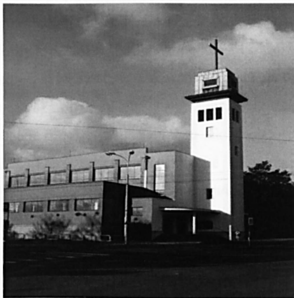
Pohled na kostel sv. Josefa v Ostravě. 105

Situace střediska v Ostravě se v mnoha ohledech podobná situaci, se kterou jsem se setkala v salesiánských střediscích v Českých Budějovicích a v Teplicích, neboť i v Ostravě přichází do střediska převážně romské děti, které velmi často potřebují specifické podmínky, prostředí a pedagogy, aby měly umožněnu cestu k dalšímu rozvoji svých dovedností a schopností. Pozornost se samozřejmě nesoustředí pouze na romskou menšinu, pouze to vyplývá z konkrétní situace. Je zde i nabídka pro aktivní a smysluplné trávení volného času všech ostatních dětí. 106