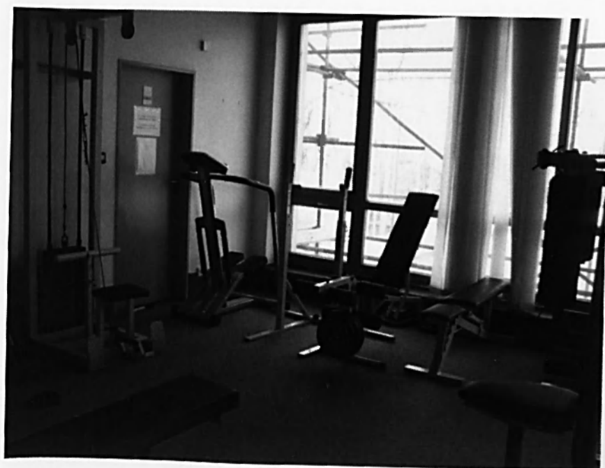
Posilovna v Plzni