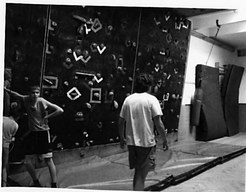
Stěna v Budějovicích