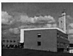
Pohled na kostel Panny Marie- Jižní Svahy a ostatní budovy. 109

Salesiáni působí ve Zlíně od roku 1990, kdy zde začali budovat nové salesiánské centrum na sídlišti Jižní Svahy. Středisko je hojně navštěvováno, což souvisí i s „tradičně nábožensky založeným“ zlínským krajem. Je to středisko, které má velkou podporu mezi lidmi v okolí. Jednou z výhod, kterou vnímají salesiáni, je propojení střediska s farností a příležitost k formaci velkého množství animátorů z řad zájemců, které tvoří především věřící mládež z okolí. Salesiánské středisko nabízí k trávení volného času nové a velmi dobře vybavené prostory. Hlavním místem setkávání je velká společenská místnost s nealkobarem, kde je možnost k posezení, kulečnick atd. Dále je zde k dispozici velký sportovní sál a hřiště s umělým povrchem, cyklodráhou a fitness stezkou. Je zde tradičně nabízena i řada kroužků.