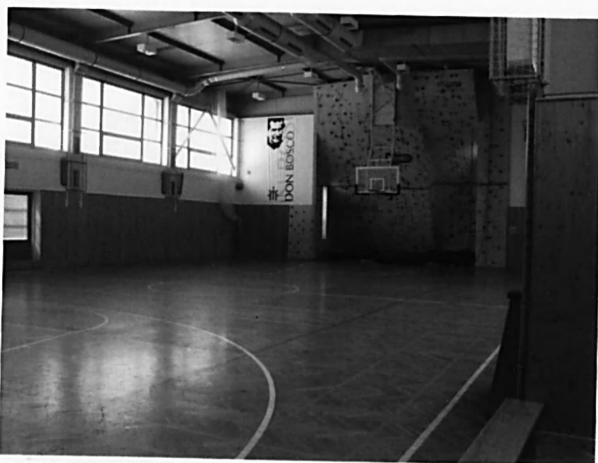
SaSM Brno- Líšeň