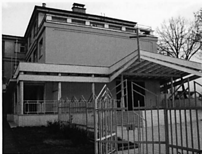
Vchod do kaple a do areálu střediska.

V Pardubicích začali salesiáni působit v roce 1939, kdy se zde začal stavět salesiánský chlapecký domov. Činnost salesiánů se zde mohla plně rozvinout bohužel pouze v období 1945-1950. V roce 1991 se salesiáni vrátili do Pardubic, mohli začít užívat část salesiánského domu a zahájit svou činnost se zdejší mládeží. Celý dům byl salesiánům navrácen až v roce 1996. Oficiálně bylo Salesiánské středisko mládeže otevřeno v roce 1995.