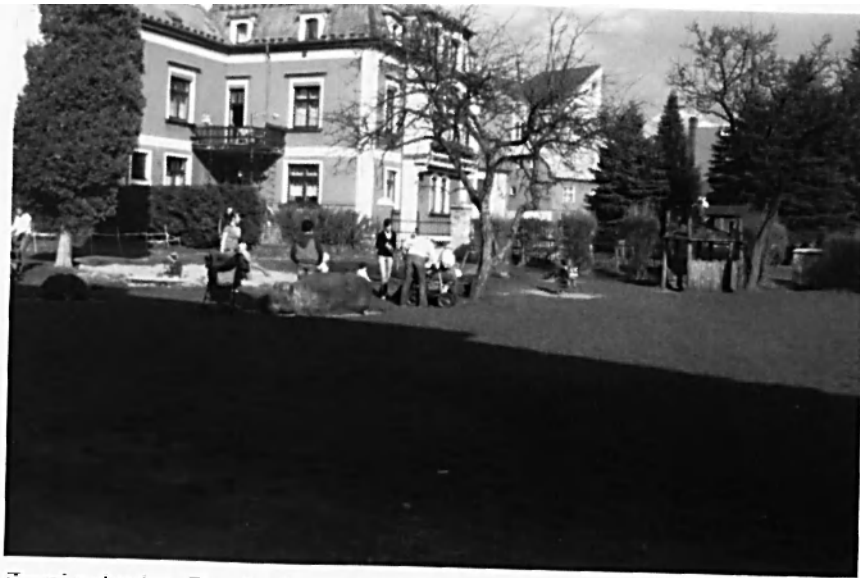
Farní zahrada- Rumburk