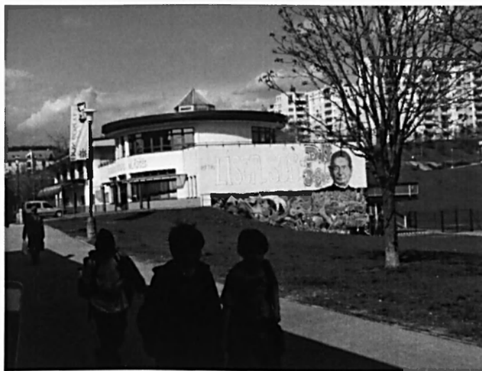
Pohled na středisko a sprejerskou stěnu.

Heslem druhého salesiánského střediska v Brně je: „Mladí pro mladé“. 93 Velká část aktivit, které středisko nabízí, je zajišťována mladými dobrovolníky, kteří často pocházejí z řad dřívějších klientů. Středisko nabízí volnočasové programy pro děti a mládež všech věkových kategorií.