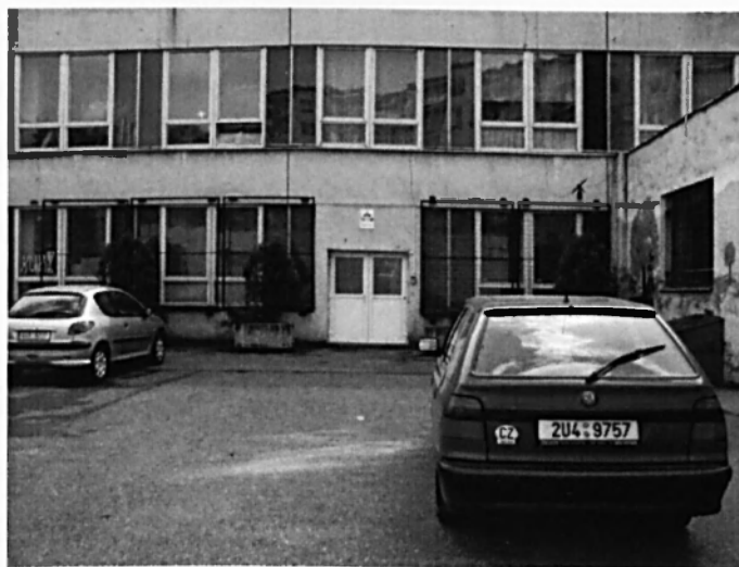
Vchod do střediska.

Ústecký kraj je oblastí Čech, kde podle statistických šetření žije nejvyšší podíl osob bez náboženského vyznání. To se významně odráží i na vztahu občan-církev v celé této oblasti. Tento specifický jev je důsledek téměř úplné výměny obyvatelstva kraje, ke kterému došlo v souvislosti s odsunem původních německých starousedlíků. Na mapě jednotlivých krajů naší republiky je možné označit Ústecko za „poušť na mapě náboženství“. Této skutečnosti se museli přizpůsobit i salesiáni, kteří zde působili a působí. 72