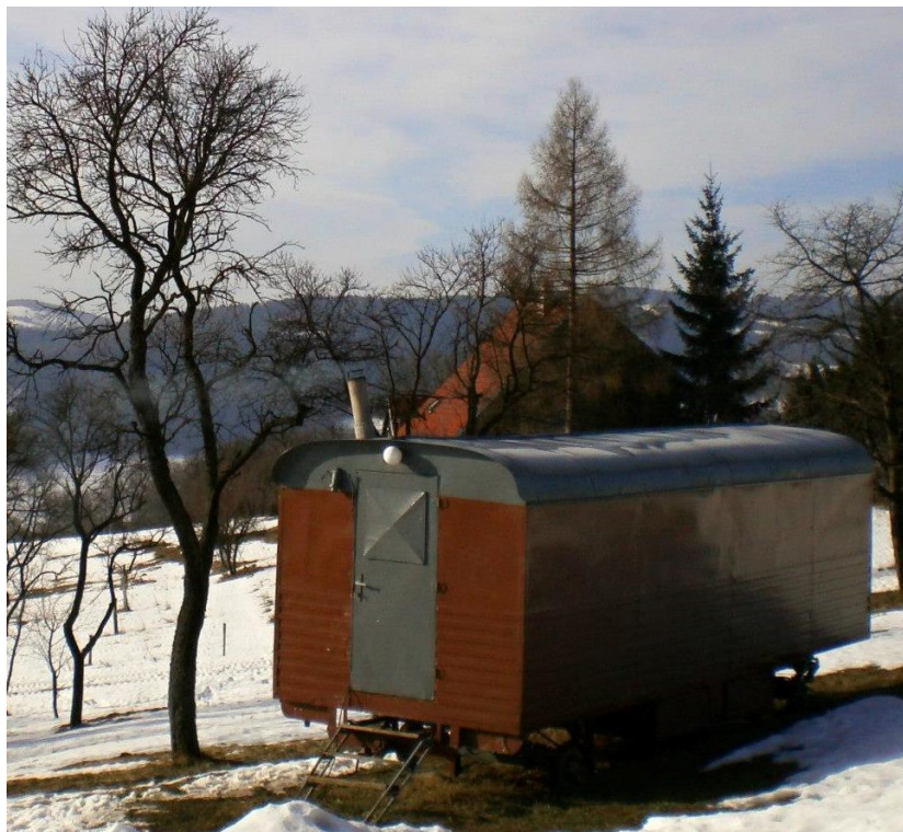
Obr. č. 3 – Maringotka bez přístavby