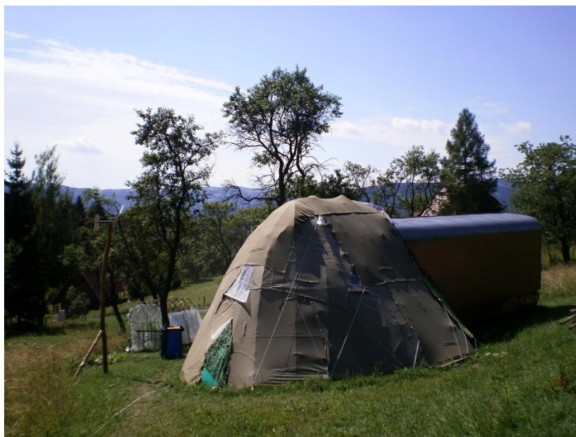
Obr. č. 4 – Maringotka s přístavbou (o několik měsíců později)