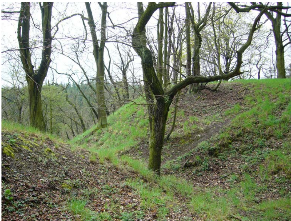
Obr. 12, Hrad Angerbach u Kožlan, zbytky příkopu.