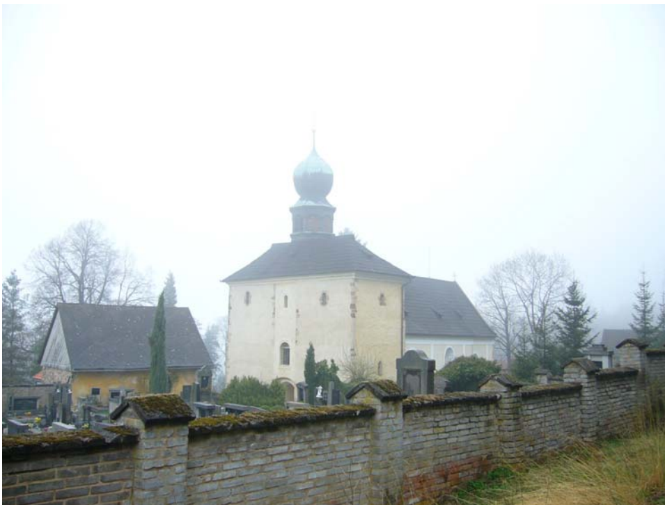
Obr. 15, Kaple na Velízu.