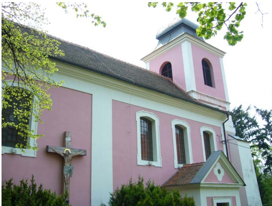
Obr. 16, Kostel sv. Martina ve Zbečň.