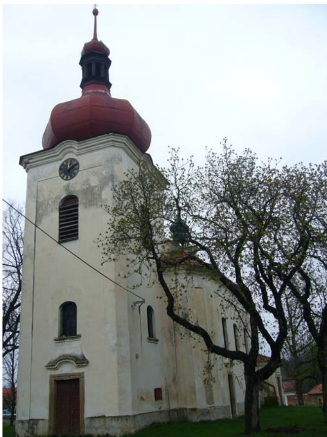
Obr. 17, Kostel Nanebevzetí Panny Marie ve Zvíkovci.