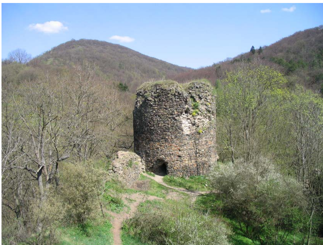
Obr. 11, Bergfitt hradu Týřova.