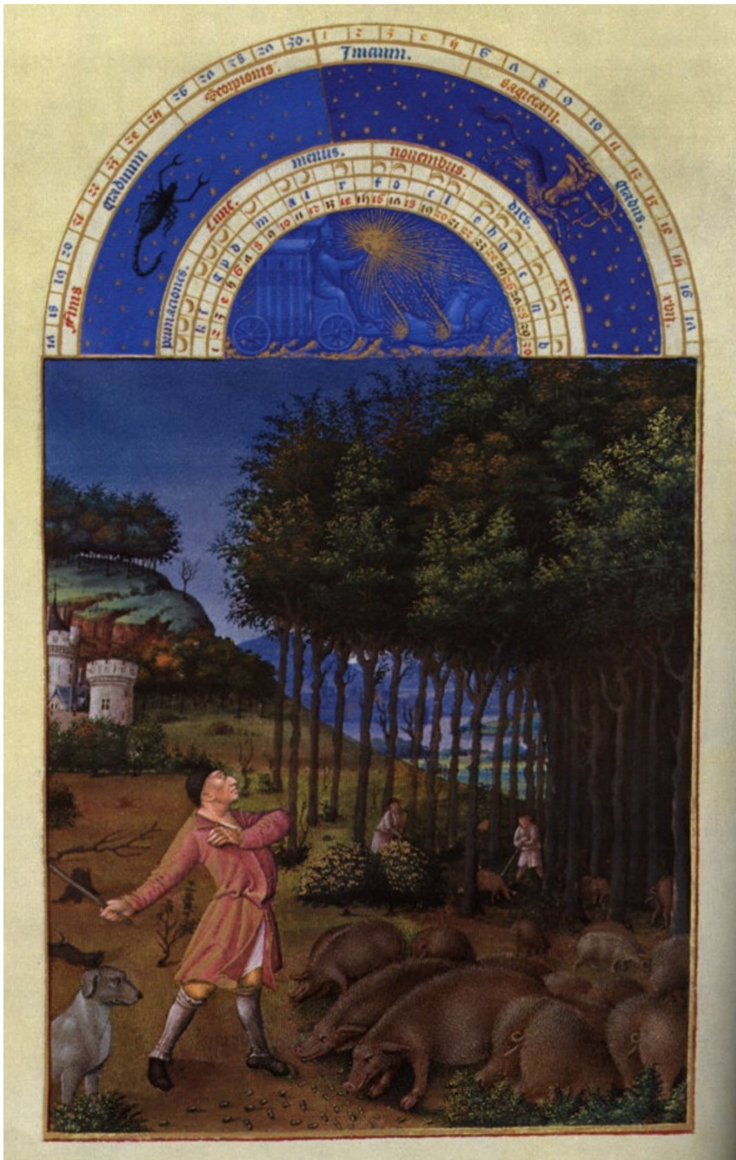
Obr. 9, Prasata pasoucí se v lese ( Přebohaté hodinky vévody z Berry ).