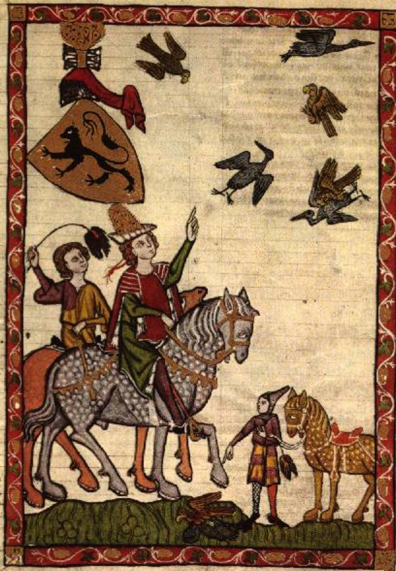
Obr. 4, Sokoli lovící kachny ( Codex Manesse ).