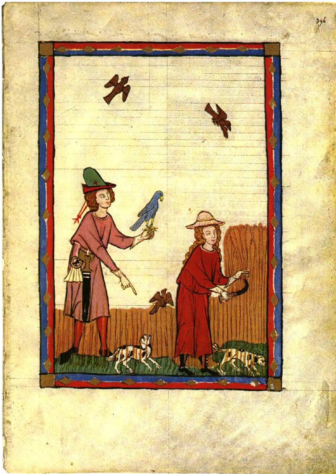
Obr. 3, Lov se sokolem v poli z Codexu Manesse .