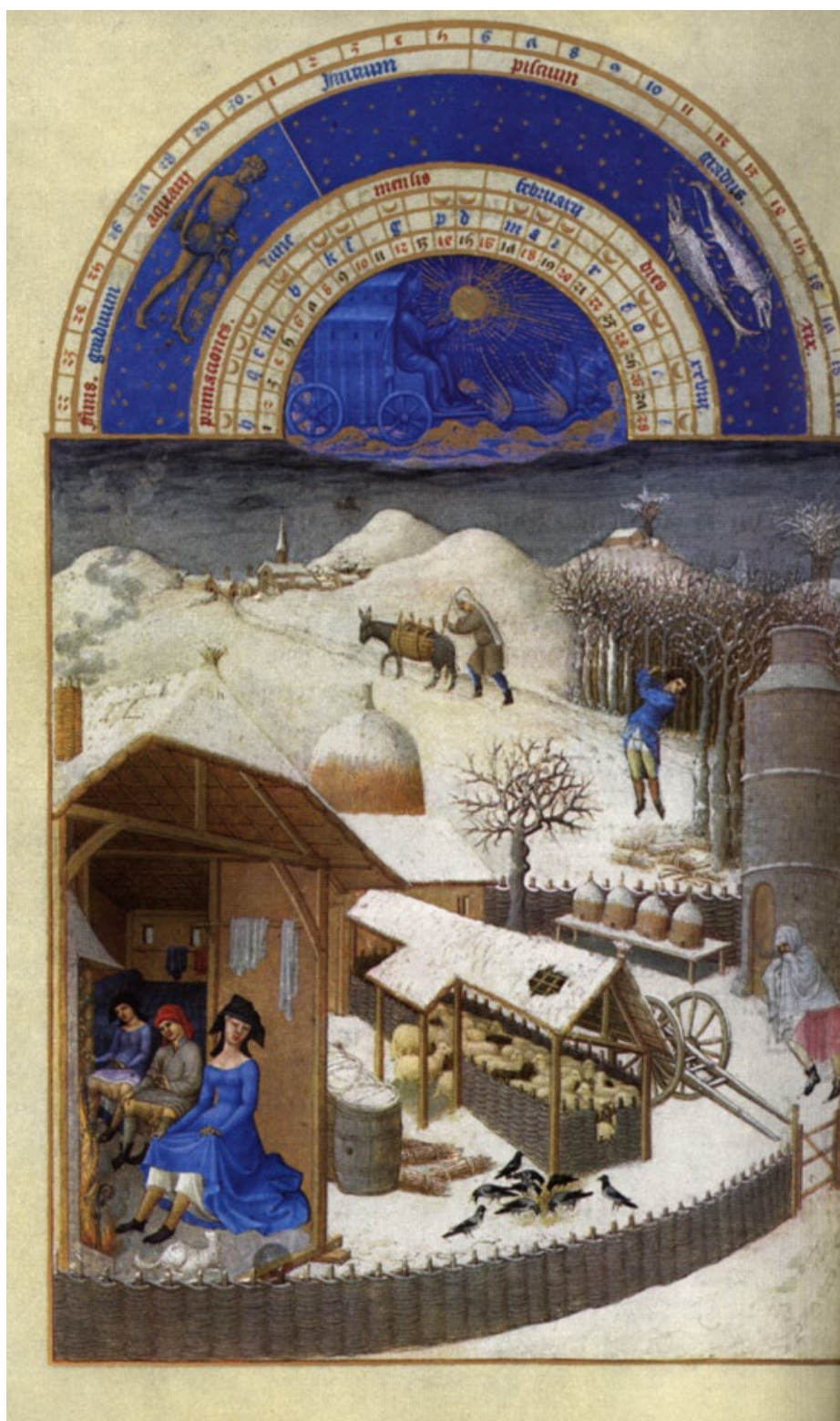
Obr. 8, Rozličné využití dřeva ( Přebohaté hodinky vévody z Berry ).