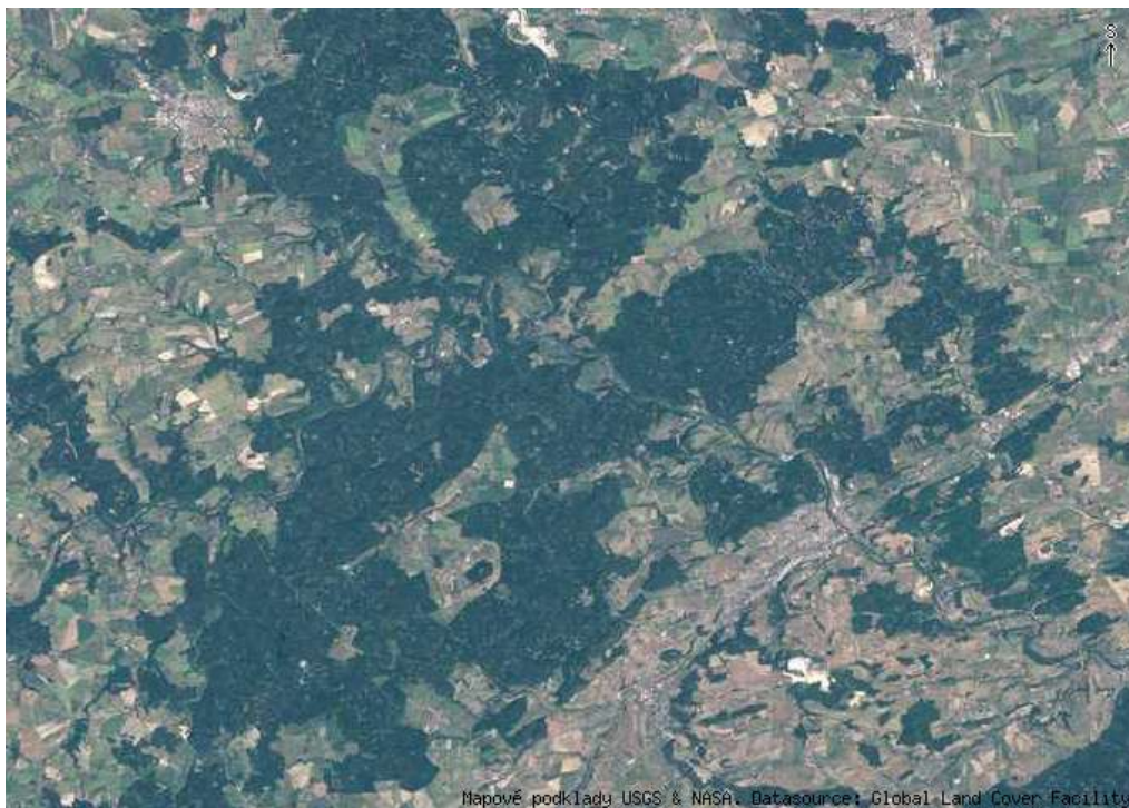
Obr. 10, Křivoklátský lovecký hvozď na družicovém snímku. Dodnes je patrná vysoká zalesněnost krajiny.