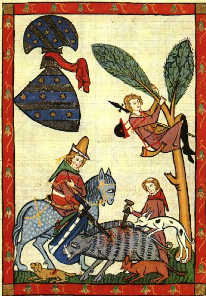
Obr. 7, Kanec ulovený s pomocí mečů ( Codex Manesse ).