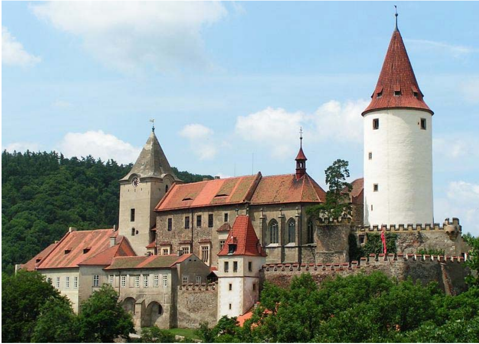
Obr. 14, Hrad Křivoklát.