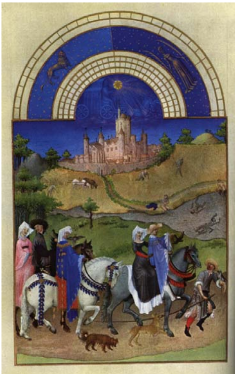
Obr. 2, Skupina lovců se vydává na lov se sokoly ( Přebohaté hodinky vévody z Berry ).