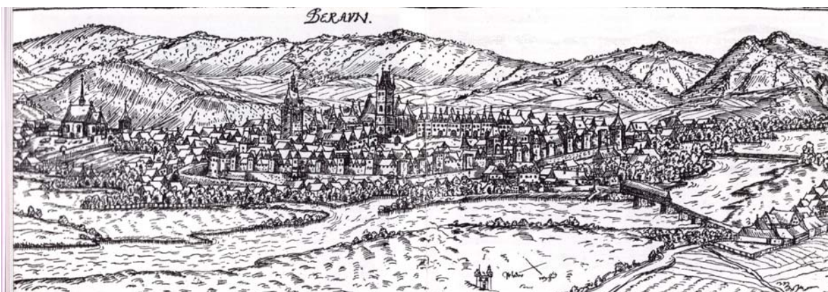
Obr. 19, Beroun na rytině od Jana z Willenberga (konec 16. století).