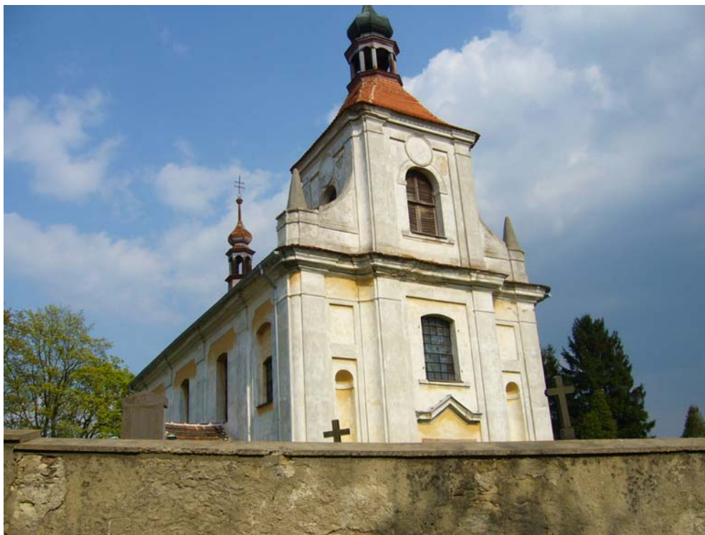
Obr. 20, Kostel v Panoším Újezdě.