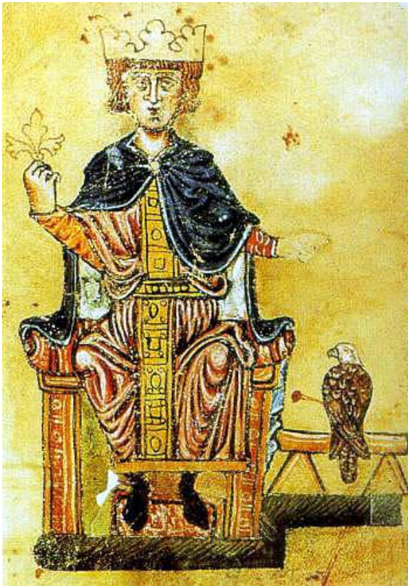
Obr. 1, Fridrich II. s císařskými insigniemi a se sokolem.