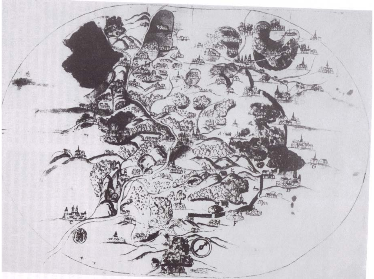
Obr. 23, Mapa křivoklátských lesů z roku 1600 Šimona Podolského z Podolí (převzato z knihy Tomáše Durdíka, Hrady kastelového typu ve 13. století).