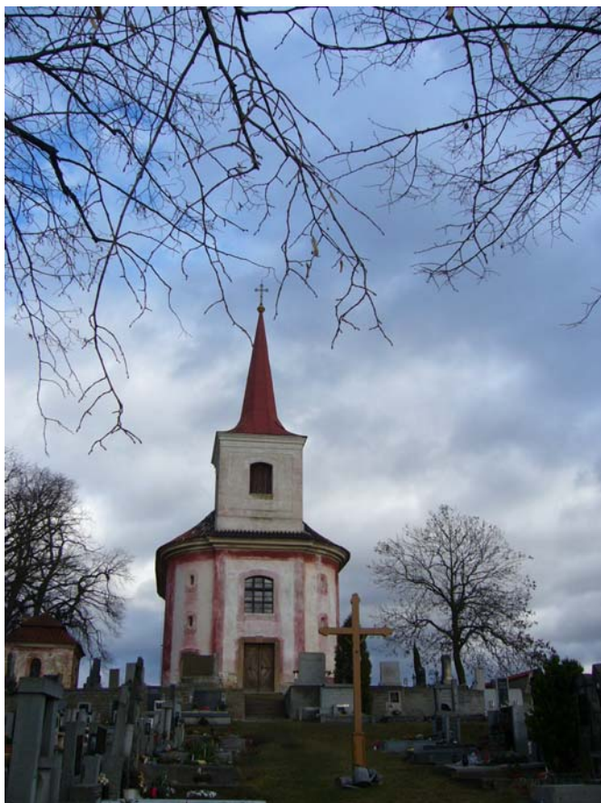
Obr. 21, Kostel sv. Gottharda u Krupé.