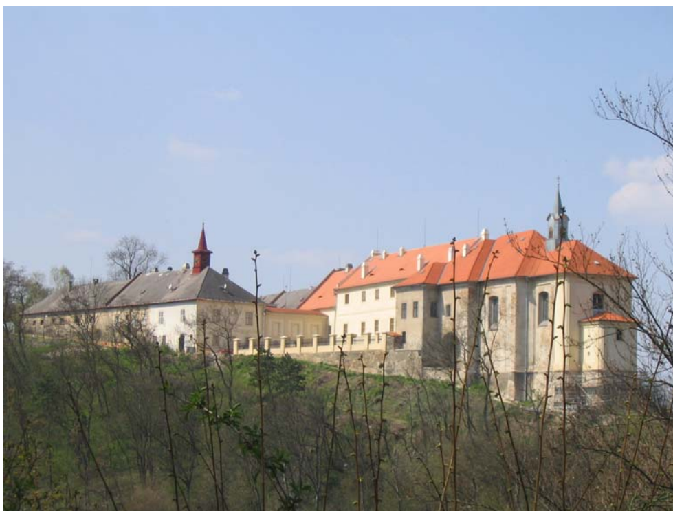
Obr. 13, Hrad Nižbor, přestavěný na barokní zámek.