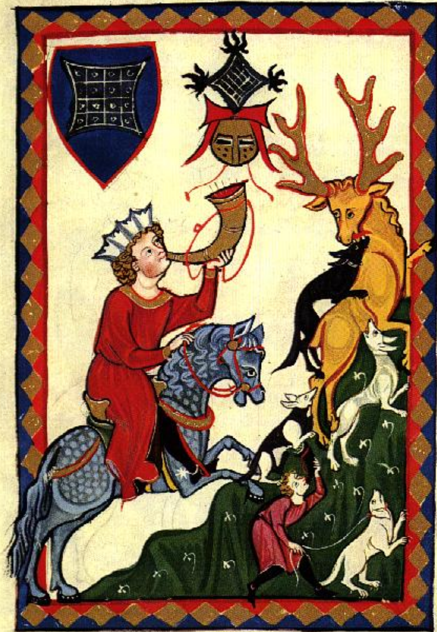
Obr. 5, Štvanice jelena ( Codex Manesse ).