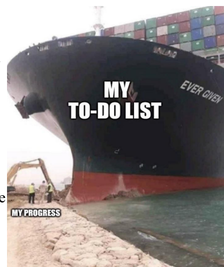
Obrázek 1: Příklad memu o lodi zaseknuté v Suez

Čtvrtou zprávu lze charakterizovat jako novinku z populární kultury, přesněji z prostředí platformy pro sdílení videí TikTok. Druhý nejsledovanější účet na této platformě patří mladé tanečnici a zpěvačce Addisson Rae, která v pátek 26. 3. debutovala v historicky prvním živém, pěveckém vystoupení v americké večerní talkshow Jimmyho Fallona. Zpráva má aktuální charakter z toho důvodu, že záznam vystoupení byl zveřejněn na platformě YouTube v neděli večer (28. 3) a spadá tak do agendy pondělního vysílání relace Co se řeší.