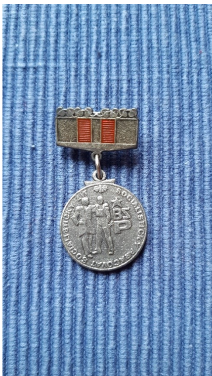
Obr. 2: Člen BSP.