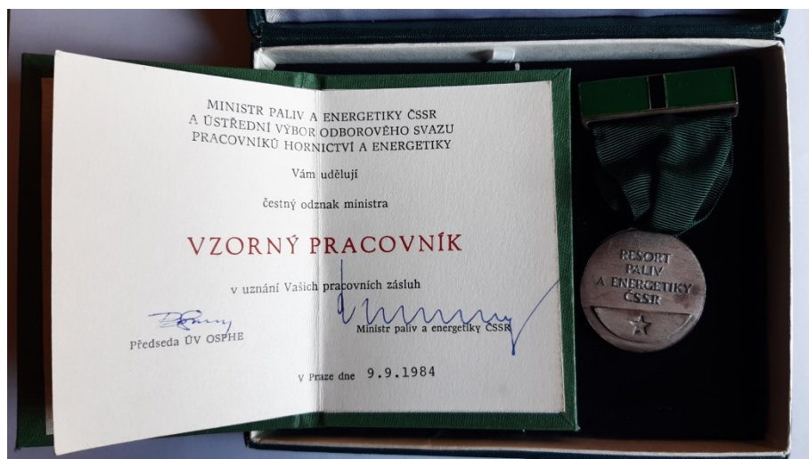
Obr. 6: Vzorný pracovník, ministerské vyznamenání.