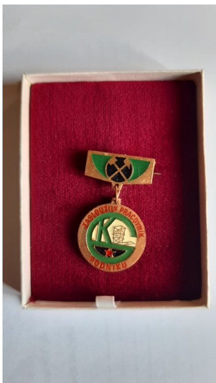
Obr. 5: Zasloužilý pracovník podniku.