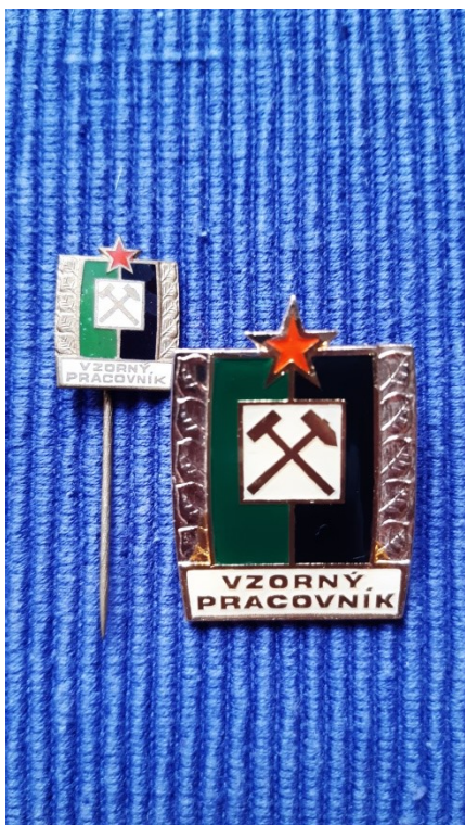
Obr. 4: Vzorný pracovník.