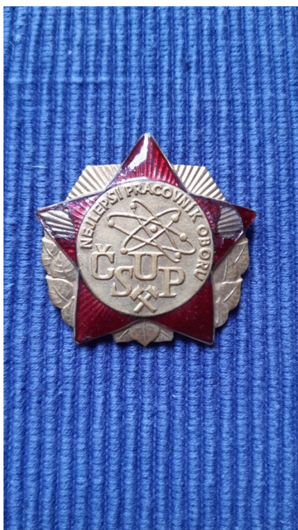
Obr. 3: Nejlepší pracovník oboru, podnikové vyznamenání.