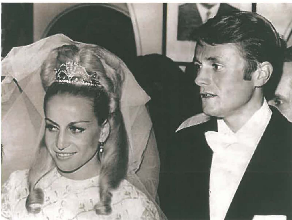
Svatba na Zócaló

v katedrále na hlavním mexickém náměstí Zócaló. Měla neskutečnou kulisu padesátitisícového davu (přišli zcela obyčejní Mexičané, kteří na tuto událost rádi vzpomínají a dodnes při vyslovení názvu Československo se jim jako první vybaví jméno naší olympijské vítězky, pozn. aut.) který dával hlasitě najevo sympatie se sportovním párem. Navíc tak demonstroval i náklonnost k okupované zemi.