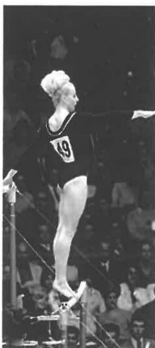
Ztělesnění klidu a elegance

dva dny později. Se ziskem čtyř prvenství (víceboj jednotlivkyň, přeskok, bradla, prostná) a dvou stříbrných pozic (víceboj družstev, kladina) se stala nejúspěšnější účastnicí mexických olympijských her a nejúspěšnější československou olympioničkou všech dob. Mexické hry se staly luxusní tečkou za její úspěšnou kariérou. Radost tak československé výpravě pokazily jen Sovětky ve víceboji družstev, kde zabojovaly a zlatou medaili vyfoukly před nosem československému výběru, který jim pomohl několika drobnými zaváháními.