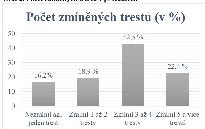
Graf 2. Počet zmíněných trestů v procentech

Pro testování první hypotézy využiji rovněž položky, v rámci které měl respondent vypsat co nejvíce druhů trestů, které zná. Schopnost vyjmenovat různé druhy trestů může být dobrým ukazatelem, do jaké míry se respondent v oblasti trestání orientuje.