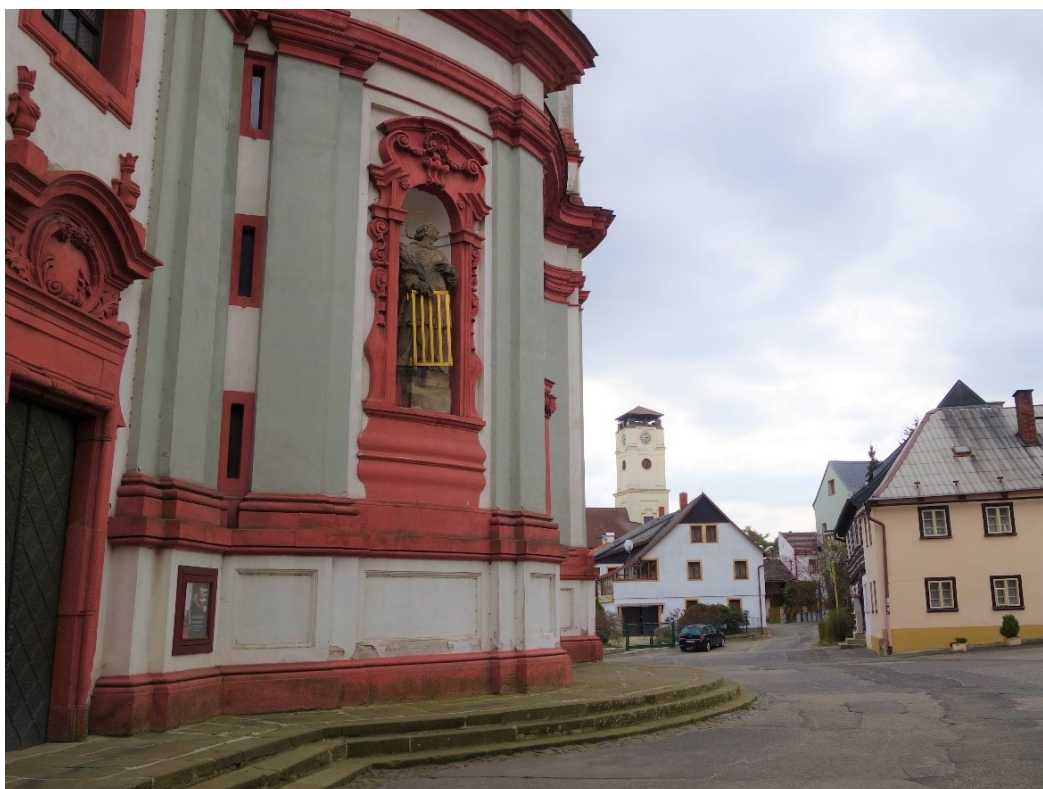
Obr. 2: Detail chrámu sv. Vavřince a sv. Zdislavy, u vstupu socha sv. Vavřince, na obzoru věž bývalého farního kostela Narození Panny Marie, stav z dubna 2021.