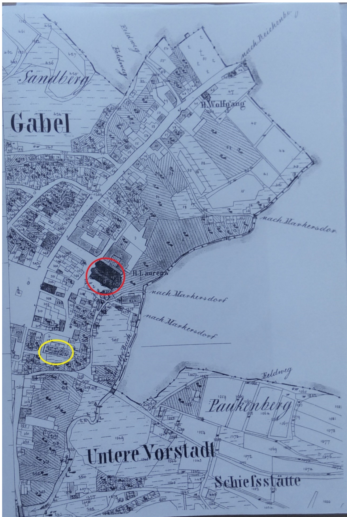
Obr. 8: Katastrální plán Jablonného z roku 1843, převzato ze ZAHRADNÍK, P. – VLČEK, P., Jablonné v Podještědí , [s. 123]. Červeně vyznačen kostel sv. Vavřince, žlutě bývalý farní kostel Narození Panny Marie.