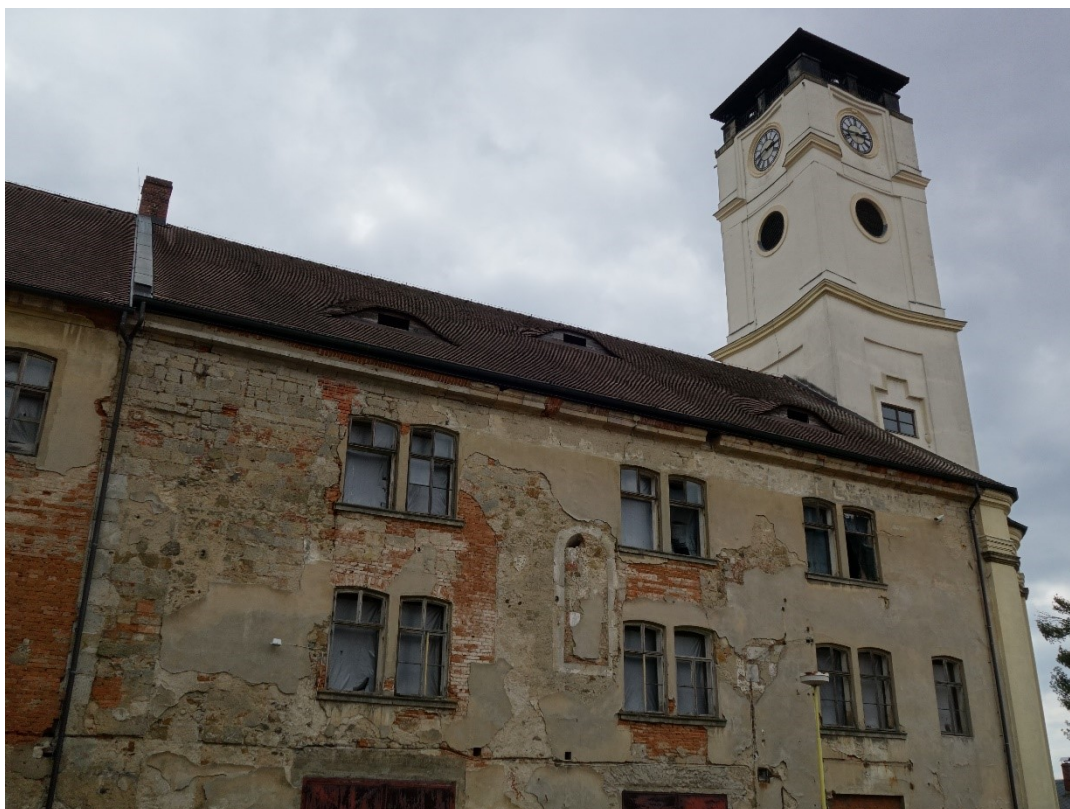
Obr. 3: Bývalý farní kostel Narození Panny Marie, stav z dubna 2021.