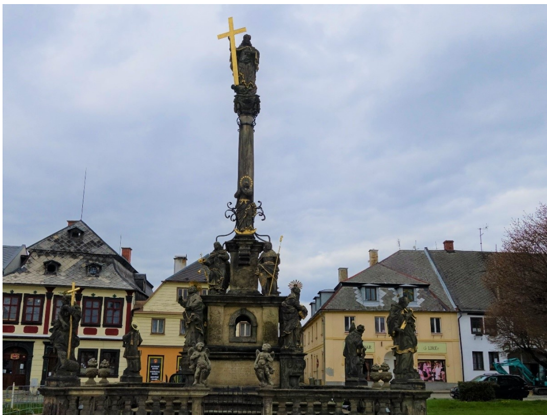
Obr. 4: Sloup se sochou Krista Salvátora a sochami světců na náměstí Míru (dříve Marktplatz ), stav z dubna 2021.