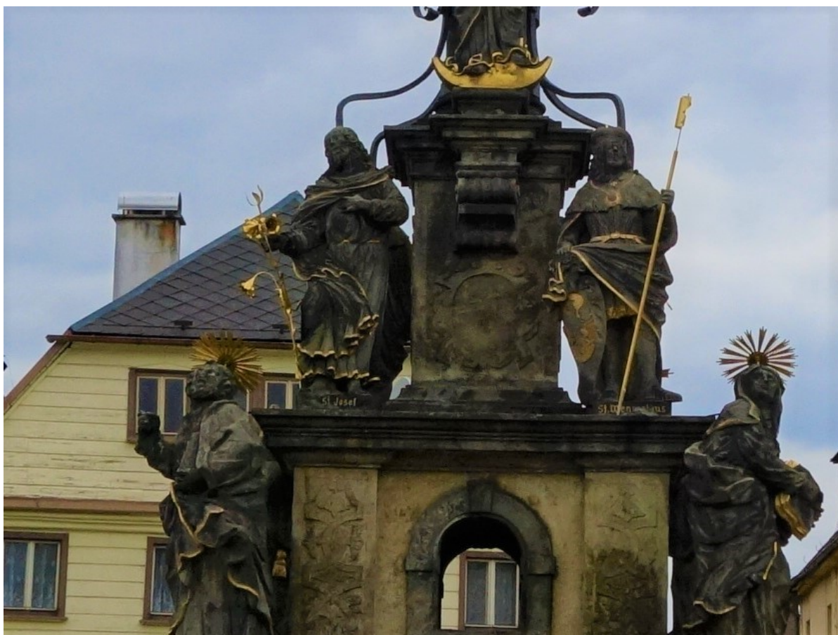
Obr. 5: Detail sloupu na náměstí Míru, vlevo nahoře socha sv. Josefa, stav z dubna 2021.