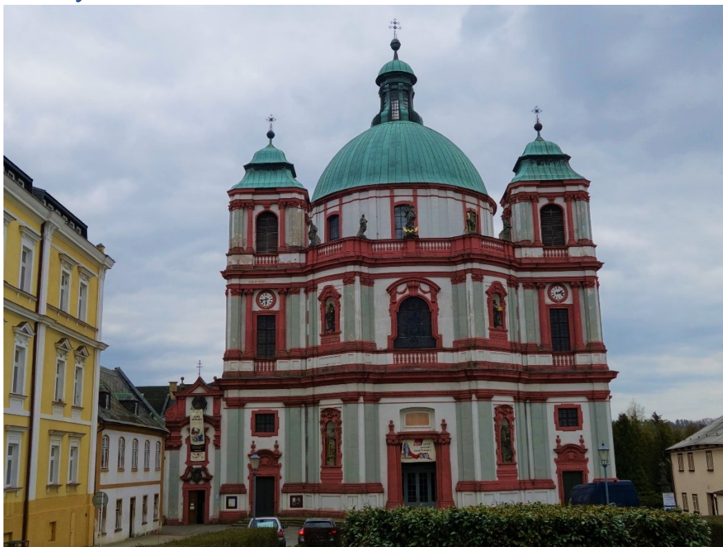
Obr. 1: Chrám sv. Vavřince a sv. Zdislavy (v baroku pouze sv. Vavřince), stav z dubna 2021.