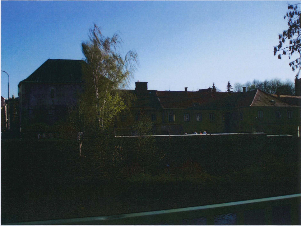
Příloha č. 7