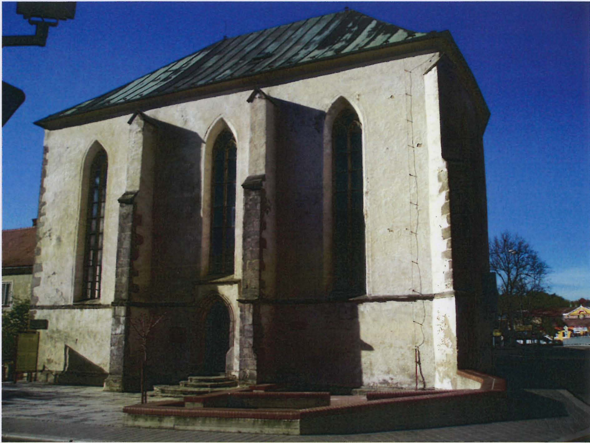
Příloha č. 8