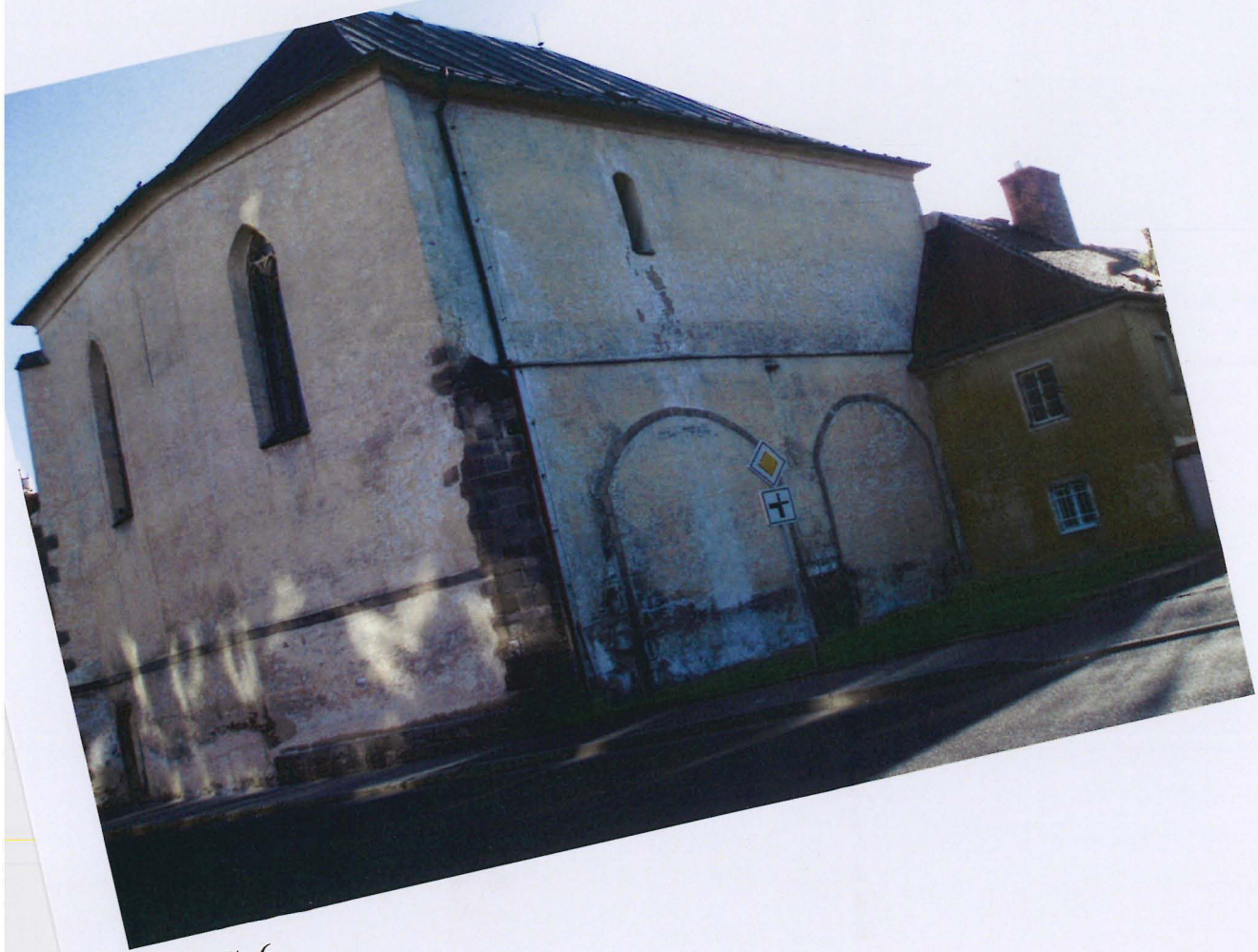
Příloha č. 6