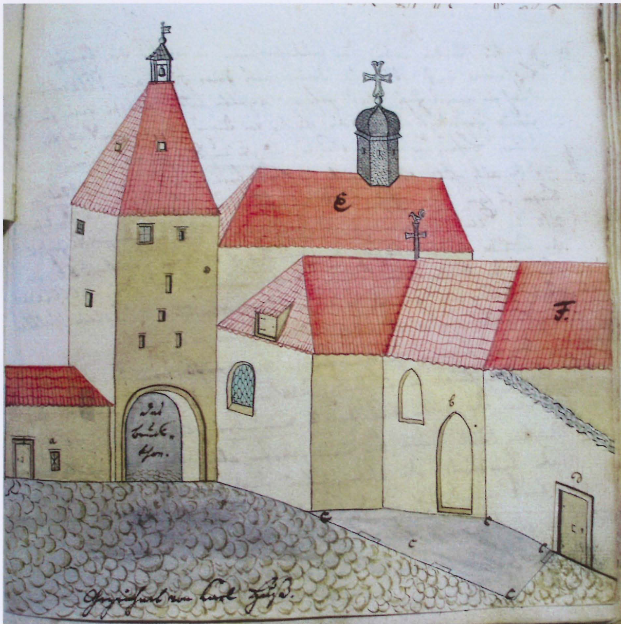
Příloha č. 3