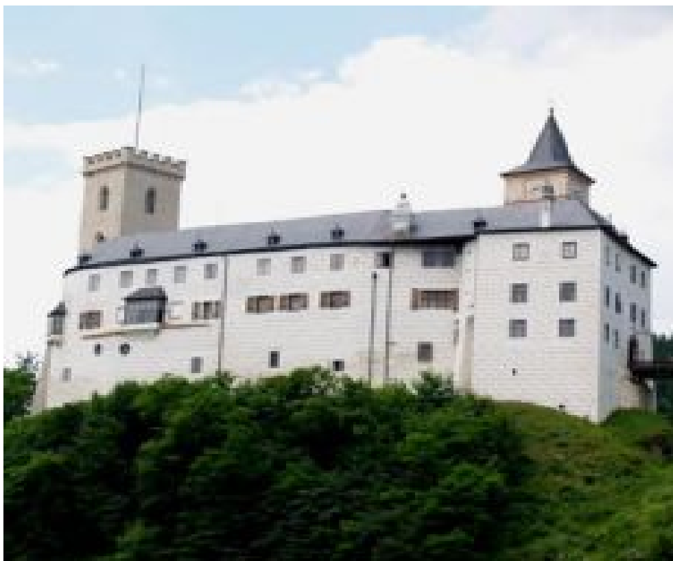
Obr. 13: Rožmberk nad Vltavou - hrad