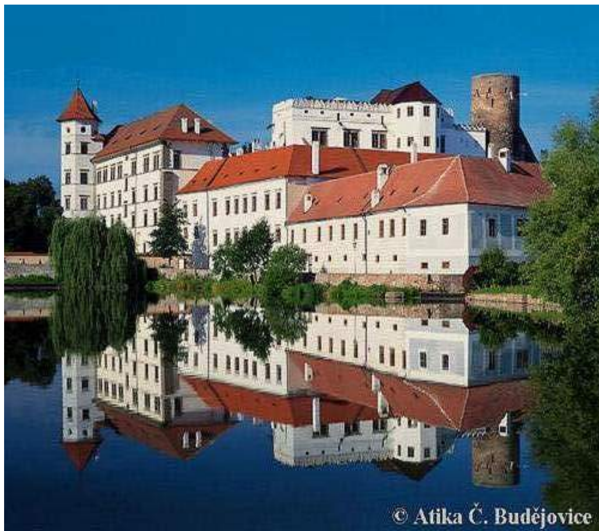
Obr.1: Hrad a zámek v Jindřichově Hradci - celkový pohled