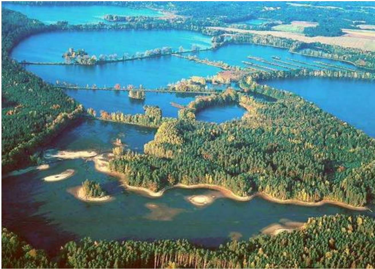
Obr. 21: Třeboňská rybniční soustava