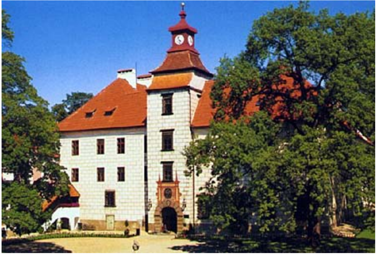
Obr. 19: Třeboň - zámek, sídlo Petra Voka z Rožmberka