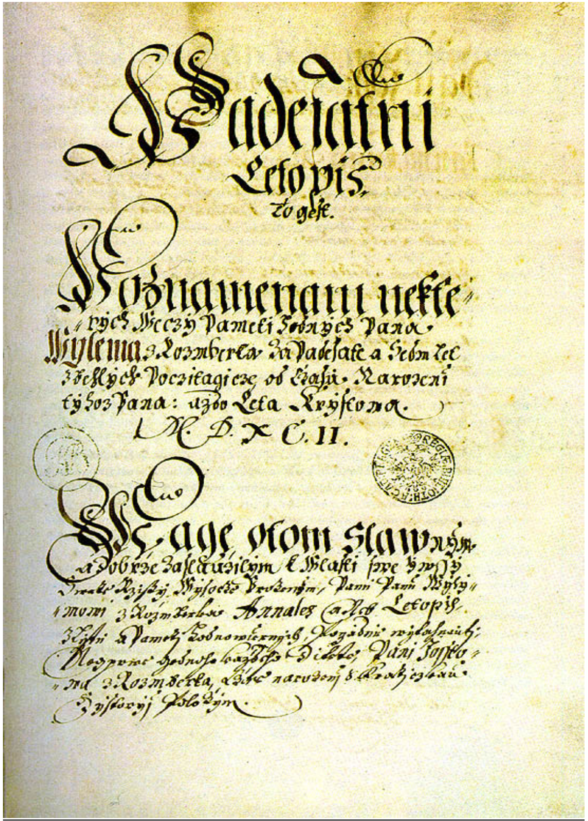
Obr. 20: Titulní list životopisu Viléma z Rožmberka od Václava Březana