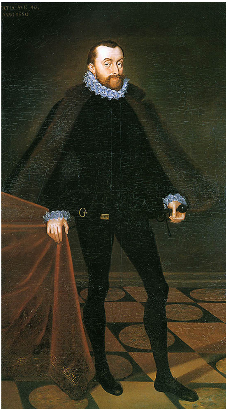
Obr.11: Petr Vok z Rožmberka