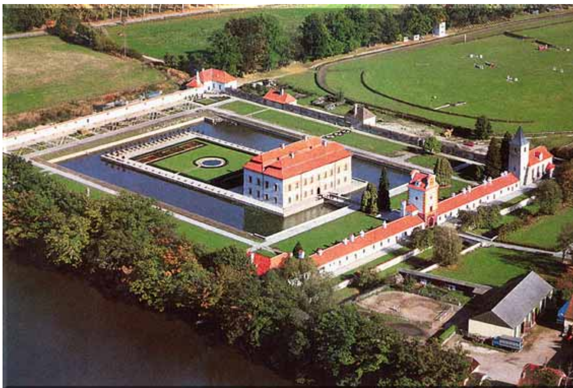
Obr. 15: Zámek Kratochvíle - letní sídlo Viléma z Rožmberka