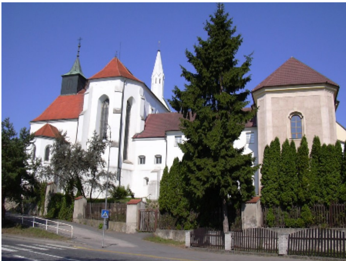
Obr. 8: Jindřichův Hradec - kostel sv. Jana Křtitele s minoritským klášteřem.