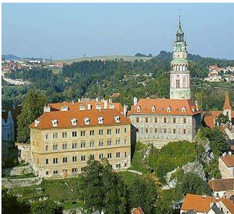
Obr. 14: Český Krumlov - zámek a hrad