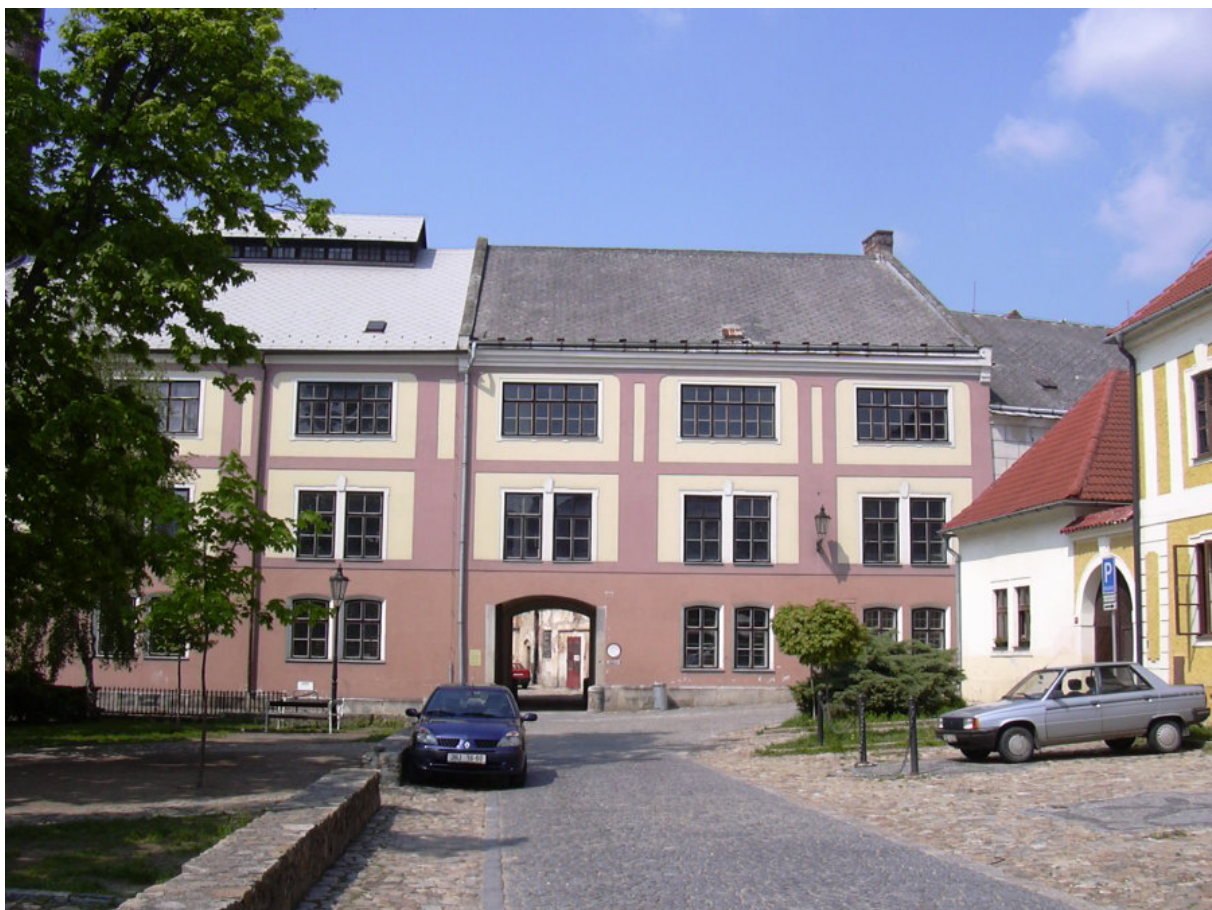
Obr. 2: Budova Jindřichohradeckého pivovaru, který zde vybudovali páni z Hradce