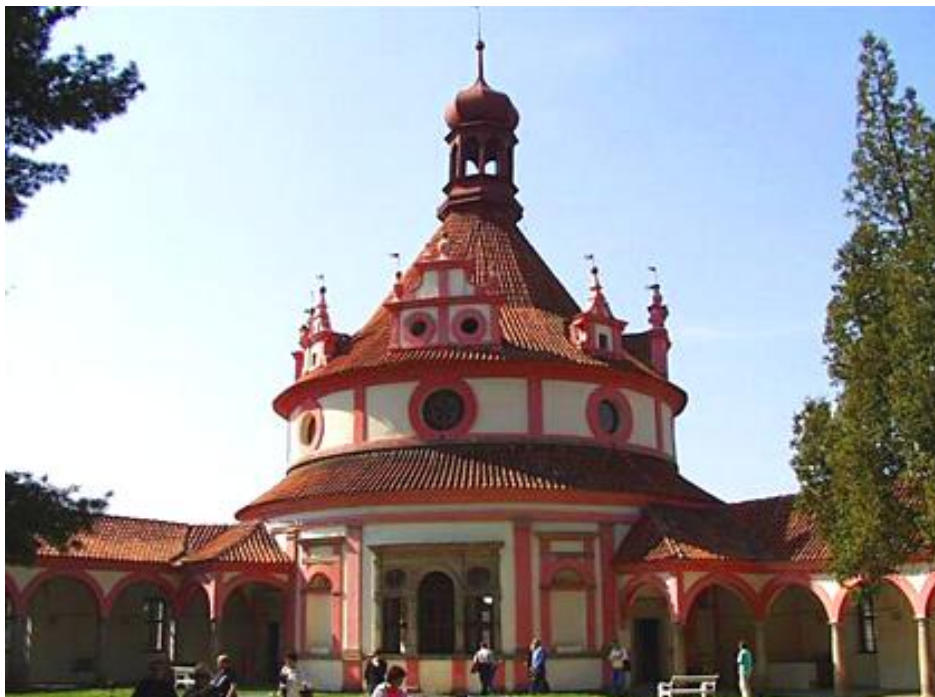
Obr. 4: Zámek v Jindřichově Hradci - rondel