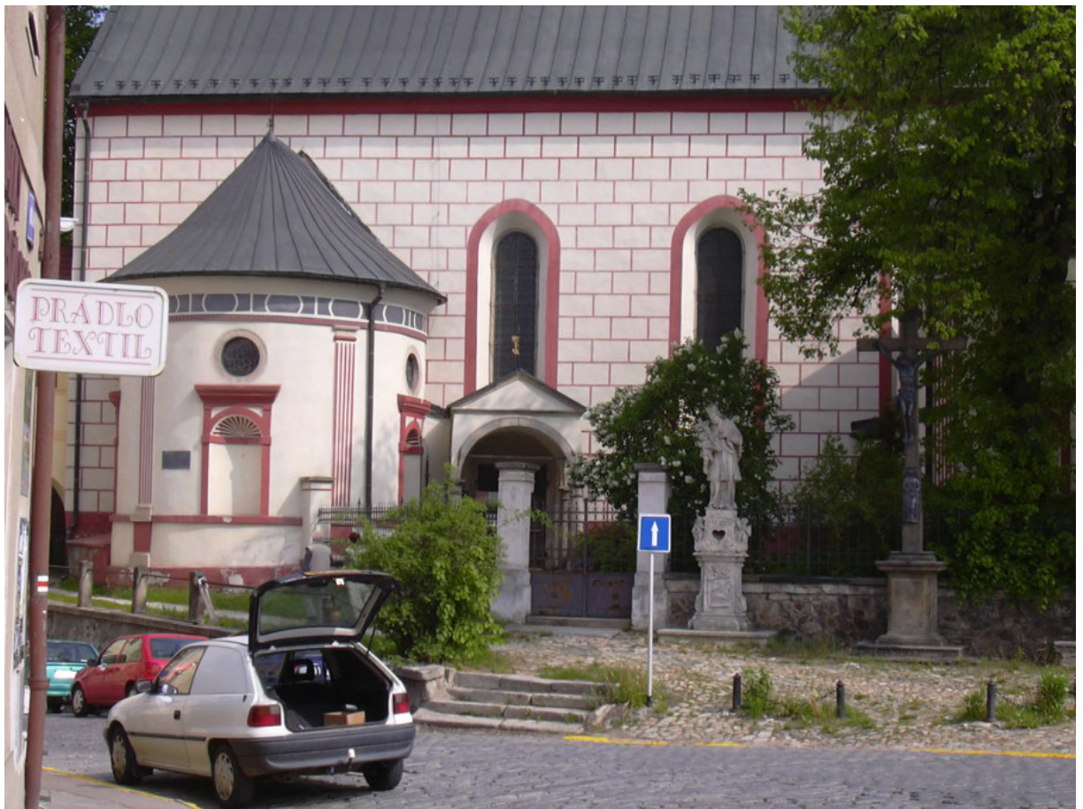
Obr.6: Jindřichův Hradec - renesanční kostel sv. Kateřiny