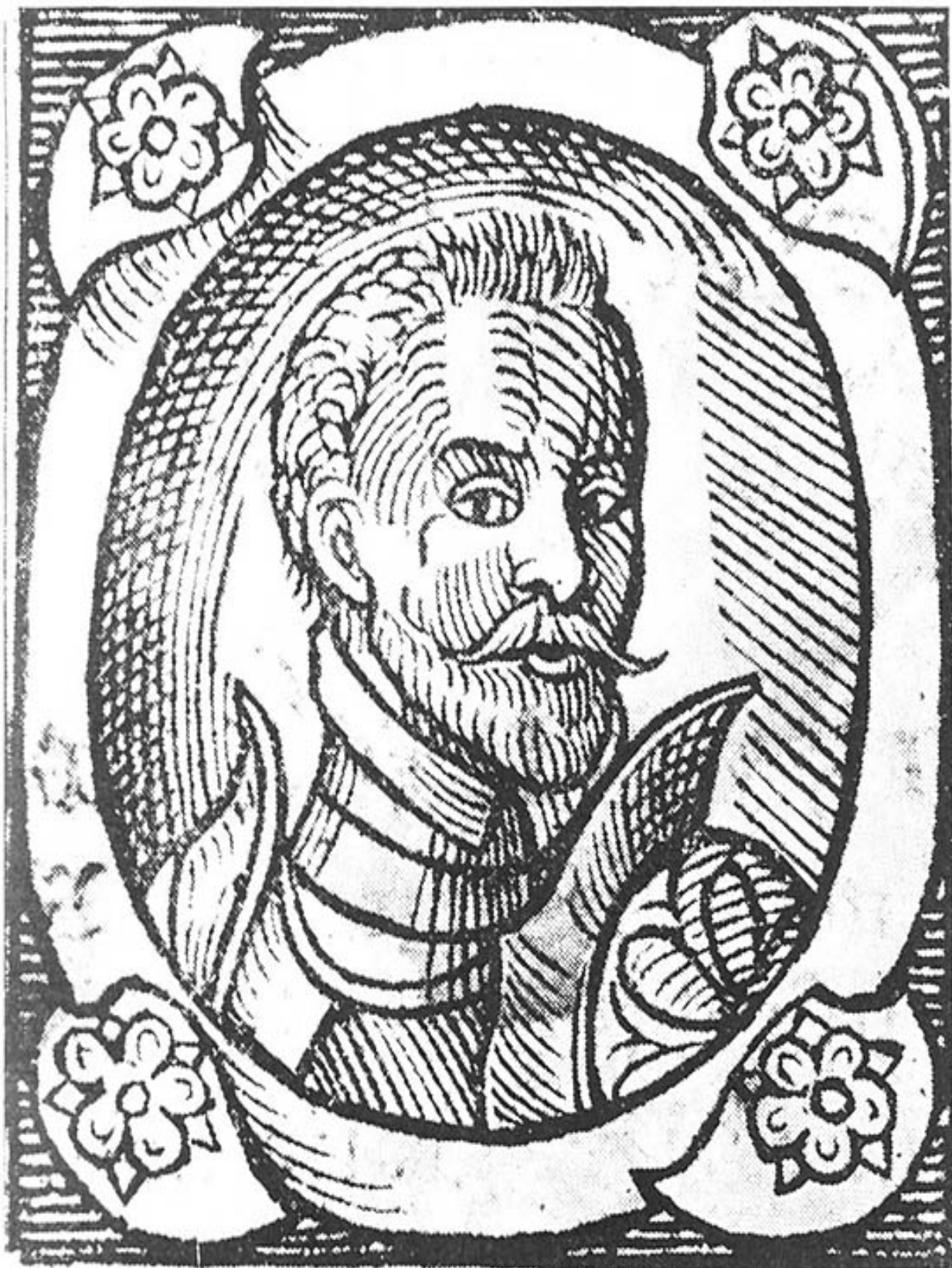
Obr. 10: Oldřich z Rožmberka