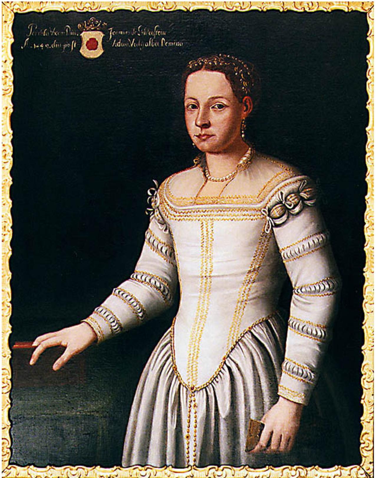
Obr. 9: Perchta z Rožmberka