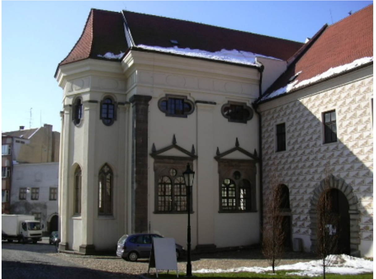
Obr. 7: Jindřichův Hradec - kostel sv. Maří Magdalény při jezuitské koleji