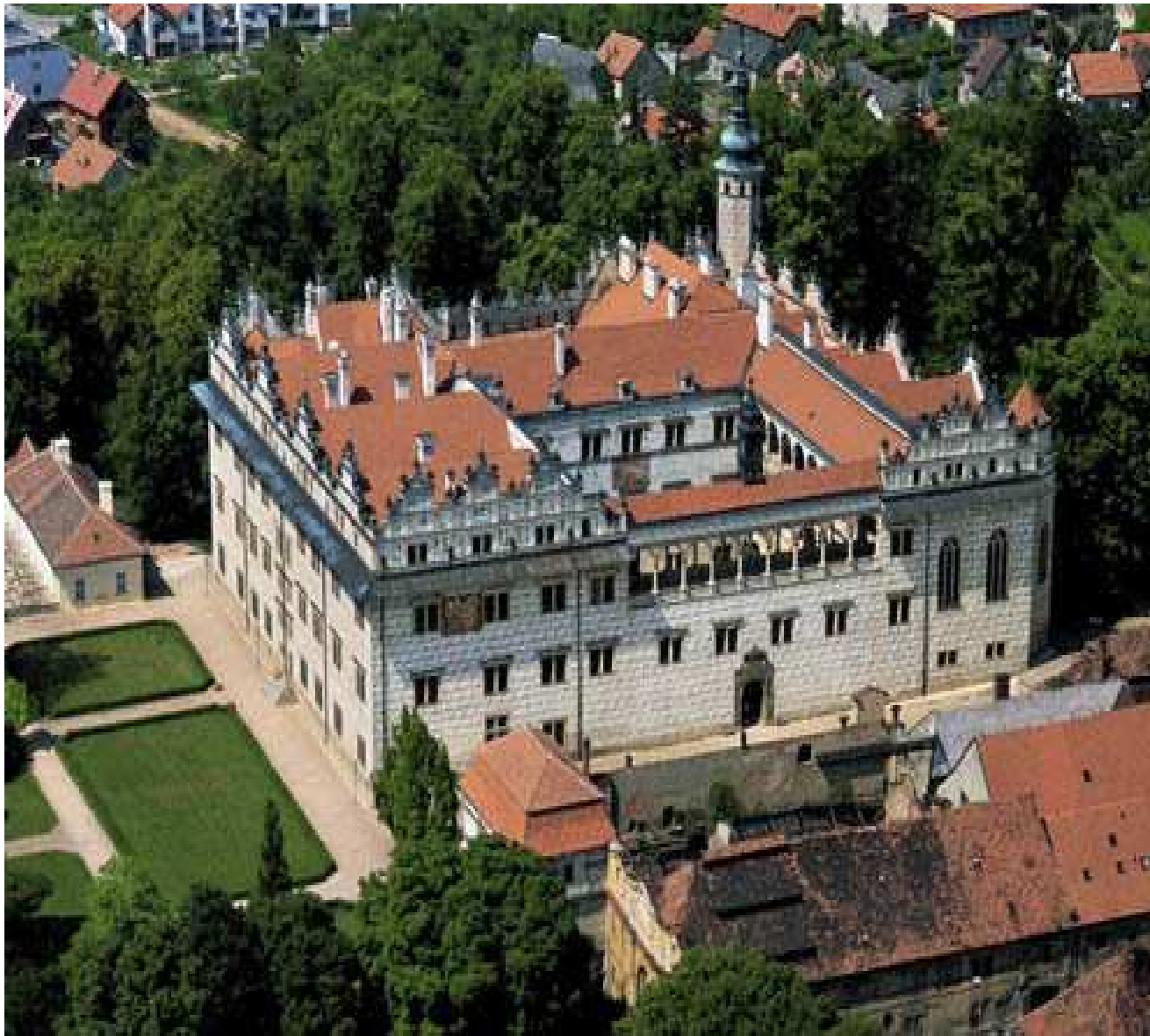
Obr.17: Litomyšl - zámek, sídlo Vratislava z Pernštejna, přítele a posléze i zetě Viléma z Rožmberka