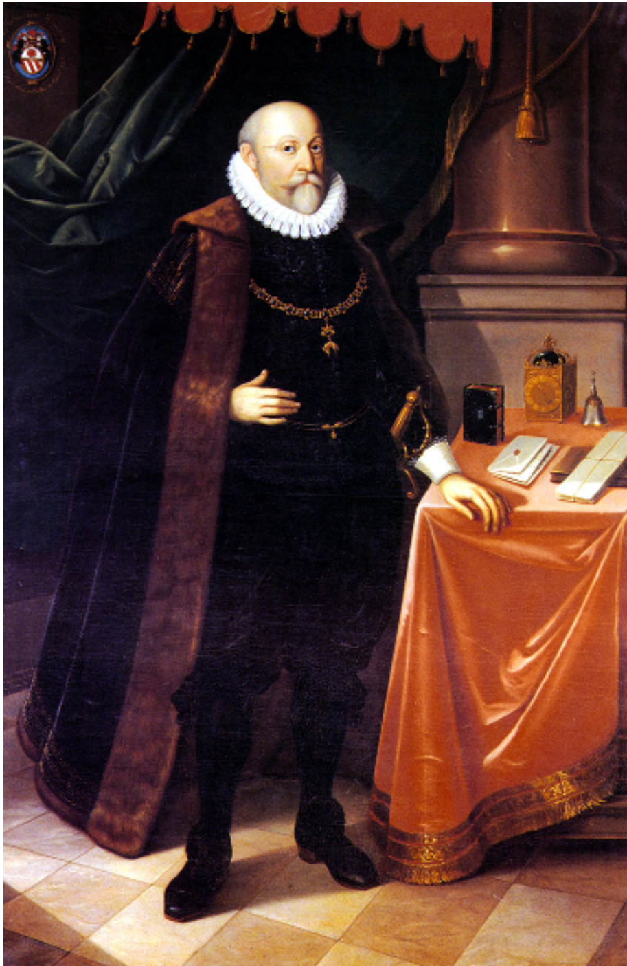
Obr. 12: Vilém z Rožmberka