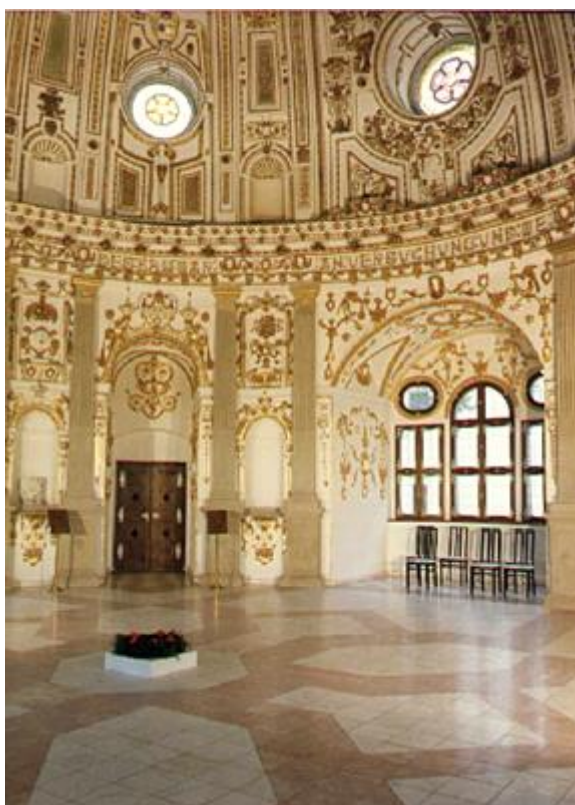
Obr. 5: Zámek v Jindřichově Hradci- rondel, interiér