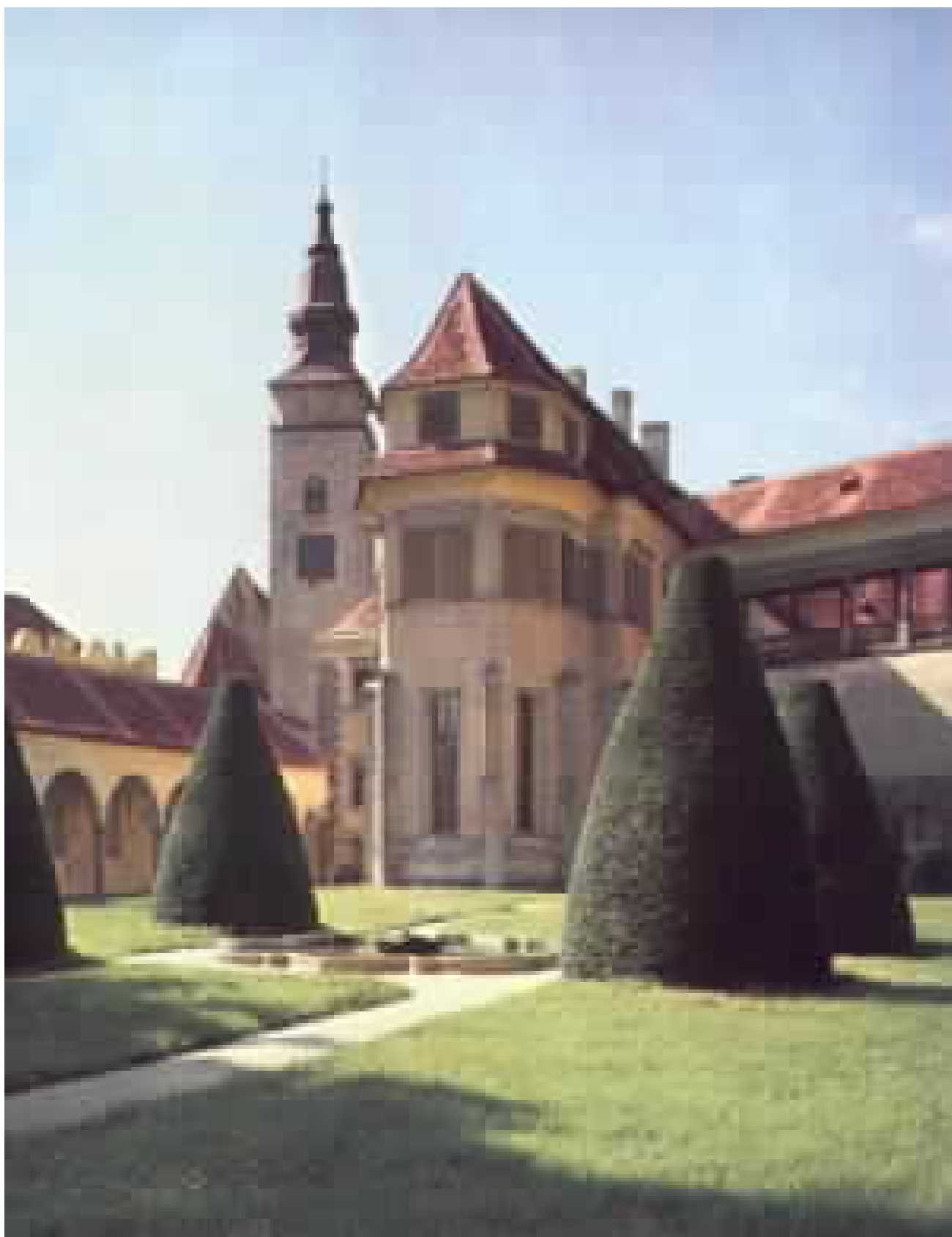
Obr.18: Telč - zámek, sídlo Zachariáše z Hradce