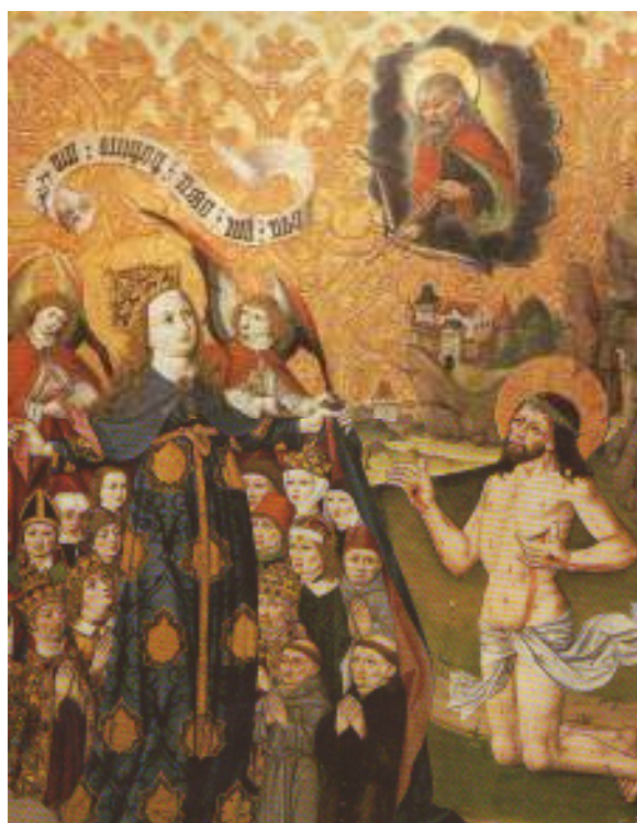
11 Madona Ochránkyně, kolem roku 1480, tempera, zlacení, dřevo (smrk), 131×98,5 cm, Moravská galerie v Brně.