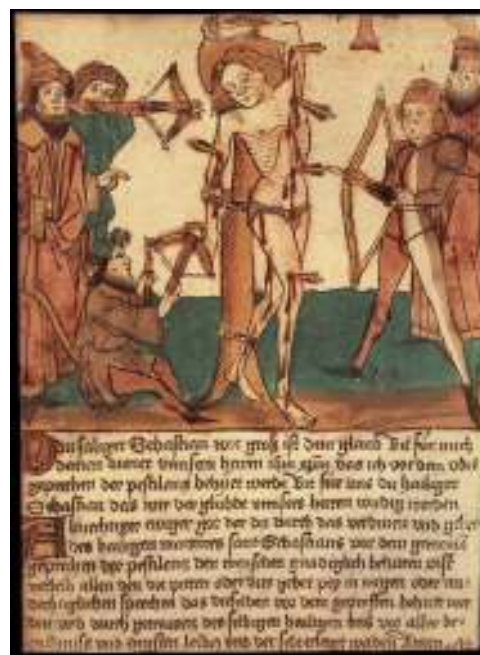
13 Umučení svatého Šebestiána, Hans Paul, kolem 1472.