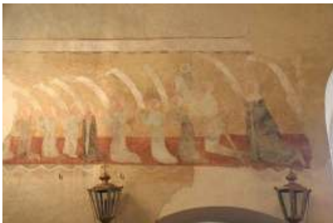
30 Scéna s donátory, druhá polovina 14. století, nástěnná malba v klenbě presbytáře, kostel sv. Mikuláše, Starý Svojanov.