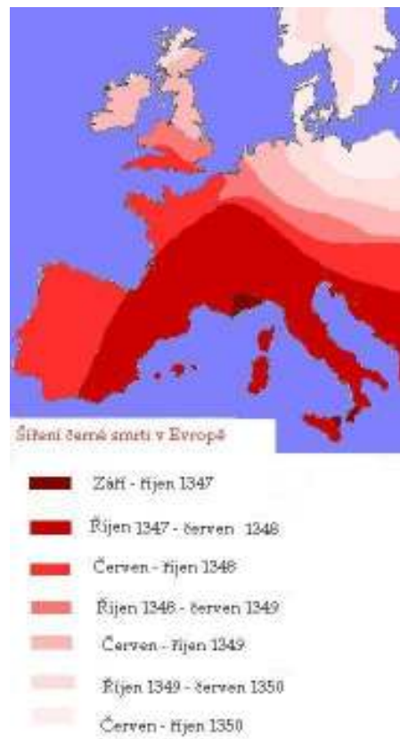
3 Mapa: Šíření černé smrti v Evropě.