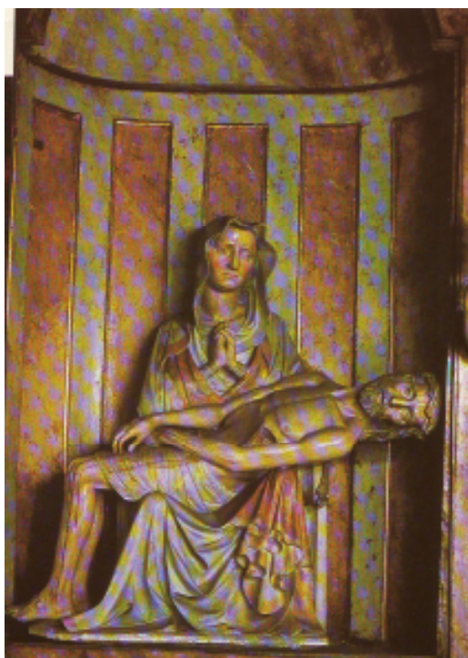
18 Pietà, kolem roku 1385, opuka, 140 cm, původní polychromie, kostel svatého Tomáše, Brno.