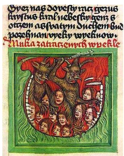
39 Pekelná brána v podobě dračí tlamy, před rokem 1420, tzv. krumlovský sborník, Knihovna Národního muzea v Praze.