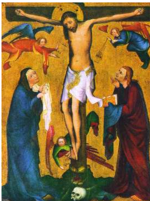
21 Ukřižování vyšebrodské, kolem roku 1390, tempera na smrkové desce, 129×98, Národní galerie v Praze.