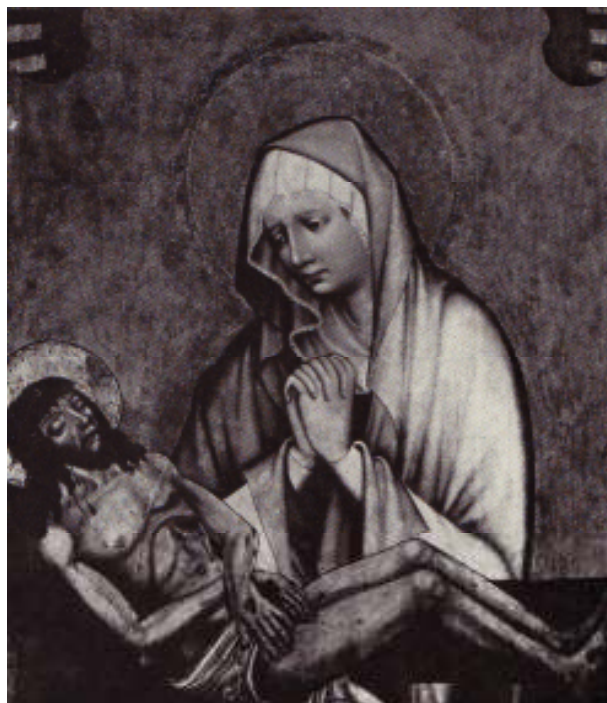
16 Panna Maria bolestná, před rokem 1380, lipové dřevo, 89×77,9; Církvice u Kutné Hory.