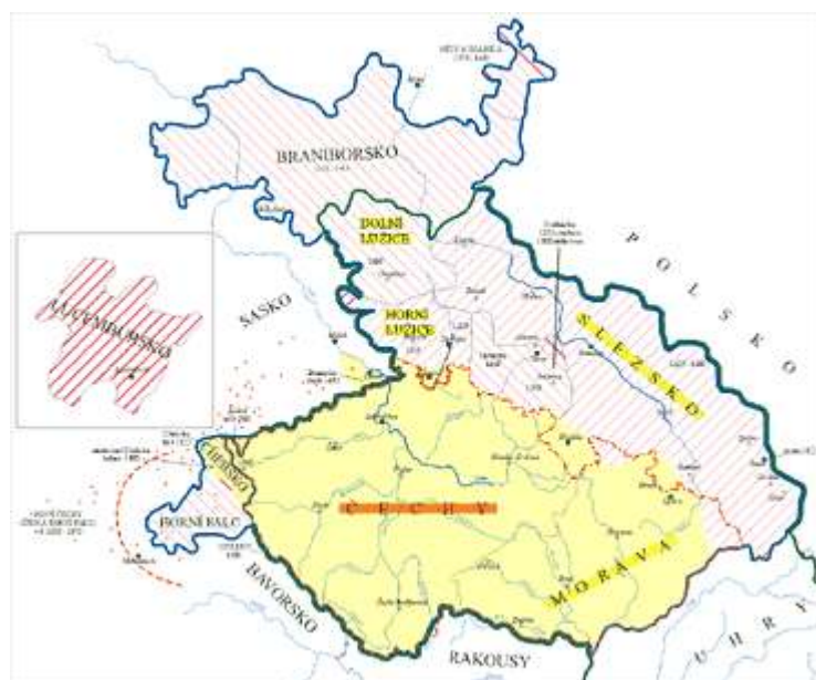
1 Mapa: České země za vlády Lucemburků.