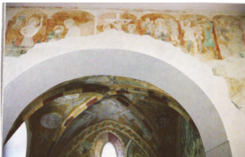
31 Pašijový cyklus na Vítězném oblouku, druhá polovina 14. století, nástěnná malba, kostel sv. Mikuláše, Starý Svojanov.