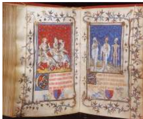
38 Legenda o setkání tří živých a tří mrtvých, 1345, iluminace, Bonn, Lucembursko.