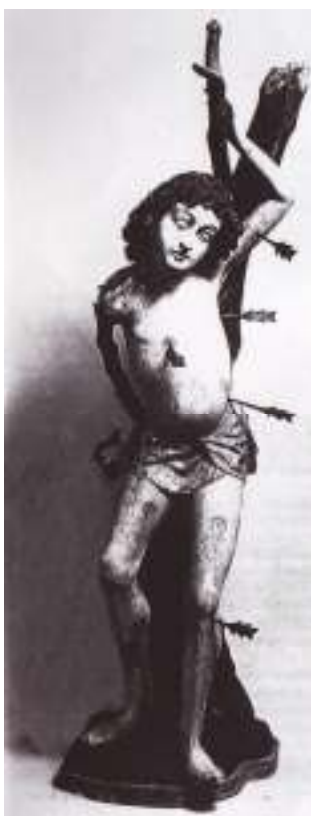
14 Svatý Šebestián ze Zelené Hory, 1470–1480, dřevo, 149 cm i s kmenem, Památkový ústav v Plzni.