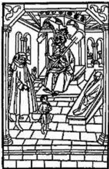
41 Hádání Oráče se smrtí, kolem roku 1460, dřevořez z německého vydání knihy Oráč z Čech Jana ze Žatce.