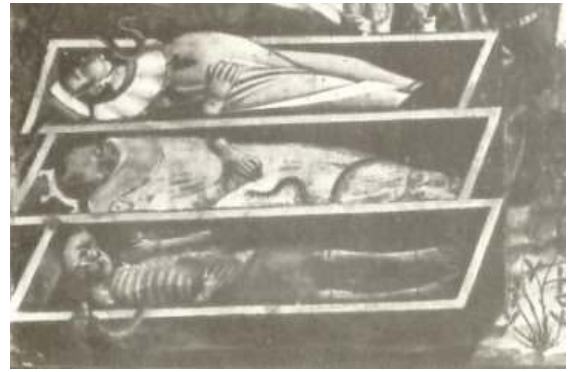
25 Tři mrtví, detail Triumfu Smrti, kolem poloviny 14. století, nástěnná malba, Campo Santo, Pisa.