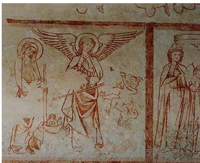
22 Psychostasis – vážení duší, scéna na fresce Posledního soudu, 1310–1320, kostel svatého Mořice, Mouřenec u Annína.