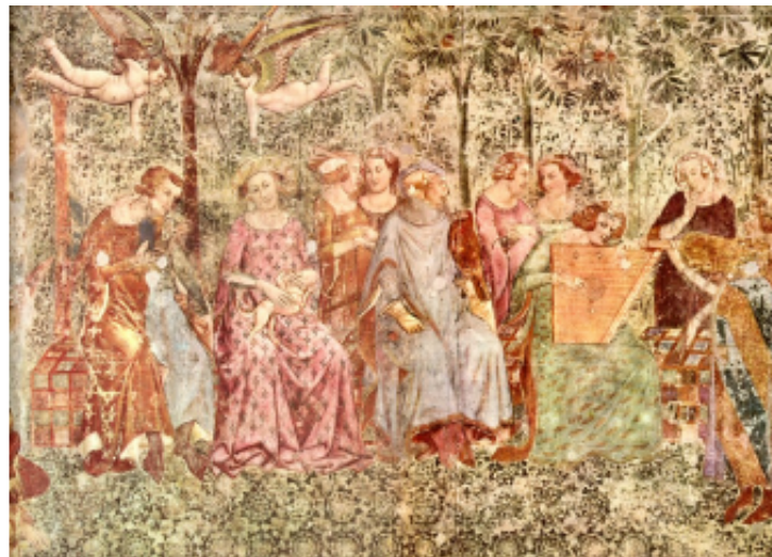
27 Společnost v hájku, detail Triumfu smrti, kolem poloviny 14. století, nástěnná malba, Campo Santo, Pisa.