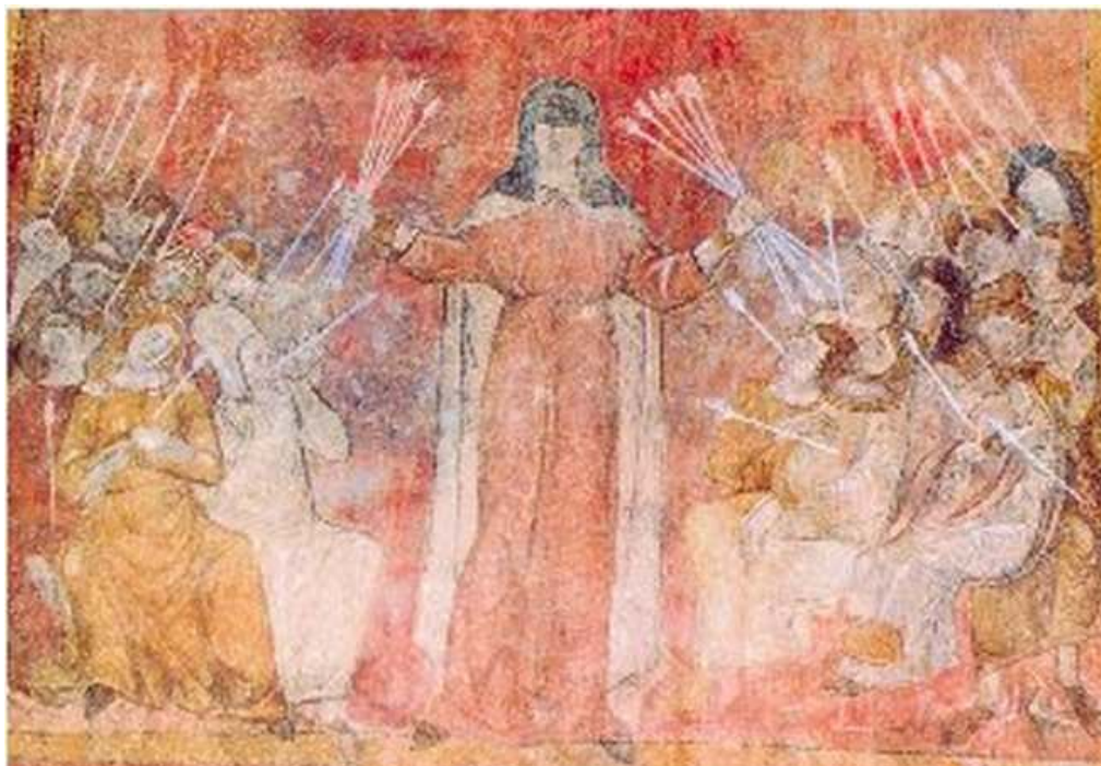
36 Černá smrt, kolem roku 1355, nástěnná malba, kostel svatého Ondřeje v Lavaudieu, Francie.