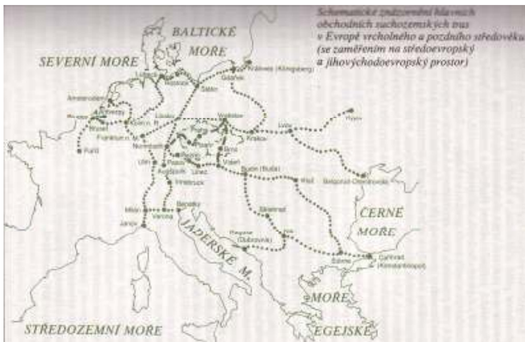
6 Mapa: Hlavní obchodní trasy v Evropě na konci vrcholného středověku.