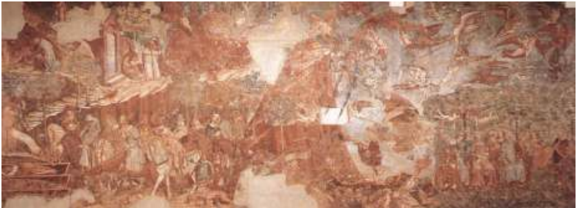
23 Triumf Smrti, kolem poloviny 14. století, nástěnná malba, Campo Santo, Pisa.