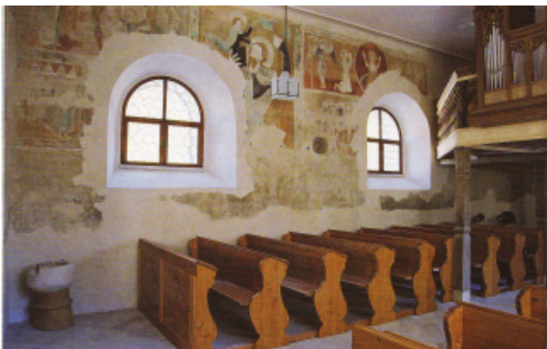
33 Poslední soud – pohled do lodi, druhá polovina 14. století, nástěnná malba na západní stěně lodi kostela sv. Mikuláše, Starý Svojanov.