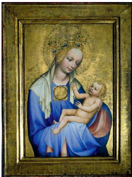
15 Madona Roudnická, kolem roku 1380, tempera na lipové desce, 90×68, Národní galerie v Praze.