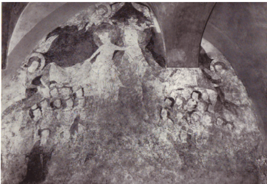
10 . Panna Maria Ochránitelka, kolem roku 1340, nástěnná malba, křížová chodba v johanitské komendě, Strakonice.