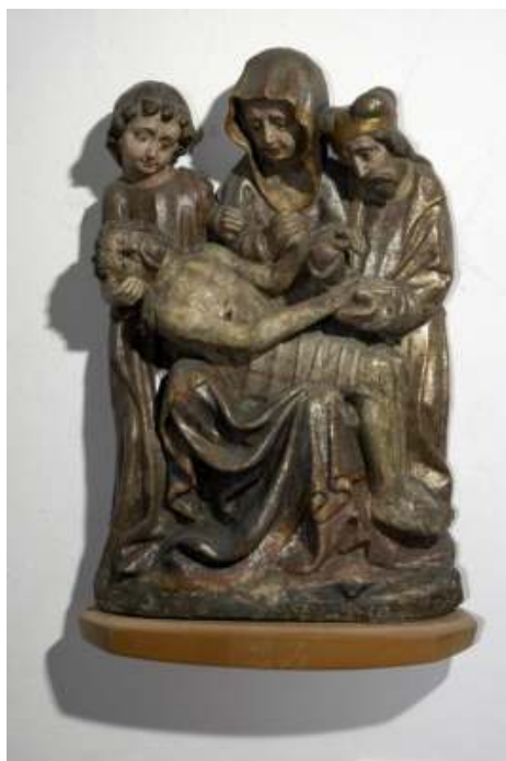
17 Litoměřická pieta se sv. Janem a sv. Josefem Arimatijským, konec 14. století, Severočeská galerie výtvarného umění, Litoměřice.