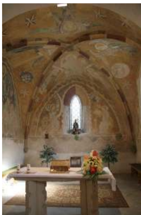
29 Maiestas Domini, druhá polovina 14. století, nástěnná malba v klenbě presbytáře, kostel sv. Mikuláše, Starý Svojanov.