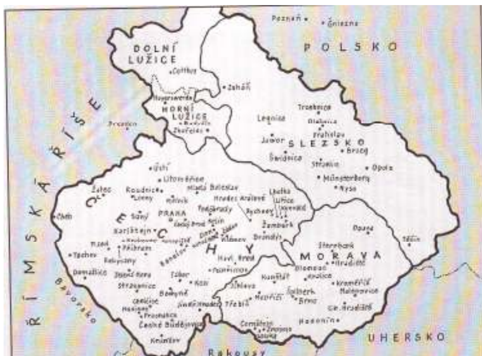
2 Mapa: Země Koruny české v době vlády Václava IV.