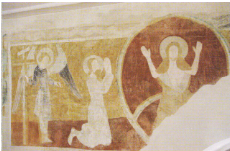
32 Poslední soud, druhá polovina 14. století, nástěnná malba na západní stěně lodi kostela sv. Mikuláše, Starý Svojanov.