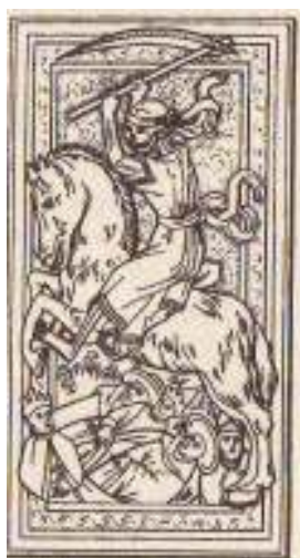
34 Hrací karta Karla VI., 1392.