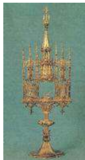
9 Monstrance, kolem roku 1400, původně z kostela Panny Marie v Sedlci, Národní galerie v Praze.