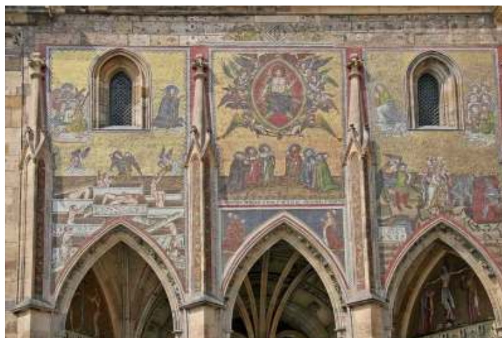
28 Poslední soud, 1370–1371, mozaika, Zlatá brána katedrály svatého Víta, Pražský Hrad.