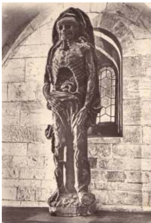
35 Kostlivec zvaný Brigita, po roce 1520, kostel svatého Jiří, Pražský Hrad.