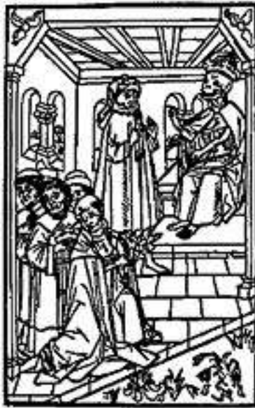
42 Trůnící Smrt zysoka domlouvá žalobci, kolem roku 1460, dřevořez z německého vydání knihy Oráč z Čech Jana ze Žatce.