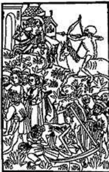
42 Různé podoby smrti, kolem roku 1460, dřevořez z německého vydání knihy Oráč z Čech Jana ze Žatce.