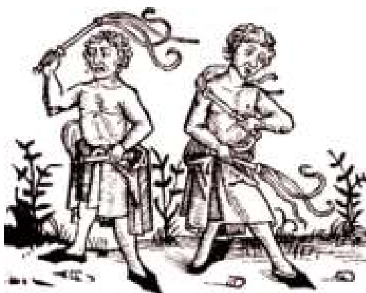
8 Flagelanti, ilustrace.