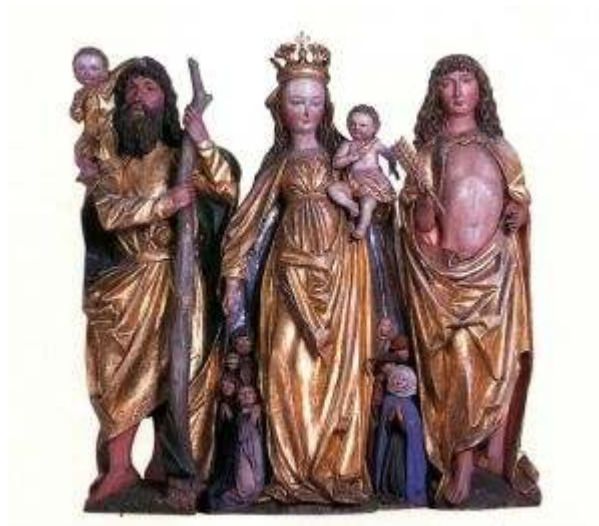
12 Panna Maria Ochranielka, svatý Šebestián a svatý Kryštof, konec 15. století, sochy z archy kostela sv. Markéty, Kašperské Hory.