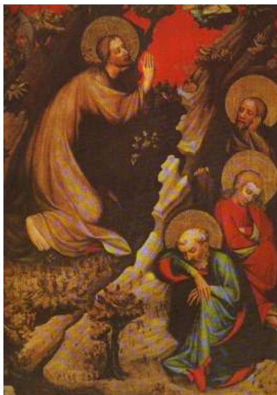
20 Kristus na hoře Olivetské, Mistr Třeboňského oltáře, kolem roku 1380, smrkové dřevo, 132×92, Národní galerie v Praze.