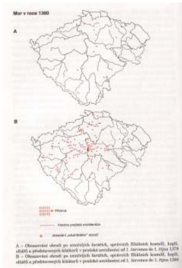
5 Mapa: Mor v českých zemích v roce 1380.