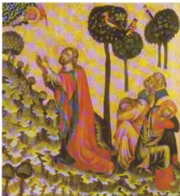
19 Kristus na hoře Olivetské, Mistr Vyšebrodského oltáře, před rokem 1350, tempera na javorovém dřevě, 99,5×91,5; Národní galerie v Praze.