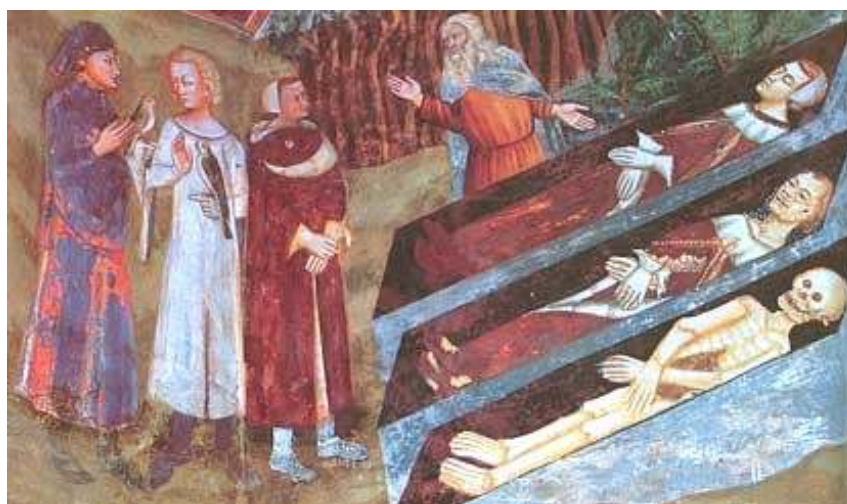
37 Legenda o setkání třech mrtvých a třech živých, 1363-1366, Sacro Speco a Subiaco, u Říma.