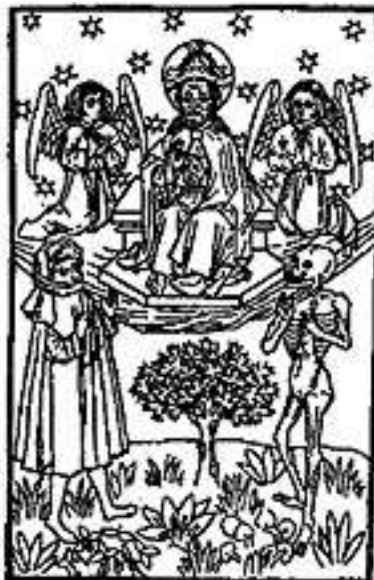
44 Oráč se Smrtí před Božím soudem, kolem roku 1460, dřevořez z německého vydání knihy Oráč z Čech Jana ze Žatce.