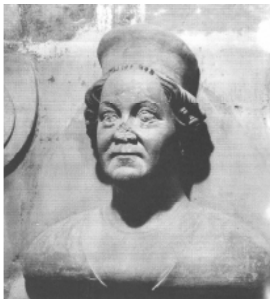
7 Bysta Beneše Krabice z Weitmile, 1378–1379, pískovec, v dolním triforiu katedrály svatého Víta, Praha.