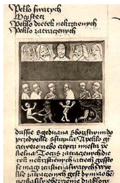
40 Pekelník přistrkuje hříšníky do tlamy pekelné, před rokem 1420, tzv. krumlovský sborník, Knihovna Národního muzea v Praze.