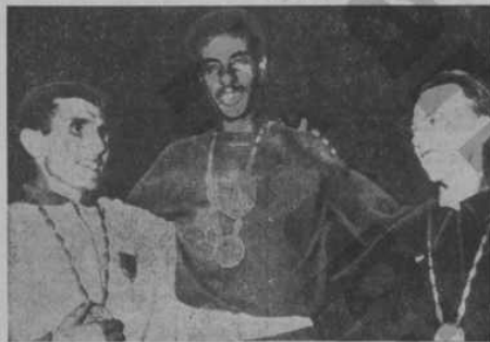
Olympijské množství světové olympijské hry. Na pravém okraji světového olympijského vítěze, který byl světovým vítězem v Římě. Na levém okraji světového olympijského vítěze, který byl světovým vítězem v Římě.

Řím nedávno večer. Na štadión Olympio zasedla veřejnost. Zasedla olympijských her. Řím v tomto ohledu byl světovým vítězem. Každý z nás, kdo byl v Římě, měl pocit, že se účastní největší světové přehládky světové olympijské hry. Každý z nás, kdo byl v Římě, měl pocit, že se účastní největší světové přehládky světové olympijské hry.