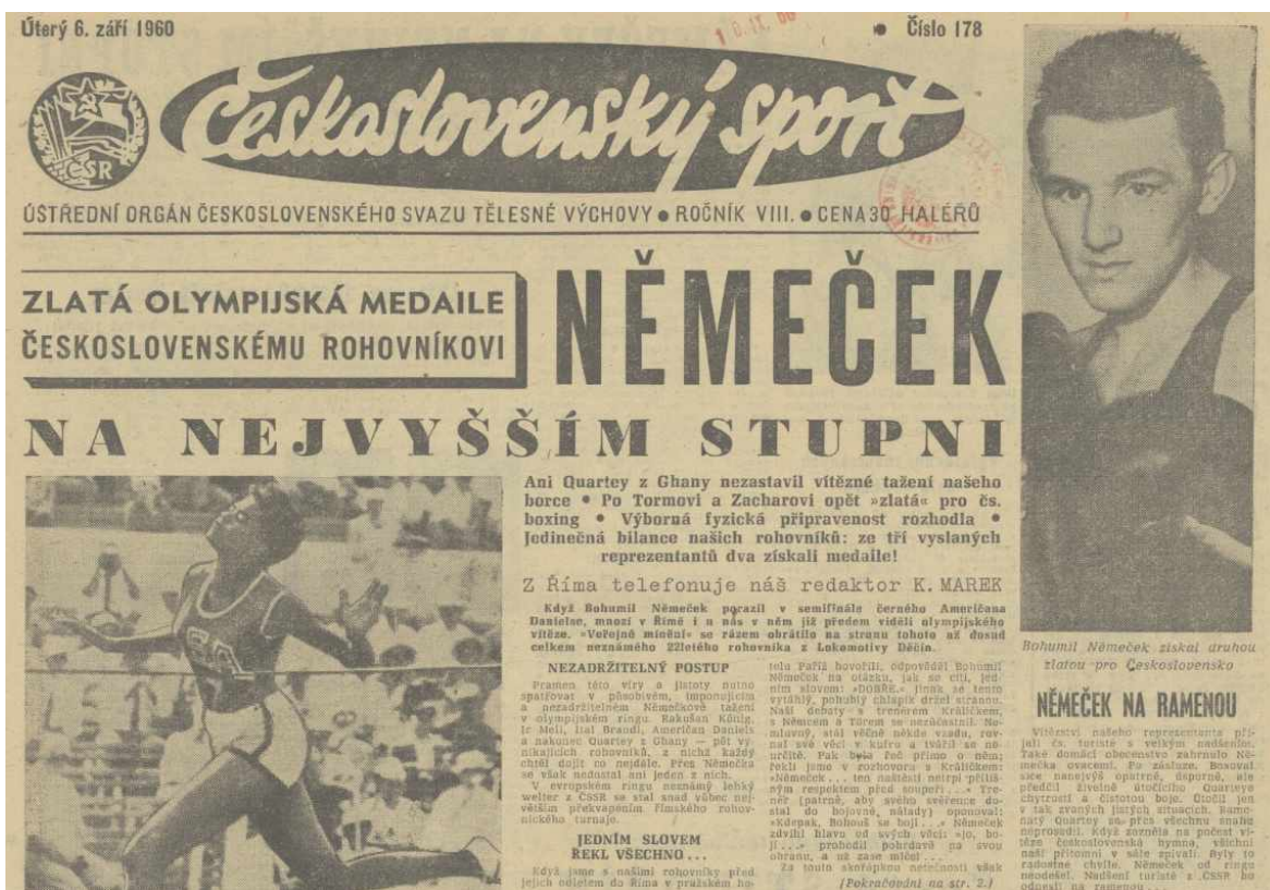
Obrázek 5 - Titulní strana Československého sportu 6. září 1960 po vítězství Bohumila Němečka v olympijském ringu

medaile. Němeček zlatou v lehké walterové váze a Němec bronzovou medaili za třetí místo v těžké váze. „Úspěch dvojnásob radostný, protože je naprosto nečekaný.“ 326