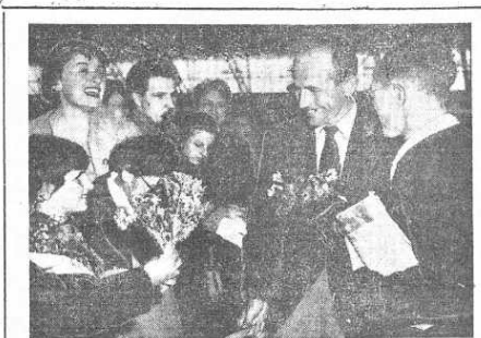
Také v Melbourne dobře znají Emila Zátopka Po příjezdu do Melbourne uvítala našeho reprezentanta Emila Zátopka melbournská děvčata květinovými dary.

Sympatizujeme se všemi asijskými a africkými národy a buďme s každým z nich