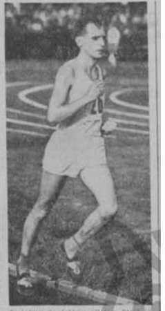
Poslední světový olympijský vítěz, který byl světovým vítězem v Římě. Každý z nás, kdo byl v Římě, měl pocit, že se účastní největší světové přehládky světové olympijské hry.