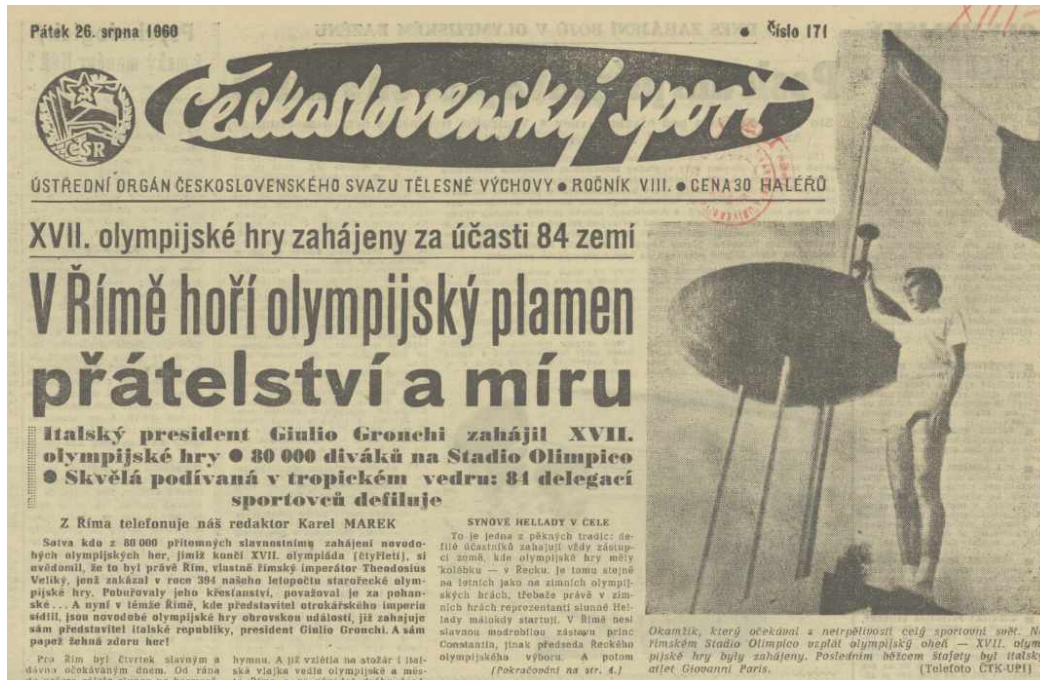
Obrázek 4 – Titulní strana Československého sportu 26. srpna 1960 po slavnostním zahájení olympiády v Římě

O den později se sledované tituly věnovaly ve svých reportážích slavnostnímu zahájení olympijských her. Zajímavostí určitě bylo, že Československý sport i Svobodné slovo na titulní stranu zařadily stejnou fotografii převzatou od ČTK ( Rudé právo totožnou fotku použilo na straně číslo čtyři). Na ní byl zachycen „ okamžik, který očekával s netrpělivostí celý sportovní svět. Na římském Stadio Olimpico vzplál olympijský oheň – XVII. olympijské hry byly zahájeny. Posledním běžcem štafety byl italský atlet Giovanni Paris “. 294