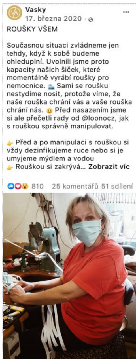
Obrázek 5: Příspěvek značky Vasky informující uživatele o výrobě roušek