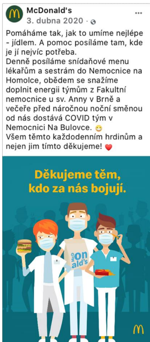
Obrázek 4: Příspěvek rychlého občerstvení McDonald's informující o darování jídla do českých nemocnic