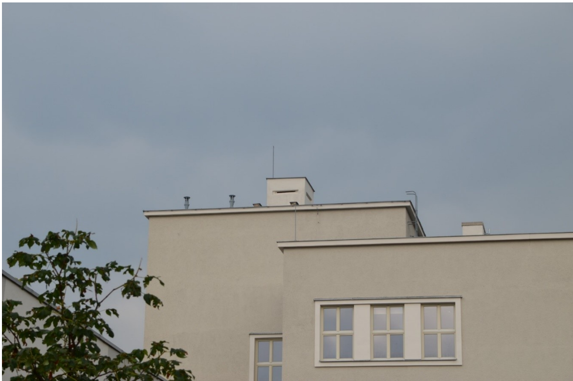
Příloha 1 Výšková střešní pozorovatelna CO z 50. let min. století na střeše školní budovy F. L. Čelakovského ve Strakonících.