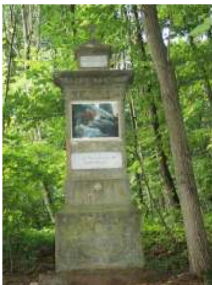
Obrázek č.7 – XIV. zastavení křížové cesty, Smržov, současný stav.

Nyní podrobněji popíšeme křížovou cestu, která do oválu obklopuje kapli Panny Marie a začíná i končí pod schody, které vedou od kaple k pramenu. Věnujme nyní pozornost jednotlivým nápisům na stélách zastavení (viz obrázek č. 7), které se skládá z podstavce, dříku, vysazené římsy a vrcholí drobným stélovým útvarem s křížkem na vrcholu. Celková výška činí 270 cm. Na dříku jsou nad sebou dvě obdélná pole, větší pro malbu pašijového cyklu a pod ním menší pro nápisovou desku. Ve spodní části dříku uprostřed je vsazen zlacený kříž, místo, kde bylo zastavení posvěceno. Číselný údaj o pořadí s textem „Zastavení“ je umístěn nad hlavní římsou .