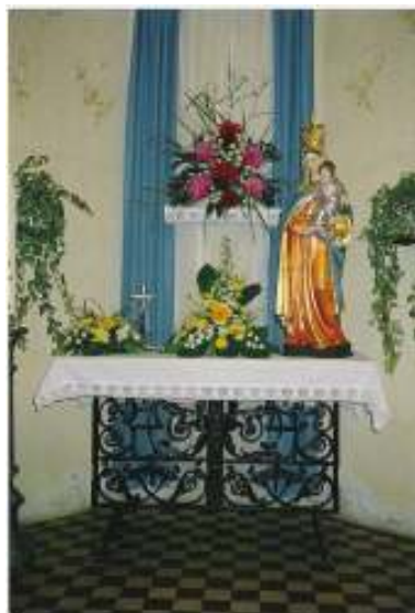
Obrázek č. 12. –Fotografie zachycuje veškerý inventář kaple od 70. let 20. století do r.2004, kovaný přenosný oltář s dřevěnou deskou, podstavec (s červenou kyticí) sloužil pro sochu Panny Marie.

u mariánské kapličky: „Bývala místem slavných mariánských poutí a cílem četných a mohutných procesí z blízkého okolí, ale i z dalekého Úpicka. Moderní doba jaksí pomíjí kult kapličky, nepřicházejí procesí, ani dav věřících. Celá ta velebná prostora přírody však dále vábí své četné ctitele. Štědře udílí všem své vůně, své stíny, své blahodárné ticho i příjemné odpočinutí. Dnes je cílem četných vycházek z blízkých škol [...]. O nedělích přicházejí stařenky ke své kapličce se svými starostmi a bolestmi a za vlažných večerů se tu na svých vycházkách ztrácejí mladé dvojice se svými tužbami. 100