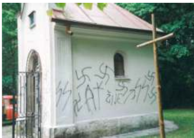
Obrázek č. 13. – Fotografie poškozené kaple s provizorním křížem, okolo roku 1995.

V době velikonoční pokračují pobožnosti u kapličky ve Smržově modlitbou slavných tajemství růžence, která je uvedena znamením kříže, vzýváním Ducha svatého, vyznáním víry a modlitbou tří zdrávasů s božskými ctnostmi víry, naděje a lásky. Jednotlivé desátky byly doplňovány rozjímáním, ale postupem času se ukázalo užitečnější zařadit po modlitbě ucelenější „katechezi“, protože ke kapli přicházejí i místní babičky, které do kostela už nechodí a církve prošla mnoha změnami od dob jejich mládí. Proto po modlitbě a zpěvu „Vesel se nebes královno“ je systematicky čten na pokračování Katechismus katolické církve s možností závěrečné diskuze. Setkání končí společnou modlitbou Otčenáše, Zdrávas Maria a Sláva Otci „za ochranu tohoto poutního místa“, které bylo v devadesátých letech dvacátého století častým cílem vandalů (viz obrázek č. 13.).