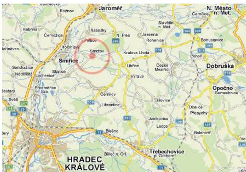
Obrázek č. 1 – lokalizace obce Smržov a jejího okolí na mapě

Hluboké náboženské cítění prostého lidu, krásná přírodní scenérie a pověstmi opředená studánka 66 na okraji lesa dala vznik skromnému poutnímu místu Smržov. Je malé, avšak jediné mariánské 67 , poutní místo královéhradeckého vikariátu, leží v jeho nejvýchodnějším cípu nedaleko městečka Smiřice (4 km). Je také na dohled od města Jaroměř-Josefov (5 km), které je součástí vikariátu Náchod. Poutní kaple zasvěcená Navštívení Panny Marie se nachází za severním okrajem vesnice ve svahu nad studánkou v jihozápadním výběžku Pleského lesa (viz obrázek č.1).