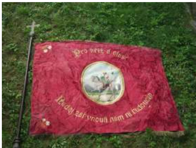
Obrázek č. 6 – Svatováclavská korouhev s textem: „Pro kříž a vlast“ a „Nedej zahynouti nám ni budoucím“, Čibuz, přelom 19 a 20. století.

který nechtěl, aby při svěcení zastavení křížové cesty hráli intrády a pochody. Kromě toho se cítil pan učitel uražen, že ho osobně smržovští nepozvali na slavnost, a tak se hudebníci po chvíli vytratili, a vše se dále odehrávalo bez hudby, i když si to lid i kněží přáli.