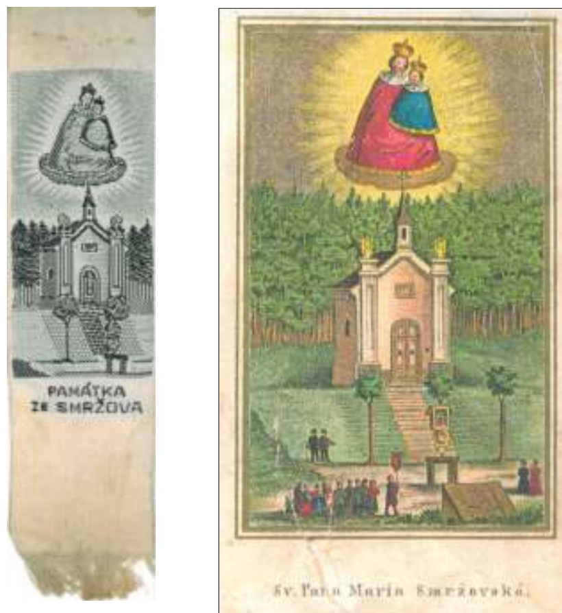
Obrázek č. 4 - Svatý obrázek ze Smržova, fotokopie věnována sběratelem panem Václavem Píchou z Rožnova pod Radhoštěm, vyšívána stužka na oděv se stejným motivem, v majetku autorky.

Při této příležitosti byl lidu rozdáván pamětní „svatý obrázek“ (viz obrázek č. 4 vpravo), který nejlépe ilustruje lidovou zbožnost té doby - přicházející procesí s korouhví,