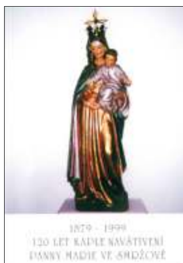
Obrázek č. 8. – Svatý obrázek se sochou Panny Marie, Smržov, 1999, v majetku autorky.

Roku 1889 dal čibuzský farář zhotovit u pražského řezbáře Krejčíka novou polychromovanou sochu Madony s Ježíškem (viz obrázek č.8) namísto původní již nevkusné sošky „k nábožnosti nikterak povzbuzující“.