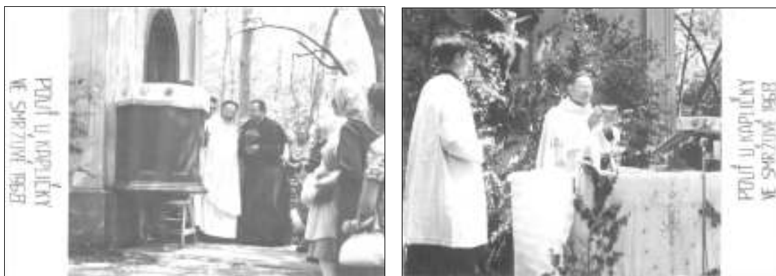
Obrázek č. 11. – Fotografické upomínky na pouť v roce 1968.

Doba, která přišla, nepřála víře ani veřejným projevům lidové zbožnosti, a tak i zprávy v kronikách jsou již velmi skoupé. Je zmíněna slavná pouť s propuštěným biskupem Karlem Otčenáškem (rodákem z nedalekého Českého Meziříčí) v roce 1968, po jejímž konání byly rozmnoženy fotografie, které nahrazovaly „svaté obrázky“ z poutí ( viz obrázek č. 11).