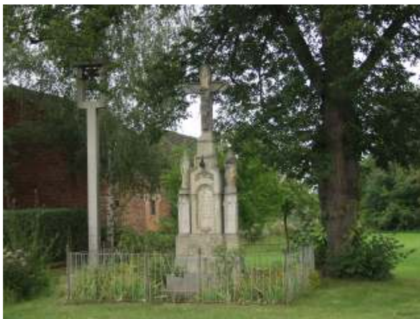
Obrázek č.2. – Smržov, kříž na návsi, pohled z východu. Foto: Slánská Iva, 2007.

Na zadní straně podstavce je nápis: „ Zřízeno od obce Smržovské ke cti a chvále boží. Za představeného Václ. Zvalského a důstojného pana faráře Vác. Sováka v Číbuzi L.P. 1875 “. Kříž se stal místem modlitby i cílem procesí (viz dále).