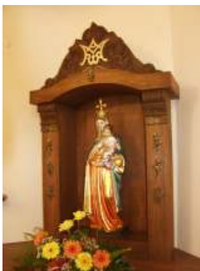
Obrázek č. 15. – Nový oltář pro sochu Panny Marie, kaple Smržov, 2004.