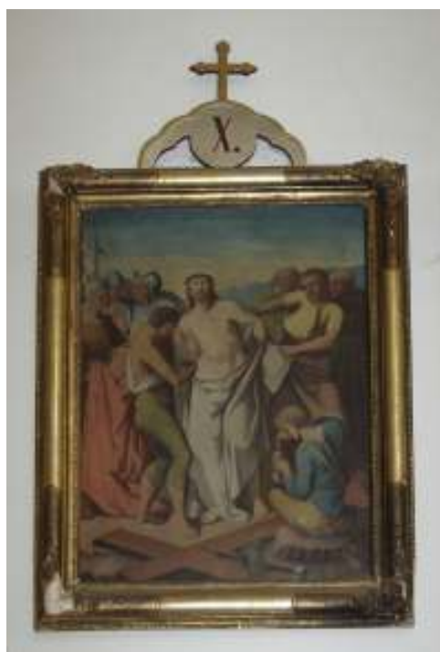
Obrázek č. 5. – obraz křížové cesty, kostel sv. Václava v Číbuzi.

O dva roky později, na podzim roku 1881, dodala firma Augustin Blachke kamennou pískovcovou křížovou cestu s obrazy malovanými na plechu (viz obrázek č. 7) od malířské firmy Josef Hofrichtr a syn z Rychnova u Jablonce, která vyhotovila i obrazy křížové cesty pro kostel sv. Václava v Číbuzi (viz obrázek č. 5).