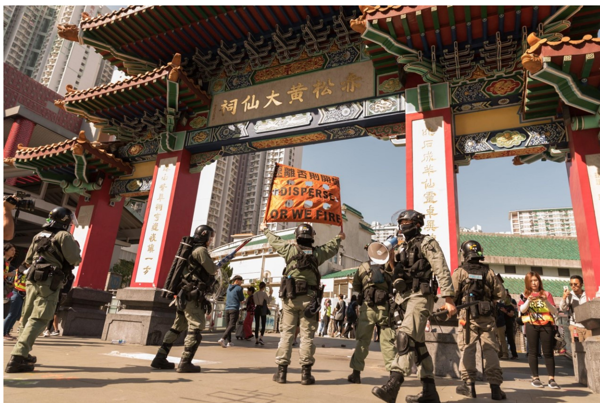
Obr. 11. Policie ukazuje varovný transparent „Rozejděte se nebo vystřelíme” před chrámem Wong Tai Sin. Hongkong, 11. listopadu 2019

V ohledu na narativní struktury lze snímek zařadit jako netransakční akci, k tomuto závěru autorka došla poté, co jako nejdůležitějšího účastníka označila policistu, kterému je jako jedinému vidět do tváře. Policista má nakročeno směrem mimo rám a vektory jeho těla a pohledu naznačují akci, která směřuje k cíli, který je pro diváka neviditelný. Co se prostředí týče, snímek nabízí divákovi poměrně širokou perspektivu, protože může ze snímku vyčíst mnoho informací. Taoistický chrám Wong Tai Sin je významnou hongkongskou památkou, znalému divákovi tato informace nabídne širší kontext událostí, takže prostředí lze definovat jako rozpoznatelné, čímž je modalita snímku vysoká. Jak bylo již řečeno, pohled policisty směřuje směrem k cíli mimo rám a ostatním policistům není vidět do tváře, tudíž se jedná o kontakt nabídky a dále lze snímek definovat jako celek. Následně kombinace úhlu zdola a horizontálně šikmého pohledu vytváří pocit odstupů. Tyto čtyři zmíněné faktory dohromady formují velmi neosobní vztah mezi divákem a zobrazovaným. Horizontální úhel zdola dává policistovi v uniformě symbolickou moc, což v tomto případě dále zvýrazňuje jeho autoritu.