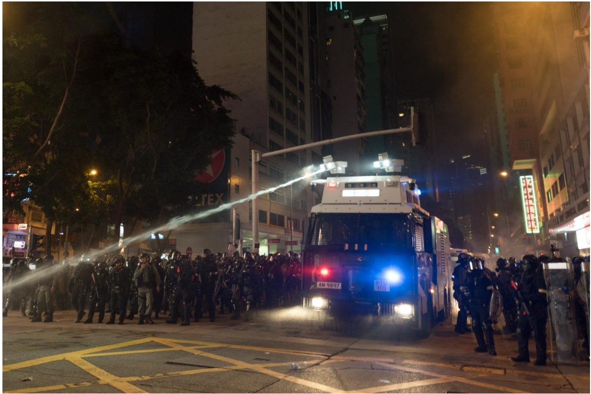
Policejní složky povolávají proti demonstrantům vodní dělo, které často používá vodu s chemikáliemi. Hongkong 29. září 2019