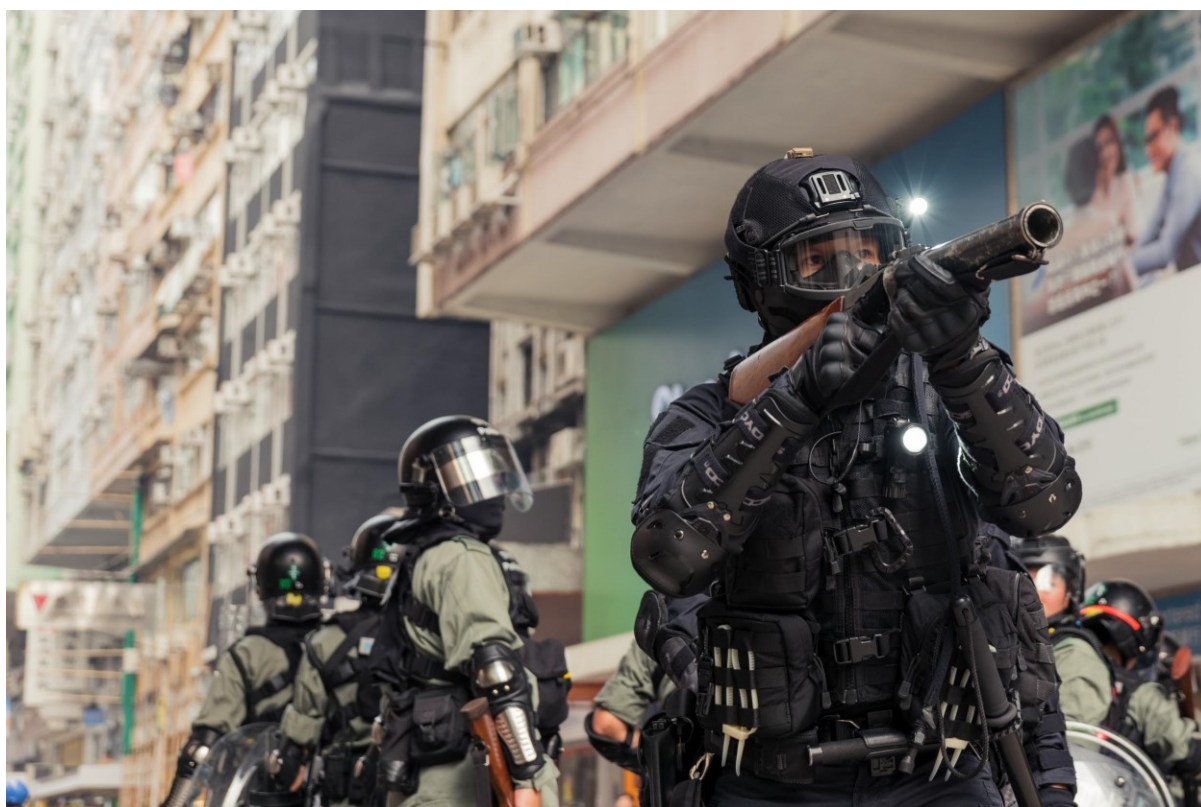
Obr. 5. Policisté používají proti demonstrantům během protestu ve Wan Chai slzný plyn. Hong Kong, 29. září 2019

Čtvrtý snímek zobrazuje jednoho policistu oblečeného do černé uniformy mířícího zbraní na cíl, který je mimo rám obrazu. V pozadí je možno vidět další policisty, kteří jsou však oblečení do zelených uniforem a jsou tedy vizuálně odlišní od hlavního aktéra. Ten má na sobě kromě uniformy také helmu s baterkou, ochranné brýle, rukavice, chrániče a vojenskou vestu, ke které má připevněno několik dalších kusů příslušenství. Mimo střelné zbraně na slzný plyn je vidět obušek a pouzdro na ruční zbraň. Policisté v pozadí vypadají méně armádně, mají jiné přilby a jiný typ zbraní. Policisté nejspíše stojí na ulici v nějaké rezidenční čtvrti, protože na snímku lze vidět vysoké budovy, které připomínají spíše bytové jednotky, než kancelářské budovy.