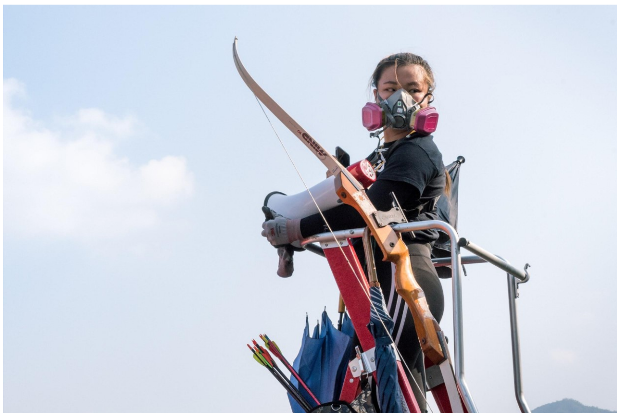
Obr. 12. Dívka hlídá most vedoucí ke kampusu Chinese University of Hong Kong, který se den předtím změnil v bojiště mezi protestujícími a policií. Hong Kong, 13. listopadu 2019

Protože je dívka zobrazena sama a její pohled směřuje na podnět-cíl, který se nachází mimo snímek, lze snímek kategorizovat jako netransakční akci, kde je prostředí nerozpoznatelné, což ubírá na modalitě. Odvrácený pohled dívky-aktéra vytváří kontakt nabídky, kdy je divákovi předložen výjev k určitému zamyšlení. Zajímavý kontrast tvoří frontální pohled na obličej dívky, jejíž zbytek těla je však natočen šikmo k divákovi, což lze považovat za tradiční stereotyp zobrazování žen, kdy je divákovi nabídnut pouze pohled, ale ne tělo. Toto lze vyložit tak, že i když je divák do určité míry zapojen do kontaktu se zobrazovaným, existuje stále pocit určitého omezení, odstupu. Tento konflikt mezi neosobním a společenským vztahem diváka a zobrazovaného účastníka lze také představit prostřednictvím sociální vzdálenosti, kdy snímek podle definice použité v metodologické části zapadá mezi kategorie celku a polocelku, což by naznačovalo další sporný postoj mezi odstupem a zapojením diváka. Lze tedy uzavřít tuto myšlenku tak, že účastník určitým způsobem vybízí diváka, aby se nad zobrazovaným zamyslel, ale zároveň nepřímým očním kontaktem a pozicí těla dává najevo, že je nedosažitelný. Tomuto napomáhá použitý úhel zdola, čímž je symbolická moc na straně zobrazovaného. Navíc fakt, že se účastník dívá na cíl, který je