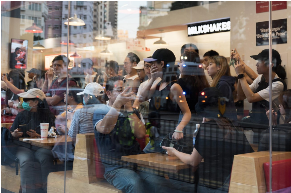
Návštěvníci restaurace na ostrově Hongkong pozorují zásahy policie proti protestujícím ve Wan Chain. Hongkong 10. listopadu 2019