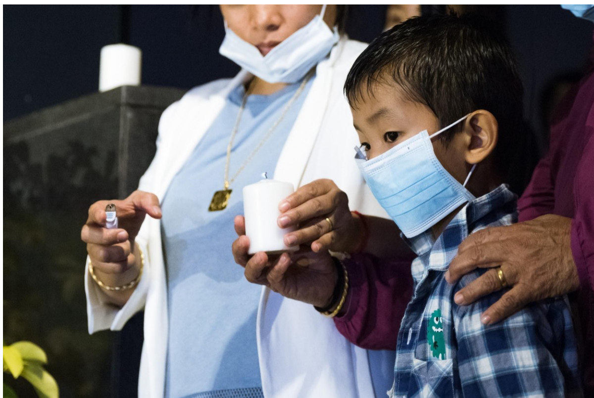
Obr. 10. Tisíce lidí se shromáždily na shromáždění v Admiralty, aby truchlily nad smrtí studenta, který zemřel během policejní akce. Hongkong, 9. listopadu 2019

Protože byl snímek pořízen v noci, není možné vypozorovat mnoho, co se prostředí týče. Nicméně v pozadí je možné zahlédnout další svíčku, takže se divák může domnívat, že se jedná o scénu z místa, kde lidé pokládají svíce a květiny – tedy jakýsi oltář, či jinak významné smuteční místo. Navíc jsou všichni účastníci poměrně formálně oblečení, což dále značí významnost momentu.