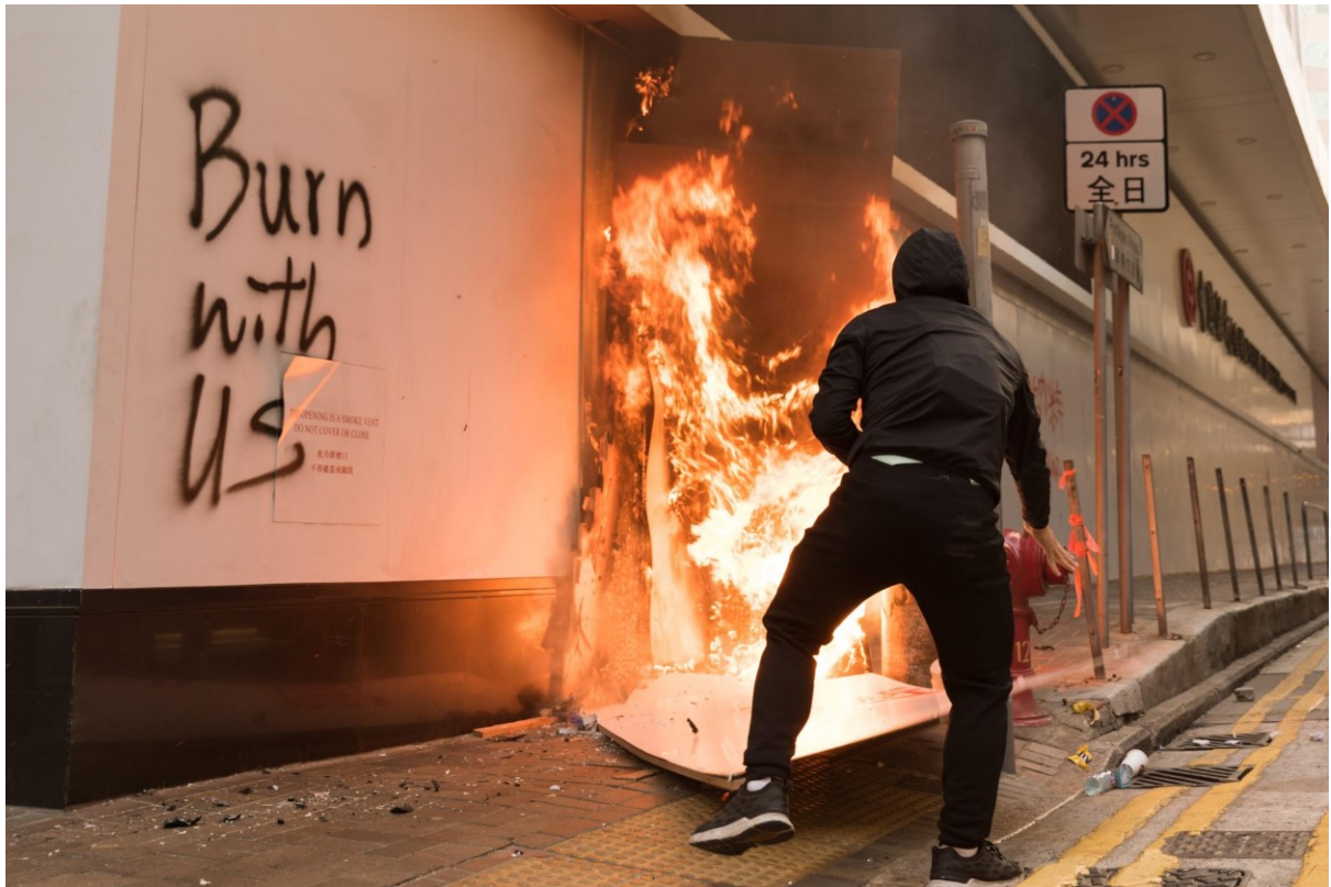
Protestující přidává do ohně u Bank of China v Central, zatímco protesty na ostrově Hongkong eskalují. Hong Kong, 11. listopadu 2019