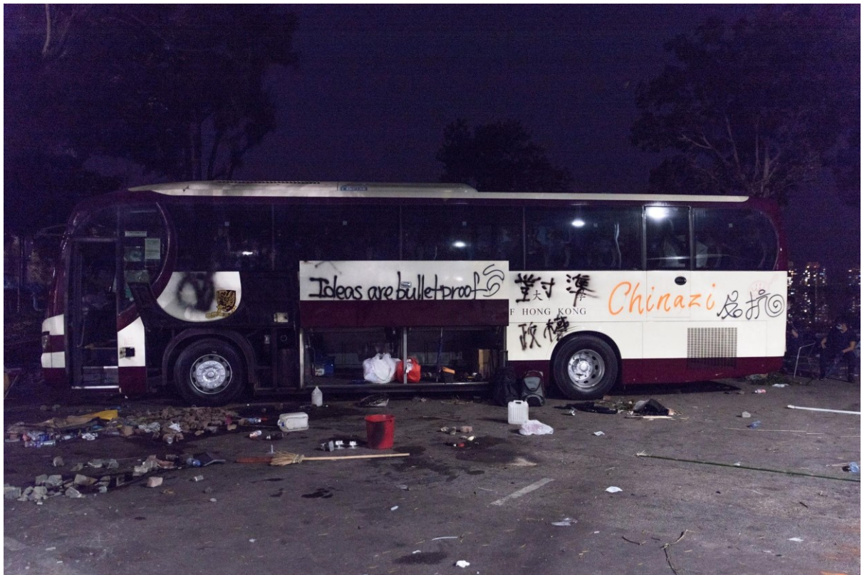
Studenti používají školní autobusy k přepravě zásob a lidí kolem kampusu Chinese University of Hong Kong den po obléhání univerzity policií. Hong Kong, 13. listopadu 2019