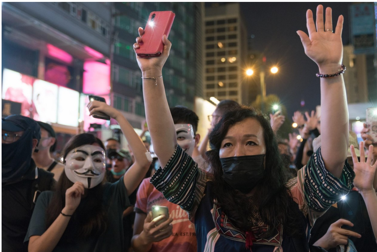
Lidé pokojně protestují před Chungking mansion v Tsim Sha Tsui, aby vyjádřili svůj nesouhlas s vládou. Hong Kong, 27. října 2019