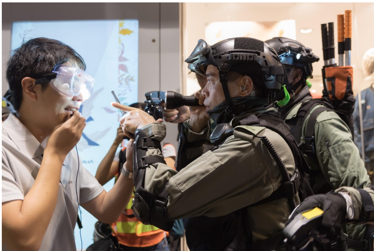
Obr. 8. Protestující se hádá s policií během večerních protestů v Mongkoku. Hongkong, 10. listopadu 2019

Následně se v tomto případě jedná o reprezentativní funkci transakční obousměrné akce. Když si divák podrobně fotografii prohlédne, zjistí, že nejen policista má namířený ukazovák směrem k protestujícím, ale i naopak. Oba muži jsou tedy ve vzájemném kontaktu nejen díky vektorům, které tvoří ruce, ale také proto, že se na sebe přímo dívají. Jak bylo zmíněno výše, prostředí je rozpoznatelné spíše na obecné úrovni - jako prostředí před obchodem, ale ne do takové míry, abychom mohli například přesně určit lokalitu. Protože se oba účastníci dívají na sebe navzájem jedná se o kontakt nabídky, tedy slouží divákovi jako předmět pozorování. S tímto je dále spojený odstup, který je vytvořen horizontálním úhlem, který účastníky zobrazuje z profilu. Pocitu rovnosti diváka a zobrazovaných je docíleno použitím úhlu v úrovni očí. Protože snímek lze definovat jako polocelek, navazuje s divákem společenský vztah. Výraznost je v tomto případě více problematická, protože kvůli použití vysoké clony nebylo dosaženo potřebného rozostření, aby dvojice byla dostatečně oddělena od pozadí a působila tak více výrazně, lze tedy mluvit o menší míře výraznosti v tomto ohledu. Z kompozičního hlediska lze konstatovat, že bylo dodrženo pravidlo třetin, přičemž oči aktérů leží na horní vodorovné linii. S ohledem na rovnovážnost snímku ho můžeme popsat jako