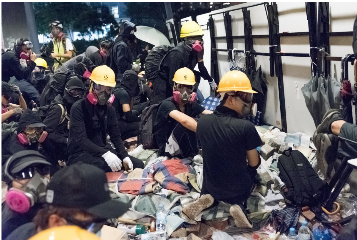
Studenti se připravují na střet s policií na půdě kampusu univerzity City U. Hong Kong, 12. listopadu 2019