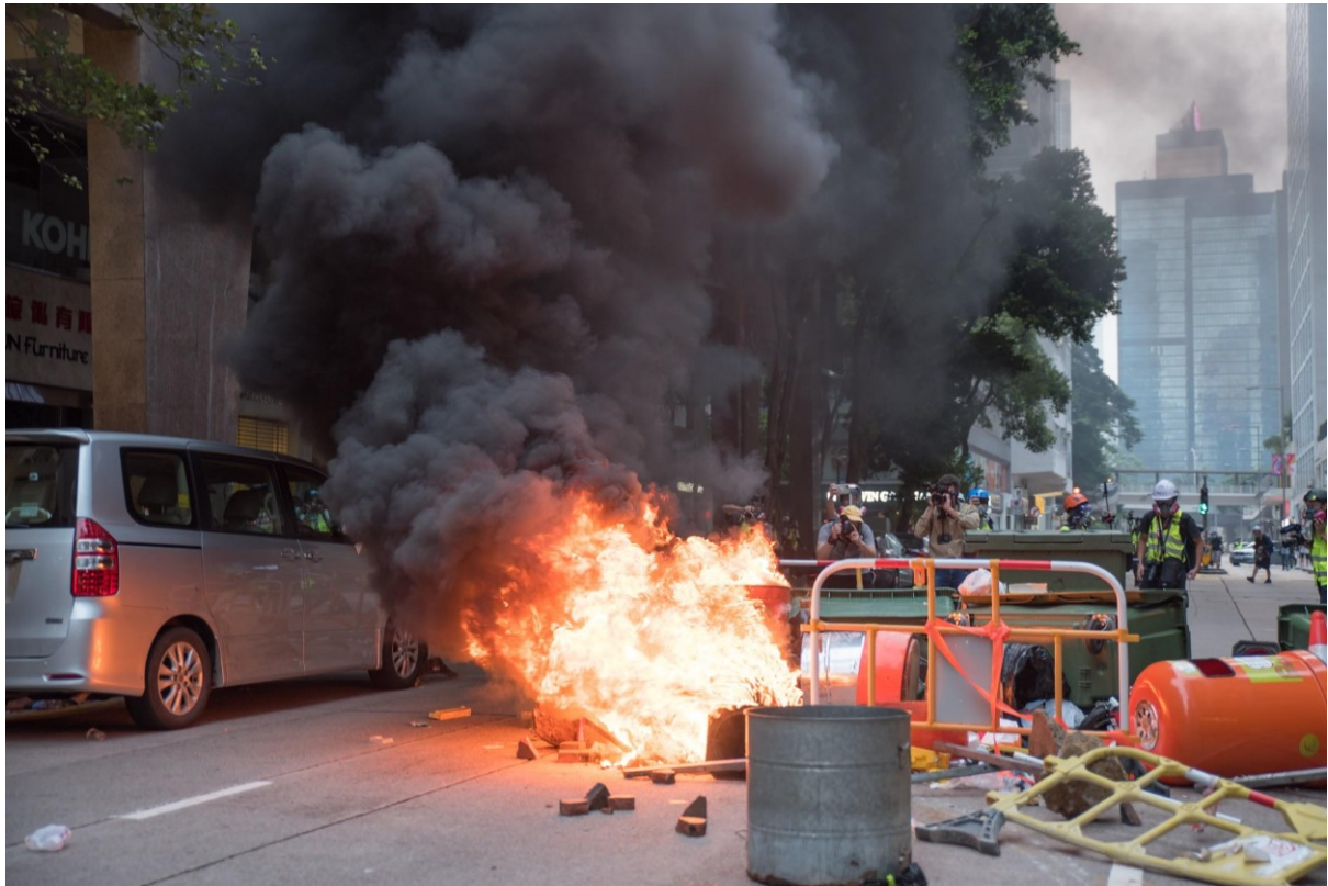
Během protestů někteří účastníci zakládají ohně, jako barikády před policií. Hongkong 29. září 2019