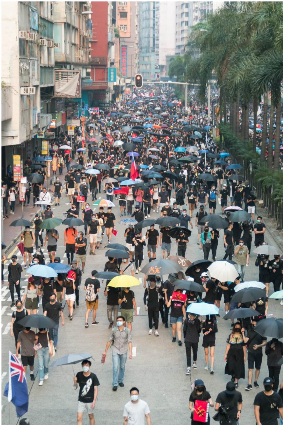
V den 70. výročí založení Čínské lidové republiky zaplňují ulice desítky tisíc demonstrantů v několika městských částech. Hongkong, 1. října 2019