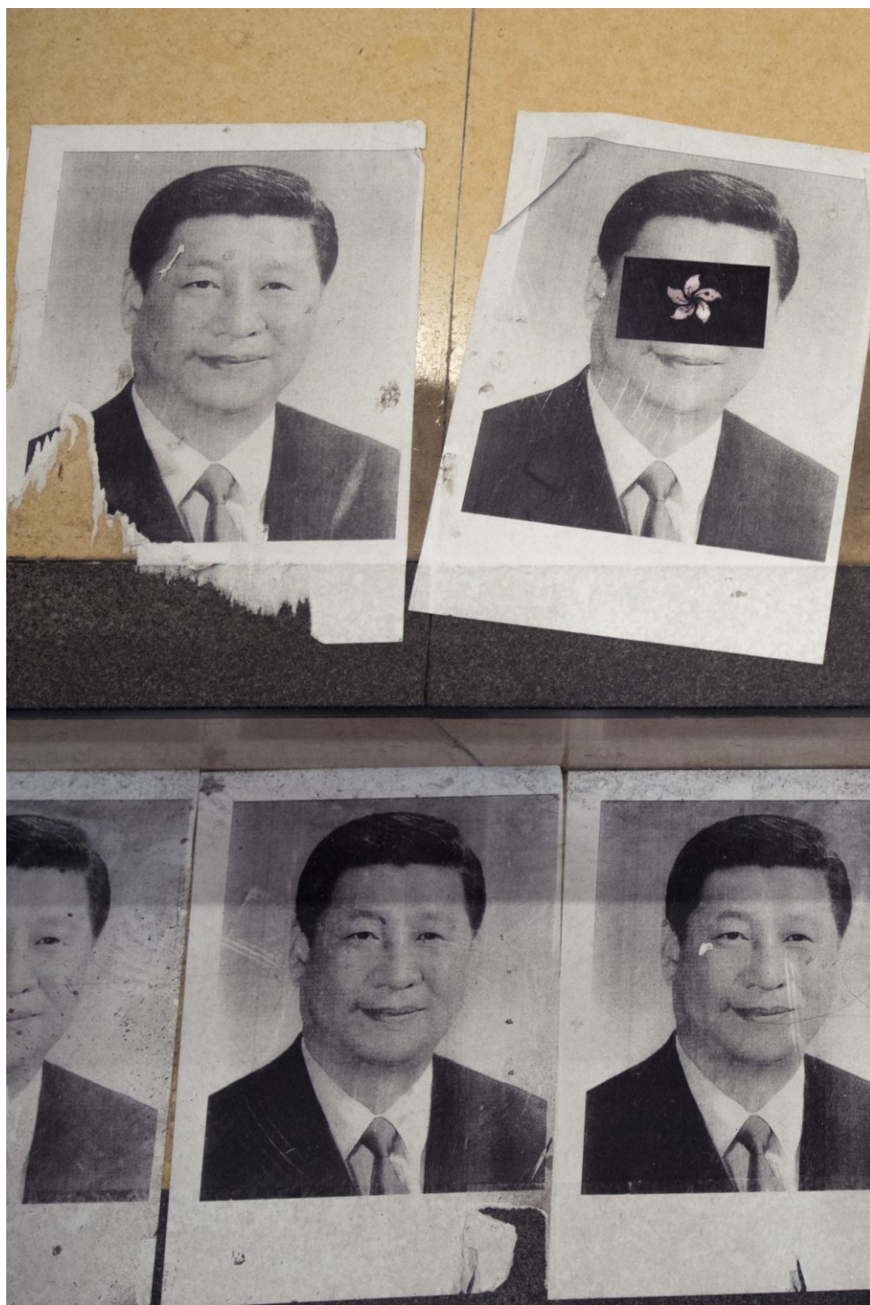
Fotografie čínského prezidenta Si Ťin-pchinga, který je někdy přelepený černou hongkongskou vlajkou, pokrývají shody vedoucí do MTR v okolí Kowloon Tong. Hongkong, 28. září