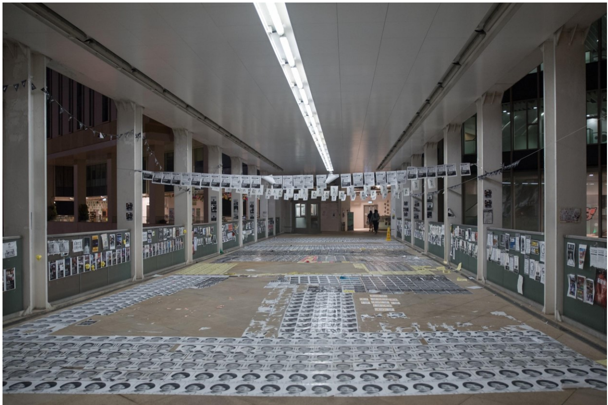
Studenti Hong Kong Baptist University polepují univerzitní kampus politickými plakáty a slogany. Hongkong, 27. října 2019