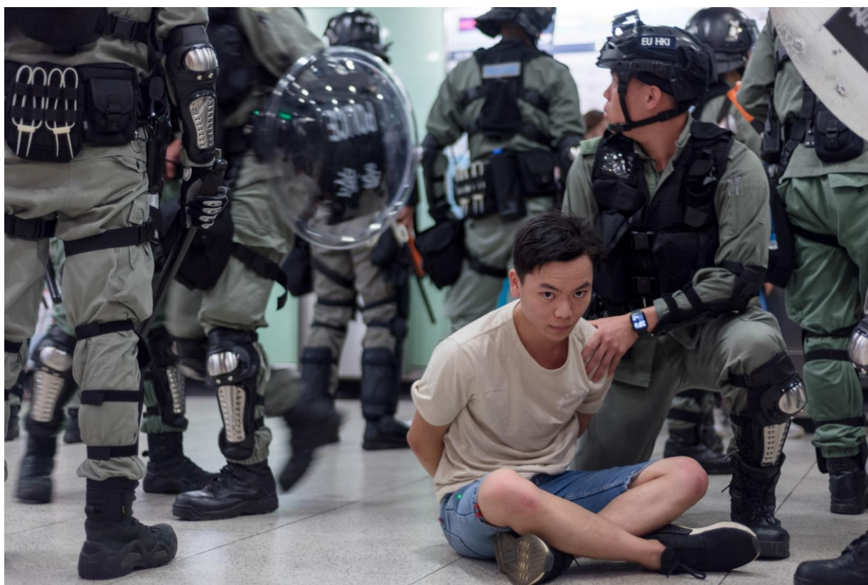
Obr. 2. Policie zatýká muže v MTR stanici Central na ostrově Hongkong. V okolí probíhajícího mírového pochodu na velvyslanectví USA policie během odpoledne zadržela několik desítek protestujících. Hongkong, 8. září 2019

Na prvním snímku, který byl pořízen 8. září 2019, je vyobrazen muž sedící na zemi s rukama za zády a upřeně hledící před sebe. Muž má na sobě džínové šortky, triko s krátkým rukávem a tenisky, není nijak ozbrojen a vypadá spíše jako civilista než stereotypní výtržník. Podle fotografie se může jednat o muže ve věku přibližně 20-30 let. Policista v zelené uniformě klečící vedle něj ho přidržuje za rameno, což může značit snahu zabránit mladíkovi v útěku, spolu s tím, že mladík má ruce za zády, což může vést k představě, že mu byla nasazena pouta. Pohled policisty je upřen na prvek mimo rám, můžeme se domnívat, že jeho pohled nejspíše směřuje na jeho kolegy. Z tohoto důvodu je strážník zobrazen z profilu. Policista má mimo zmíněné uniformy také černou helmu, na které jsou nasazeny ochranné brýle, dále má černé chrániče kolen, holení a loktů. Kolem dvojice se nachází skupina dalších policistů, kteří jsou všichni oblečení stejně a není jim vidět do tváře. Někteří mají plastový štít, obušky a oranžové neletální zbraně a vypadá to, že se jedná o akční situaci, protože v pozadí lze vidět rozmazané nohy policistů, což naznačuje rychlý pohyb.