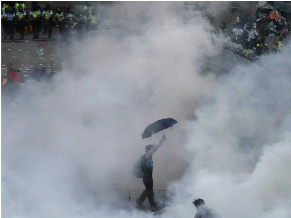
Obr 1. Protestující prochází mlhou slzného plynu, který použila pořádková policie poté, co tisíce demonstrantů v neděli zablokovaly hlavní ulici, vedoucí do finanční čtvrti Central, v blízkosti vládní ředitelství v Hongkongu. (2014)