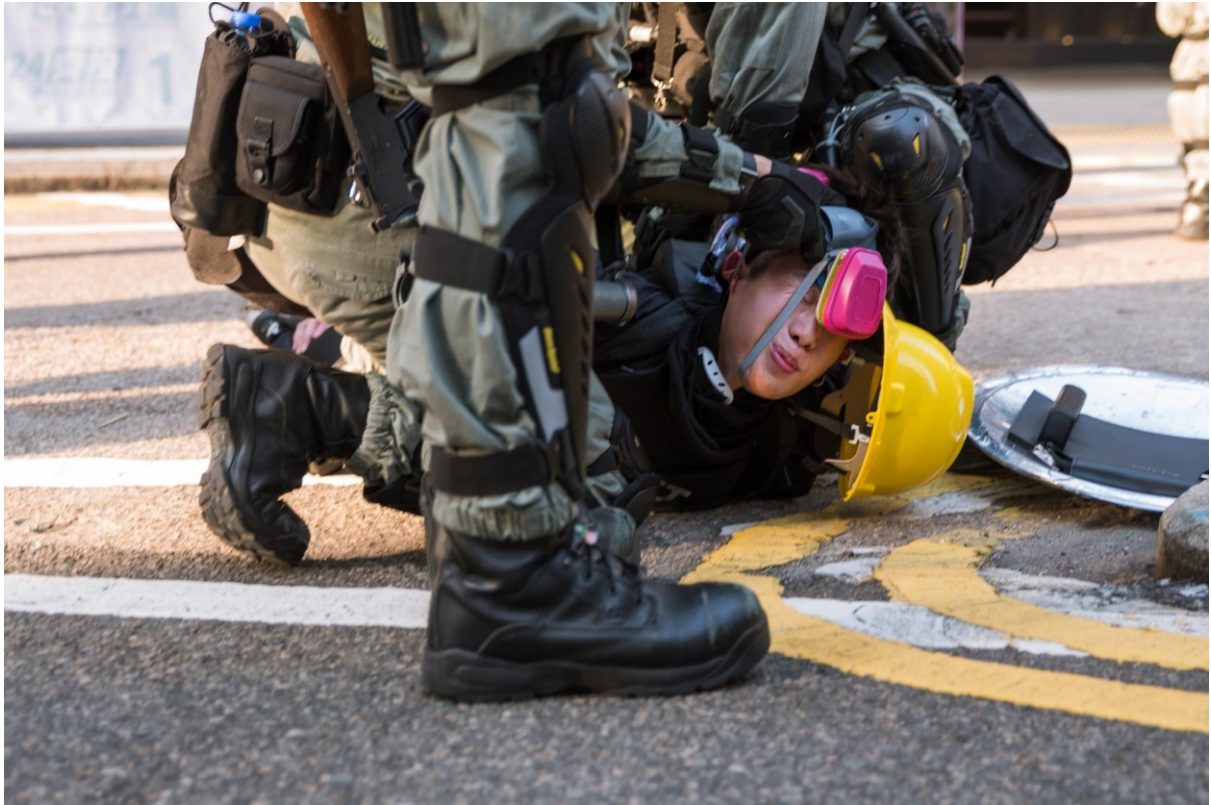
Policie sundává plynovou masku a helmu protestujícímu, který je zadržen v oblasti Causeway Bay. Hong Kong, 2. listopad 2019