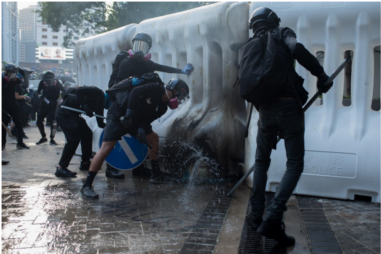
Demonstranti ničí plastové bariéry naplněné vodou, které chrání okolí vládních budov. Hongkong, 15. září 2019