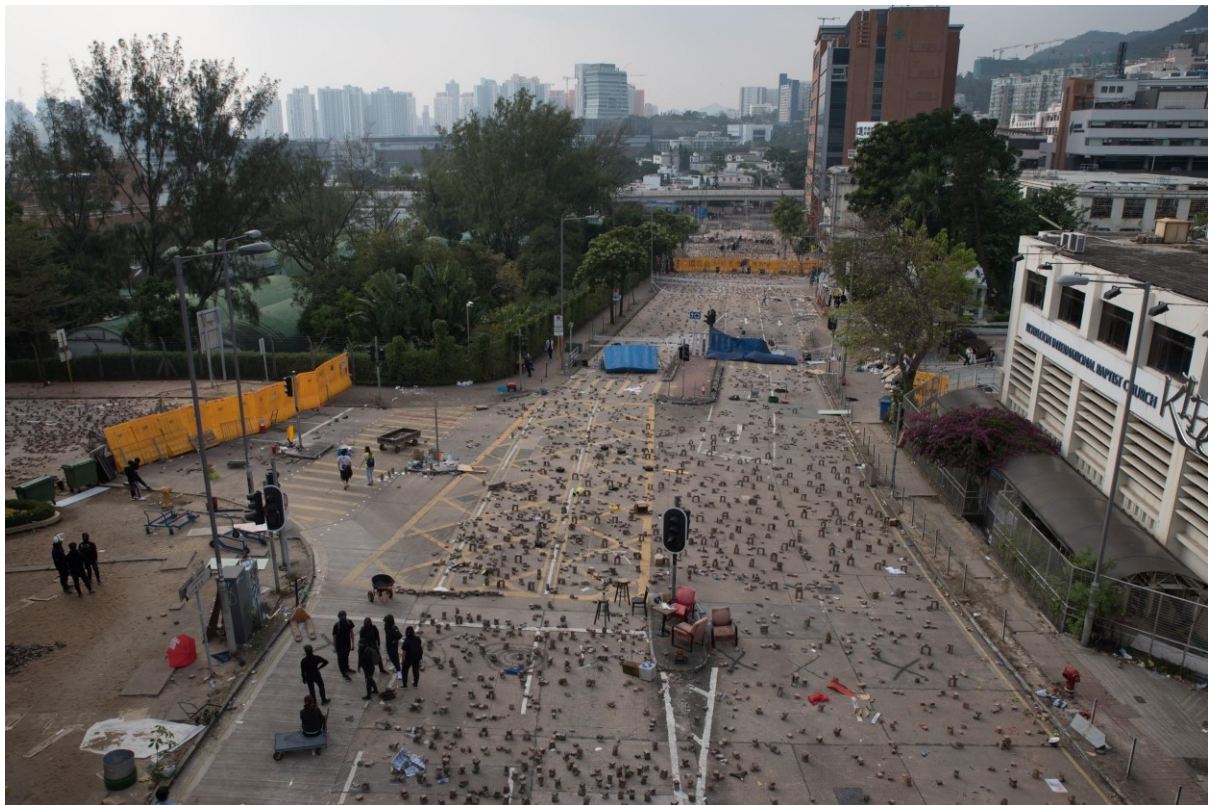
Demonstranti tvoří barikády kolem Hong Kong Baptist University. Protestující blokují hlavní silnice spojující univerzitu s důležitými dopravními uzly. Hongkong, 14. listopadu 2019