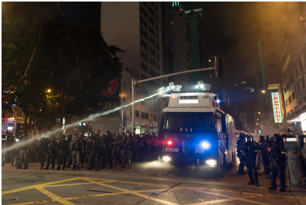
Obr. 7. Policejní složky povolávají proti demonstrantům vodní dělo, které často používá vodu s chemikáliemi. Hongkong 29. září 2019

části policejní skupiny. Lze se tedy domnívat, že byl na scéně před pořízením snímku použit slzný plyn.