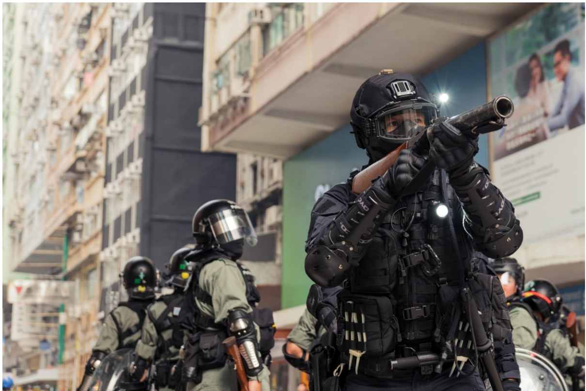
Policisté používají proti demonstrantům slzný plyn. Hong Kong, 29. září 2019