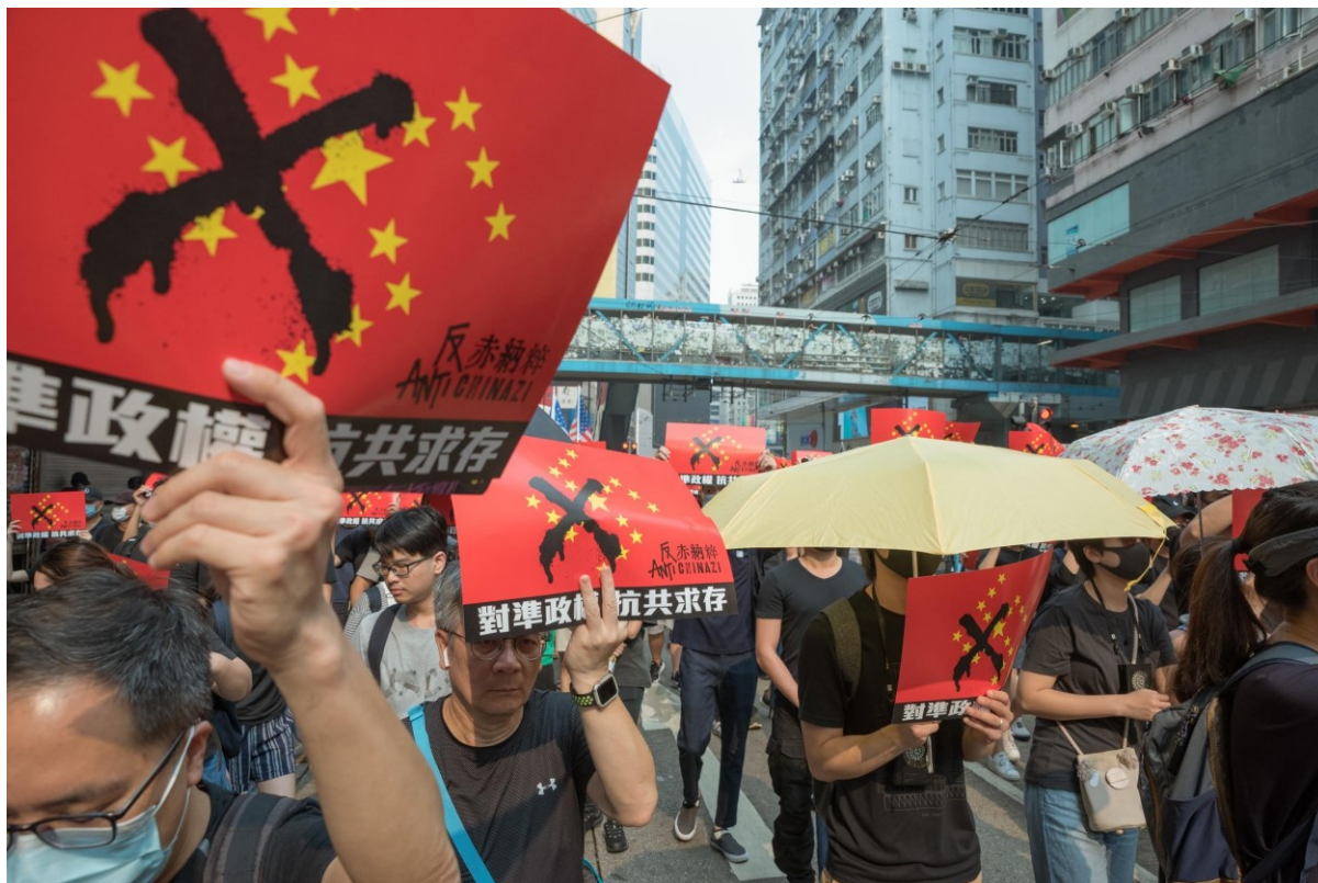
Národní den Čínské lidové republiky Hongkong oslavil protestním pochodem. Hongkong, 1. října 2019