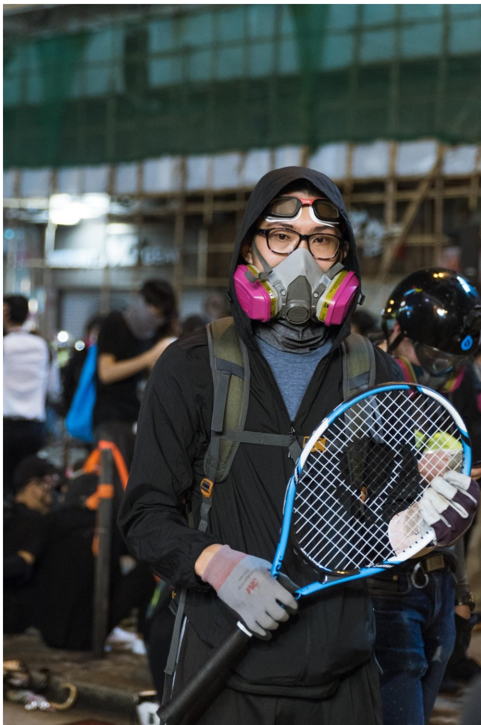
Demonstranti používají různé nástroje k boji s kanytry slzného plynu. Hong Kong, 11. listopadu 2019