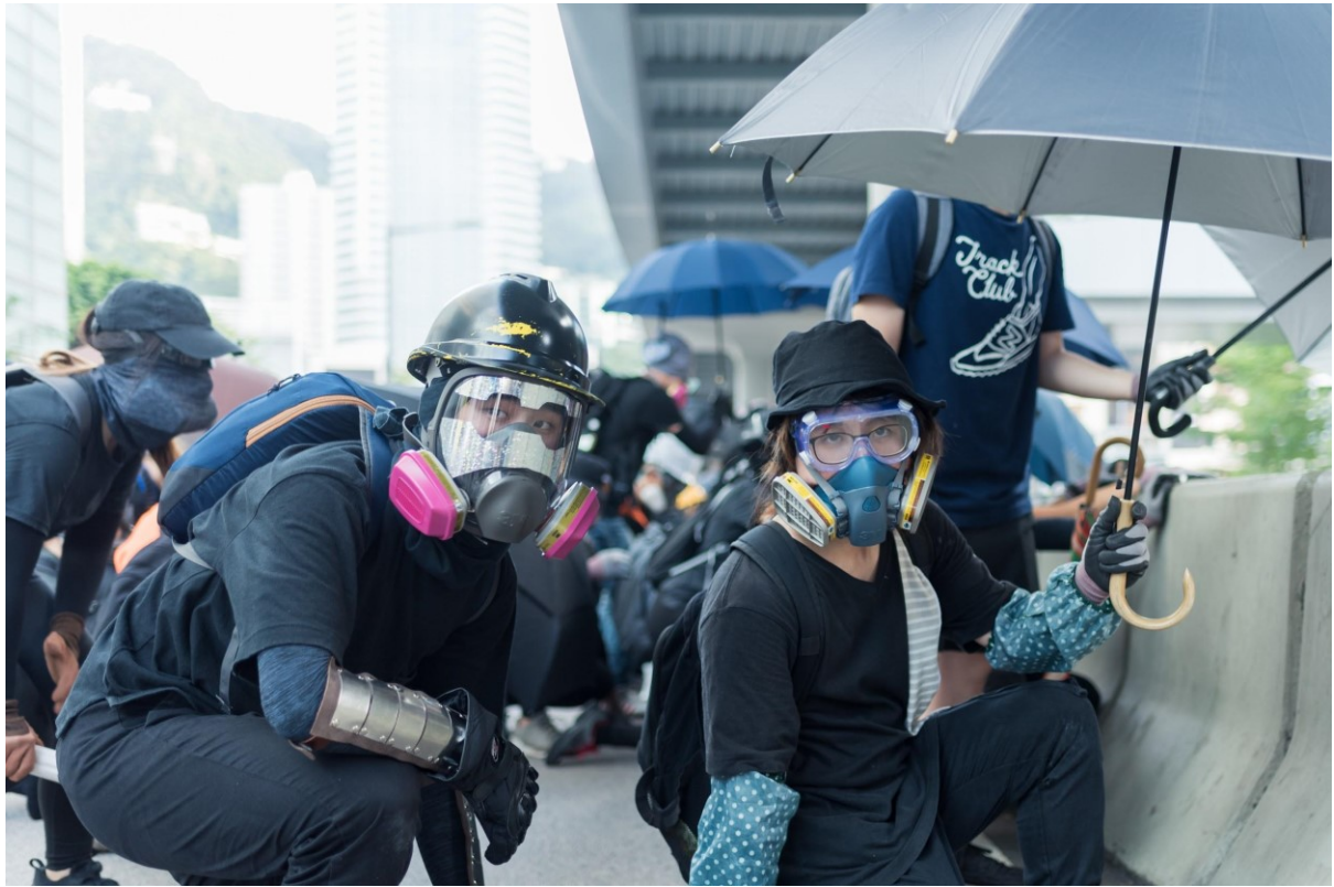
Demonstranti v domácím ochranném vybavení se schovávají za betonovým blokem poblíž vládní budovy blízko Admirality na ostrově Hong Kong. Hongkong, 15. září 2019