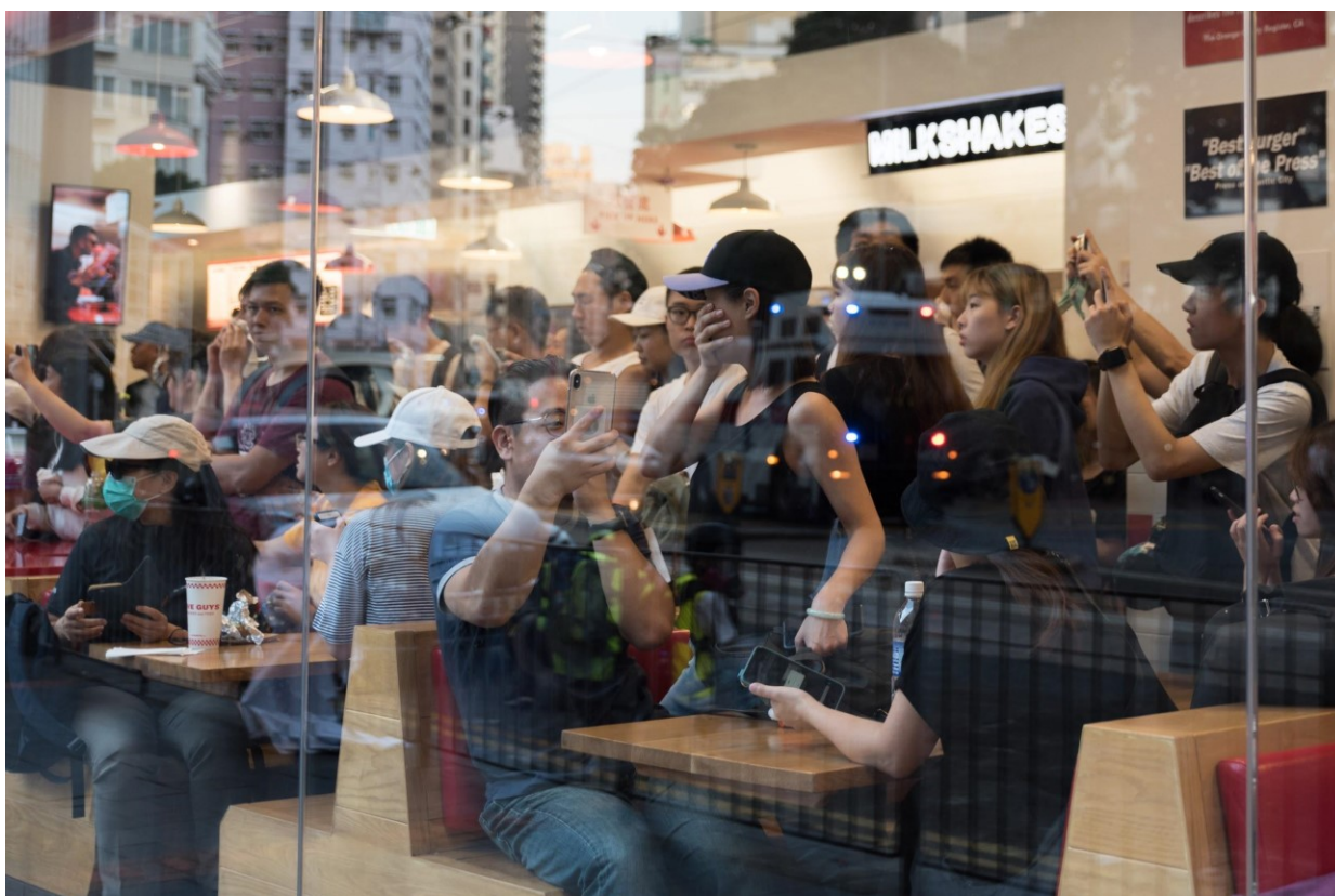
Obr. 9. Návštěvníci restaurace na ostrově Hongkong pozorují zásahy policie proti protestujícím ve Wan Chain. Hongkong 10. listopadu 2019

Prostředí lze snadno popsat jako restaurační zařízení, soudě nejen podle papírového kelímku na stole, ale také nábytku, který připomíná svým vzhledem americké diners. Dalšími vizuálními znaky, které dokládají správnost tohoto tvrzení jsou světelné nápisy na zdi, které se pojí s jídlem - například neonový bílý nápis „milkshakes”.