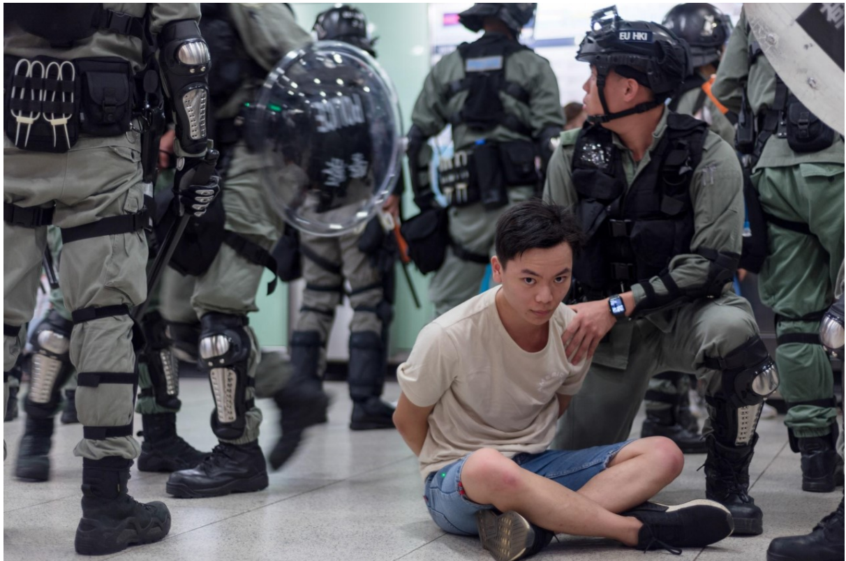
Policie zatýká muže v MTR stanici Central na ostrově Hongkong. V okolí probíhajícího mírového pochodu na velvyslanectví USA policie během odpoledne zadržela několik desítek protestujících. Hongkong, 8. září 2019