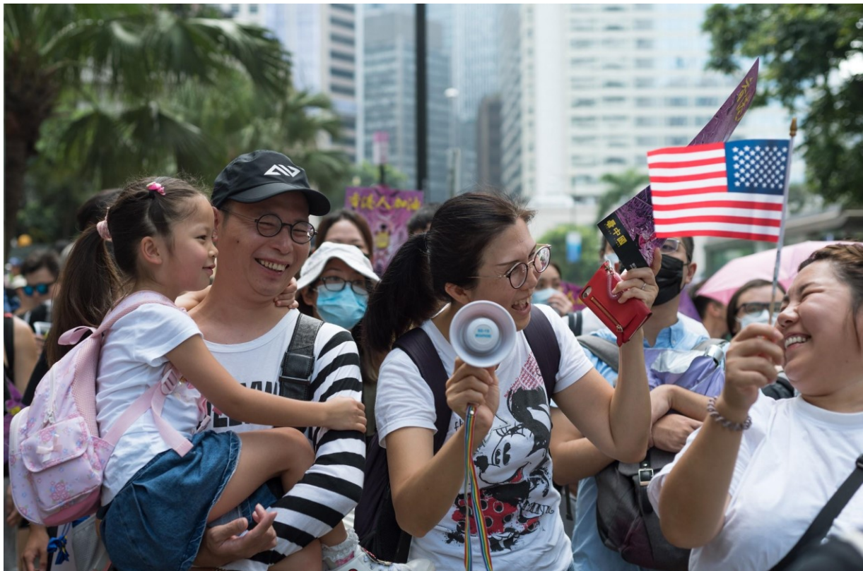
Obr. 3. Hongkončané během pochodu za podporu Hongkongského zákona o lidských právech a demokracii mávají americkými vlajkami. Hongkong, 8. září 2019

Mezi čtyřmi účastníky je tedy možné vypočítat opět narativní proces transakční obousměrné akce. Doložit to jde na vektorech, které jsou na snímku patrné. Ženy se na sebe dívají a smějí se na sebe, zatímco malá dívka je pozoruje. Ženy jsou tedy zároveň aktéry i cíli, zatímco malá dívka, která pozoruje obě ženy, je navíc oboustranně spojena vektory s mužem (nejspíše její otec), který ji nese v náručí a ona ho objímá. Co se týče prostředí, to je opět nerozpoznatelné, nejen, že kvůli hloubce ostroty není snadno čitelné, ale účastníci zabírají mnoho prostoru snímku, takže je odepřen divákovi širší kontext. Na což navazuje otázka modalit, která je poměrně nízká, co se týče perspektivy a pozadí, naopak vyšší modalit je dosaženo v rámci stínů/světla a barevnosti. Účastníci se dívají sami na sebe a divák je v tomto ohledu spíše jako pozorovatel, jedná se tedy o kontakt nabídky. Divák vidí osoby z profilu, nikoli zpřímá, což vytváří to do jisté míry odstup, ale zároveň zobrazení v úrovni očí vytváří symbolickou rovnost, dále jsou osoby vyfotografované do úrovně pasu, což podle definované metody vytváří společenský vztah mezi divákem a účastníky. Tedy celkové zapojení diváka je