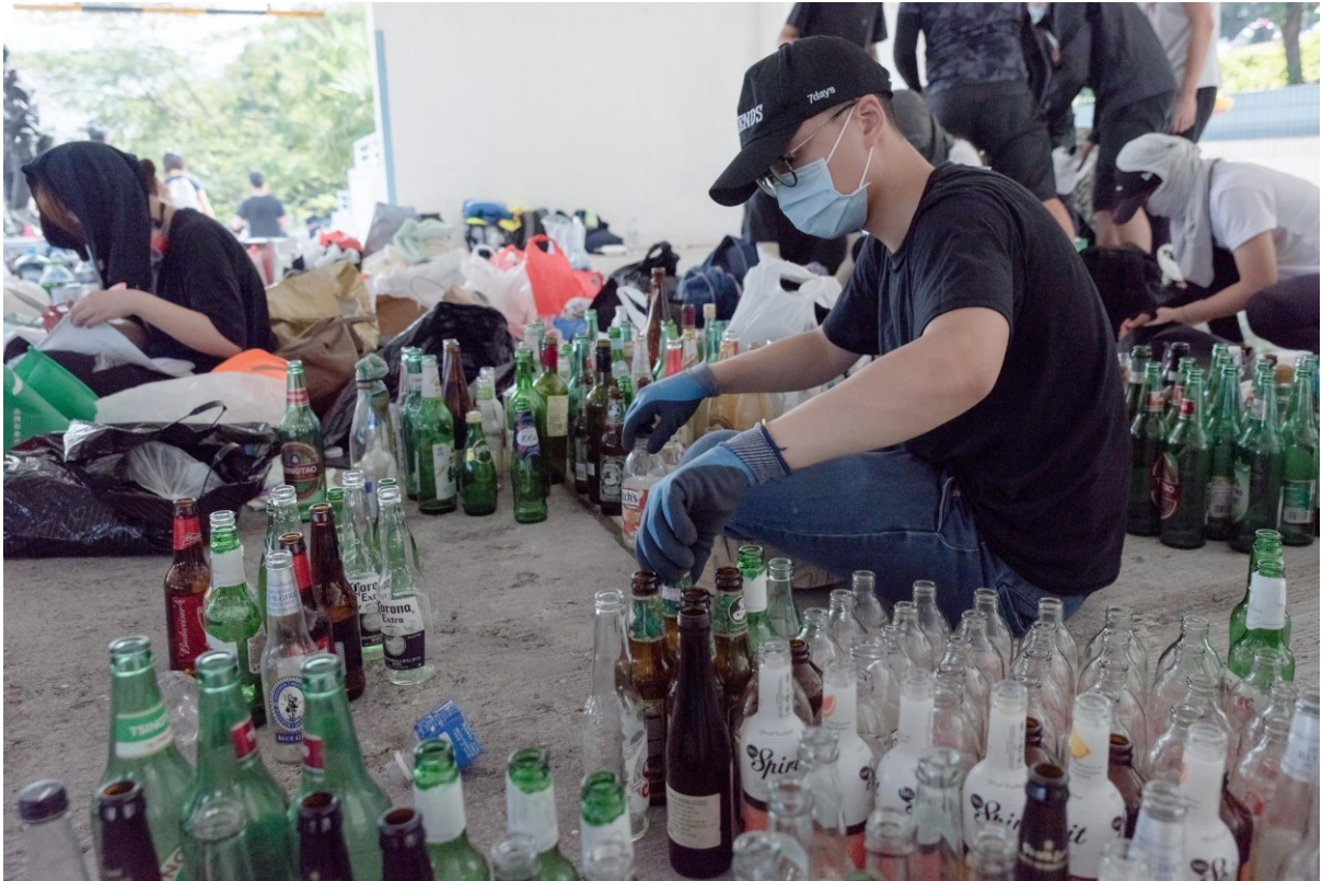
Jeden z protestujících na kampusu Chinese University of Hong Kong třídí skleněné lahve, které další používají na tvorbu Molotovových koktejlů.. Hong Kong, 13. listopadu 2019