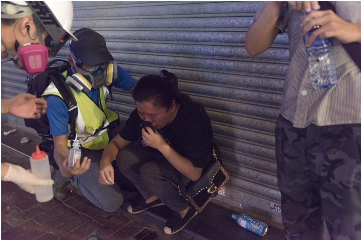
Dobrovolní zdravotníci pomáhají ženě zasažené slzným plynem v ulicích Mongkoku. Hongkong, 11. listopadu