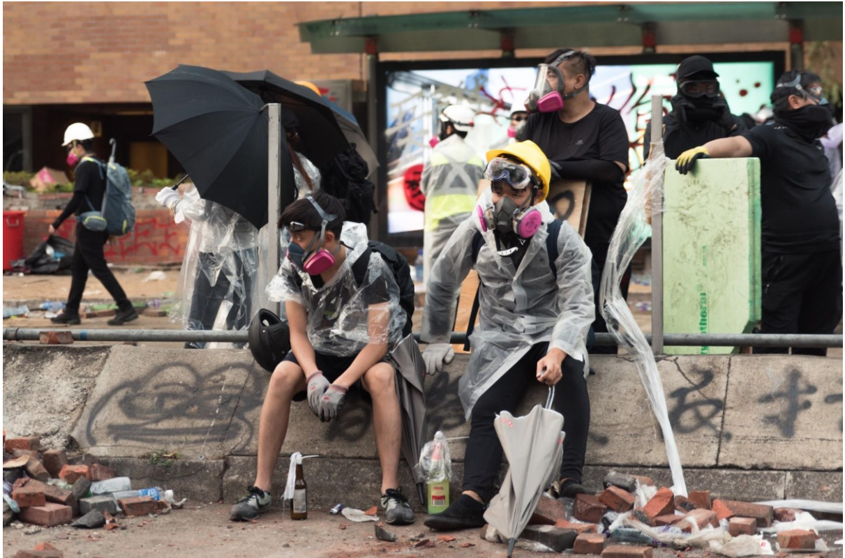
Vyčerpaní studenti odpočívají na kampusu univerzity Poly U, kde dochází k neustálým střetům s policií. Hongkong, 17. listopadu 2019