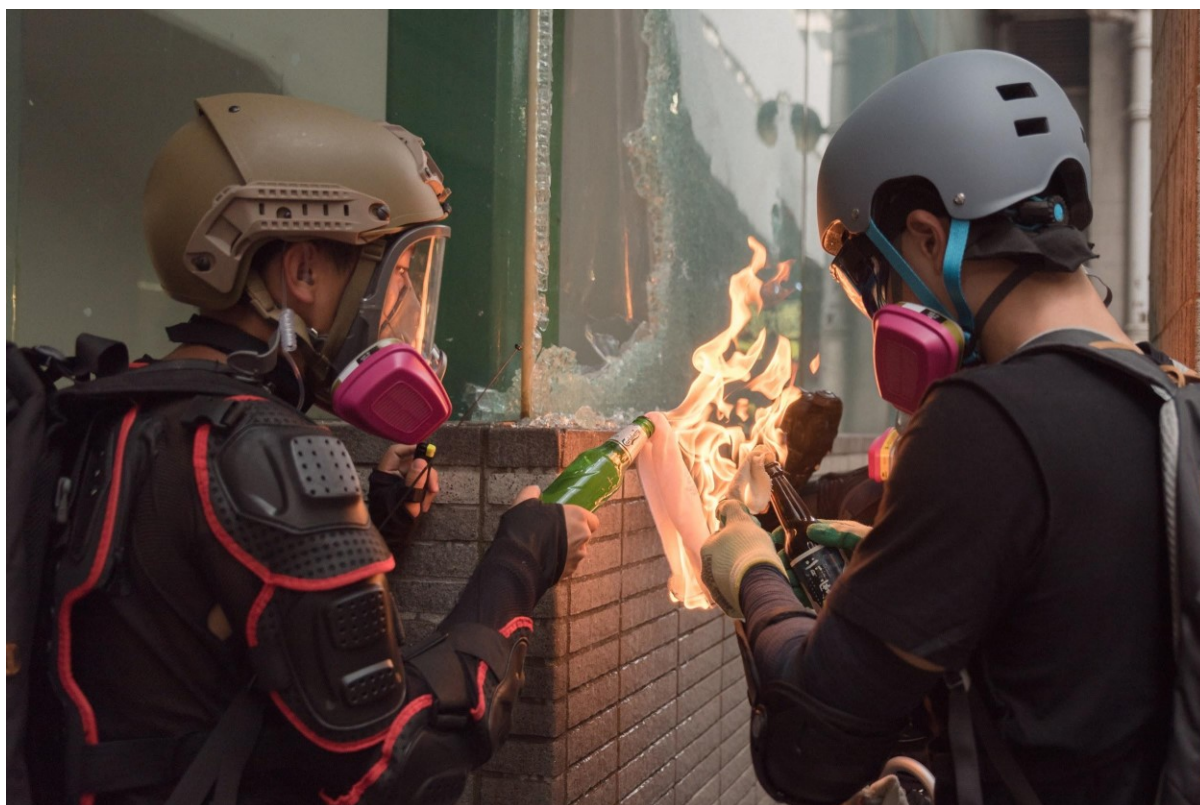
Obr. 4. Dva mladí protestující zapalují molotovы, které používají k útoku při střetu s policií. Hong Kong, 29. září 2019

Sociální vzdálenost je definovaná zobrazením účastníku do úrovně pasu, který nastoluje společenský vztah, avšak jejich odvrácený pohled, kdy divák vidí aktéry z profilu, způsobuje pocit odstupů. Použitý úhel je však znovu v úrovni očí, takže divák může mít symbolický pocit rovnosti. Tato kombinace odstupů a nabídky může u diváka vyvolat představu, že pohlíží na něco, co mu mělo zůstat skryto, přece jen se jedná o akt určitého, i když neaktivního, symbolu násilí - oheň. Výraznost účastníků je v tomto případně maximální, protože v obraze není nic, co by diváka od představované akce rozptýlilo, navíc oheň na fotografii působí dominantně. Kompozičně lze mluvit o pravidle třetin, protože oba chlapci jsou ve skoro stejné pozici na okrajích snímku, jsou tedy decentralizovaní. Dále lze snímek definovat jako endocentrický a inerativní dělicí, což je následně charakterizováno jako ladící čelní vyobrazení. V neposlední řadě jsou emoce v tomto případě spíše neutrální, zejména proto, že divák nemůže vidět přímo výrazy účastníků kvůli výzbroji, ale z očí jednoho z nich lze vyčíst velkou míru soustředěnosti.