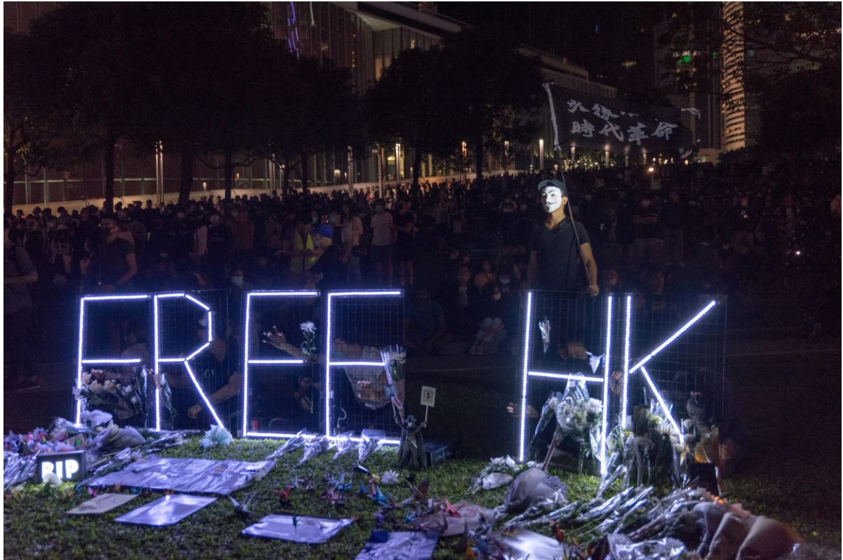
Lidé přinášejí do parku poblíž Admiralty květiny a drobné origami k uctění památky 22 letého studenta. Hongkong, 9. listopadu 2019