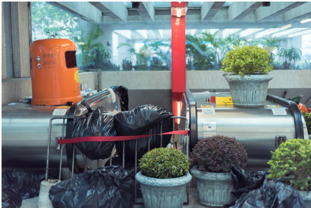
Protestující zabarikádovали vstup do MTR během protestů na ostrově Hongkong. Hongkong, 8. září 2019