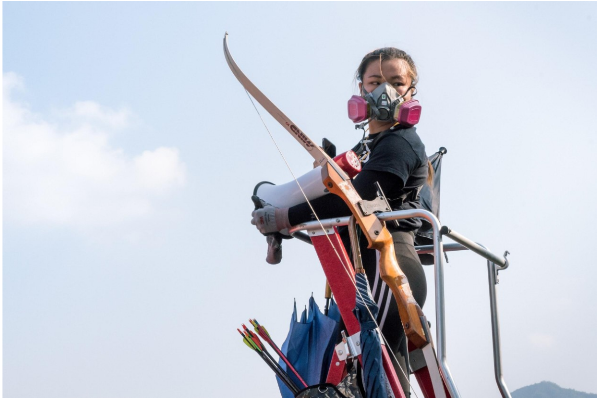
Dívka hlídá most vedoucí ke kampusu Chinese University of Hong Kong, který se den předtím změnil v bojiště mezi protestujícími a policií. Hong Kong, 13. listopadu 2019