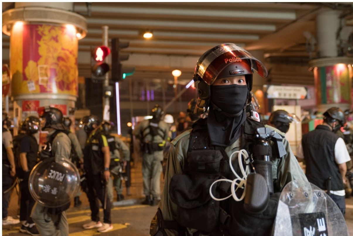
Policista hlídkuje v nočných hodinách v Mongkoku. Hongkong, 27. říjen 2019