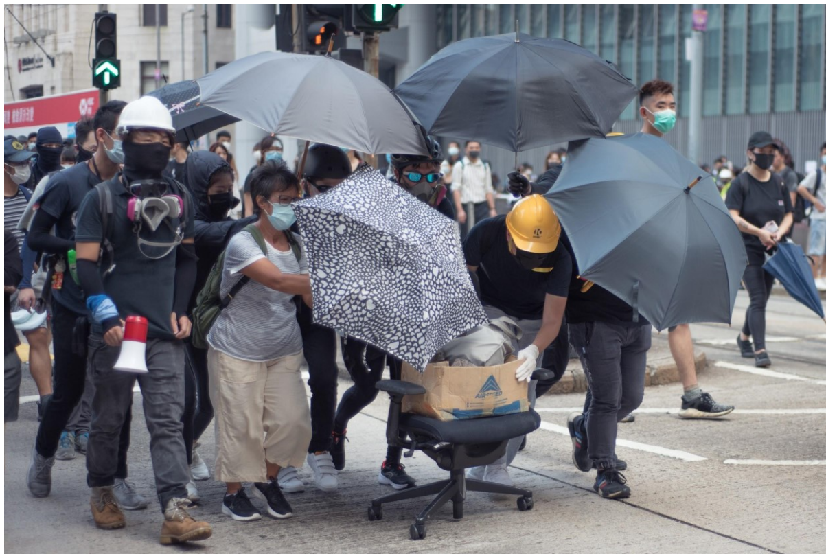
Skupina demonstrantů převáží krabici s cihlami pomocí kancelářské židle. Cihly jsou během protestů používány především k zablokování pozemních komunikací. Hongkong, 8. září 2019