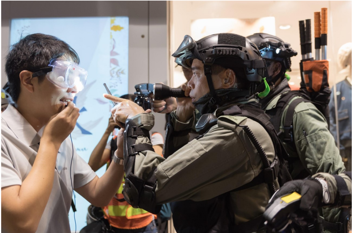
Protestující se hádá s policií během večerních protestů v Mongkoku. Hongkong, 10. listopadu 2019