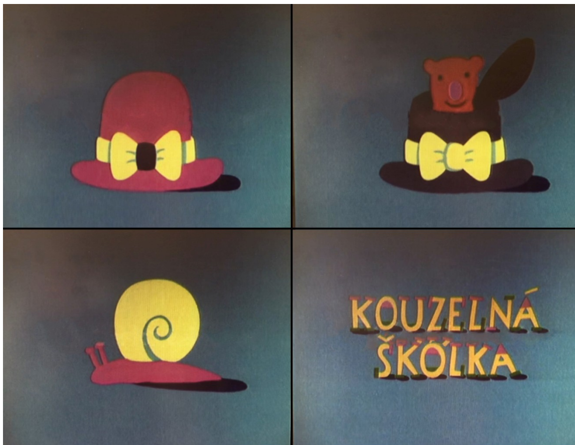
Příloha č. 2: Grafika ke znělce, verze III. (obrázek)