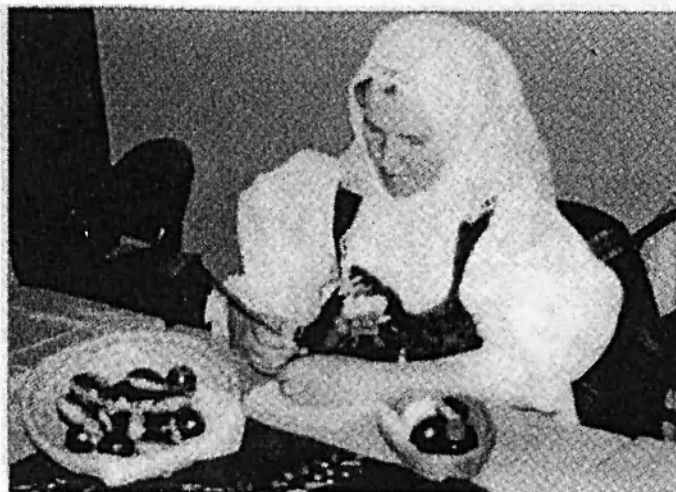
Obr. č. 10