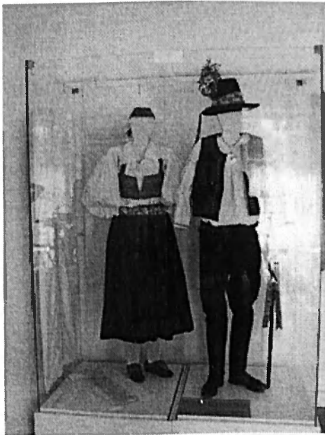
Obr. č. 6