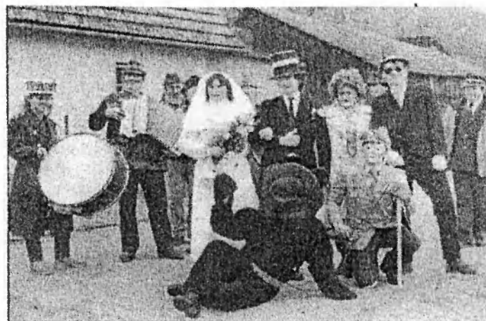
Obr. č. 18