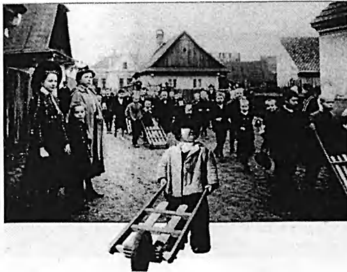
Obr. č. 8