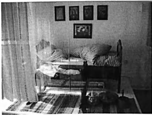
Obr. č. 4