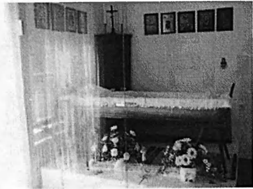
Obr. č. 5