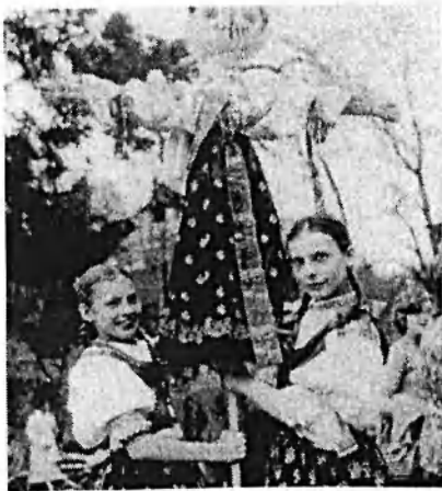
Obr. č. 11