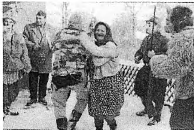
Obr. č. 17