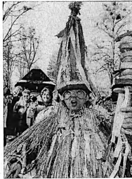
Obr. č. 16