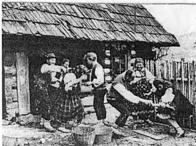
Obr. č. 9