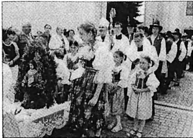
Obr. č. 13