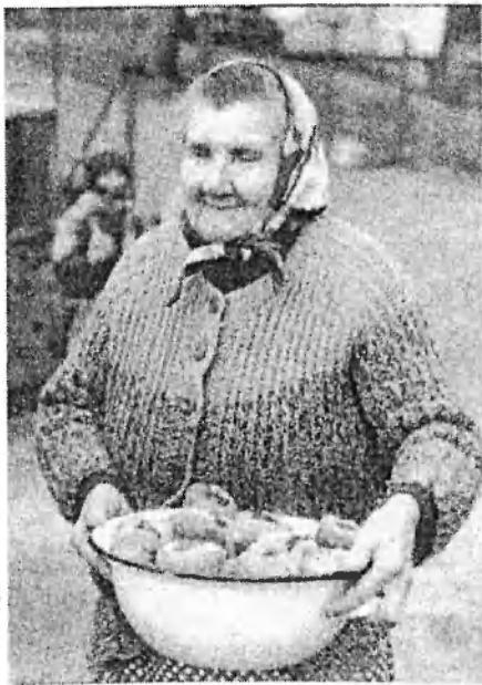
Obr. č. 15