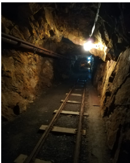
Štola č. 1 72