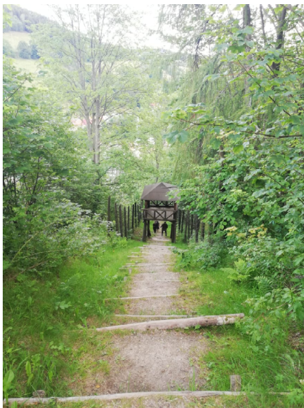
Mauthausenské schody 70