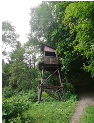
strážní věž, tzv. „špačkárna“ 79