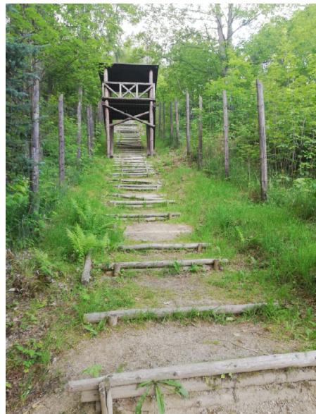
Mauthausenské schody 71