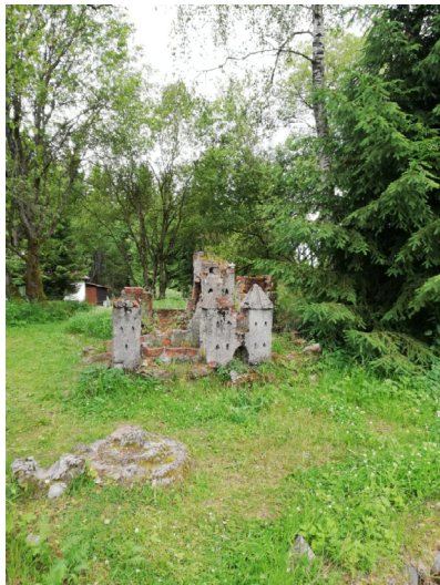
tzv. „Palečkův hrad“ 78