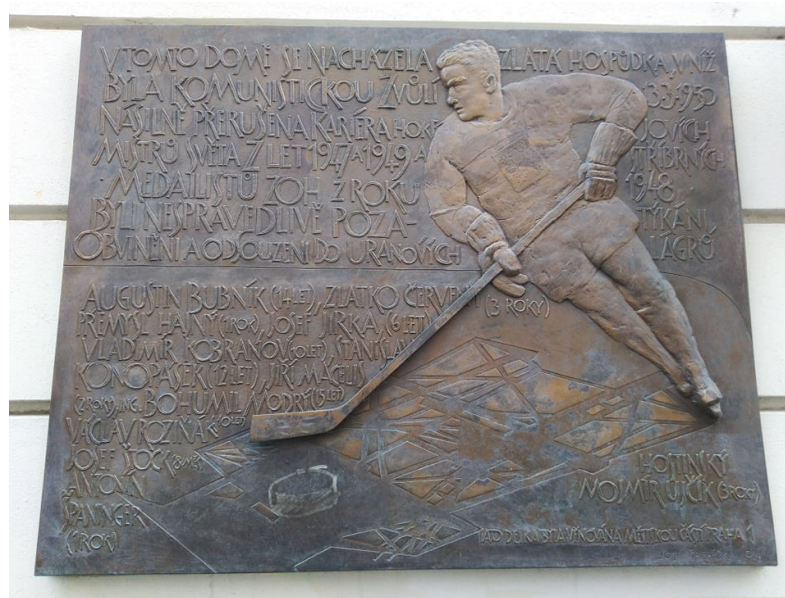
Pamětní deska na domě, kde se nacházela Zlatá hospůdka 40