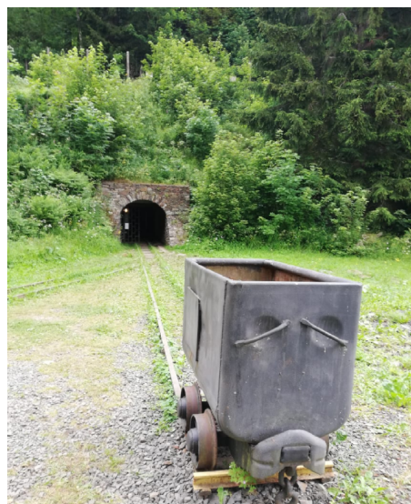
Vstup do štoly 73