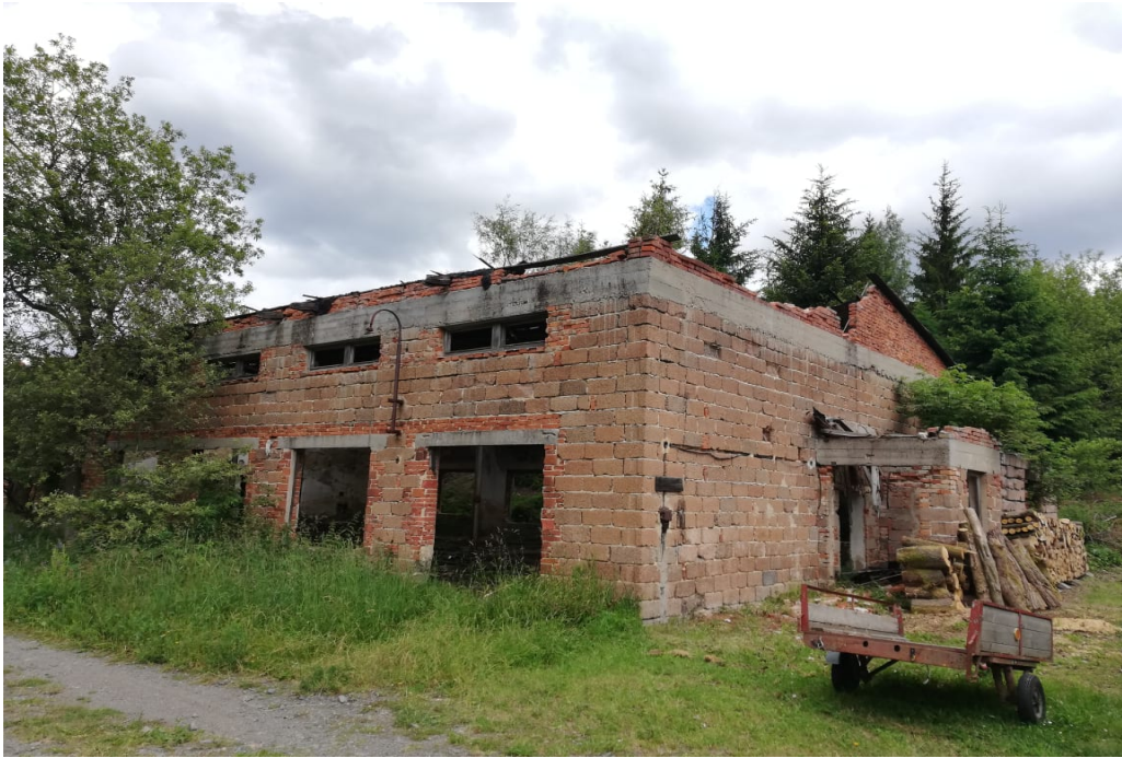
řetízková převlékárna 77