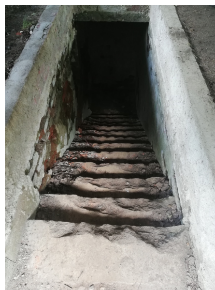
Schody do korekce 76