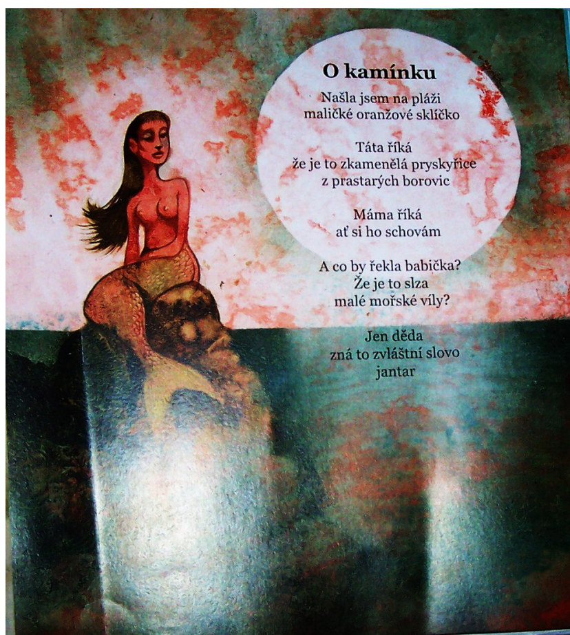
Moře slané vody, báseň O kamínku

2. O kamínku : „Našla jsem na pláži / maličké oranžové sklíčko // Táta říká / že je to zkamenělá pryskyřice / z prastarých borovic // Máma říká / ať si ho schovám // A co by řekla babička? / Že je to slza / malé mořské víly? // Jen děda / zná to zvláštní slovo / jantar“ (nečíslováno).