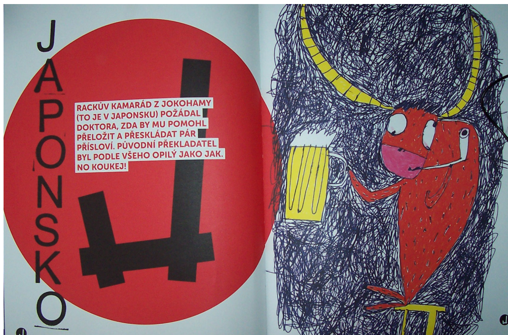
Doktor Racek aneb Cesta kolem světa za 31 písmen

„Hledat jelena v kupce jehel / To jsem z toho javor! / Jasnovidec, který jódluje, nekouše. / Je to šité horkým ježkem.“