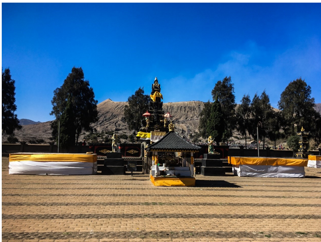
Obrázek 14: Hinduistický chrám pod sopkou Bromo, hlavní prostor chrámu; foto Markéta Losová 2018