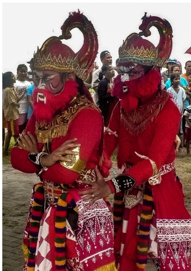
Obrázek 4: Pouliční vystoupení Rámájany; foto Markéta Losová 2012