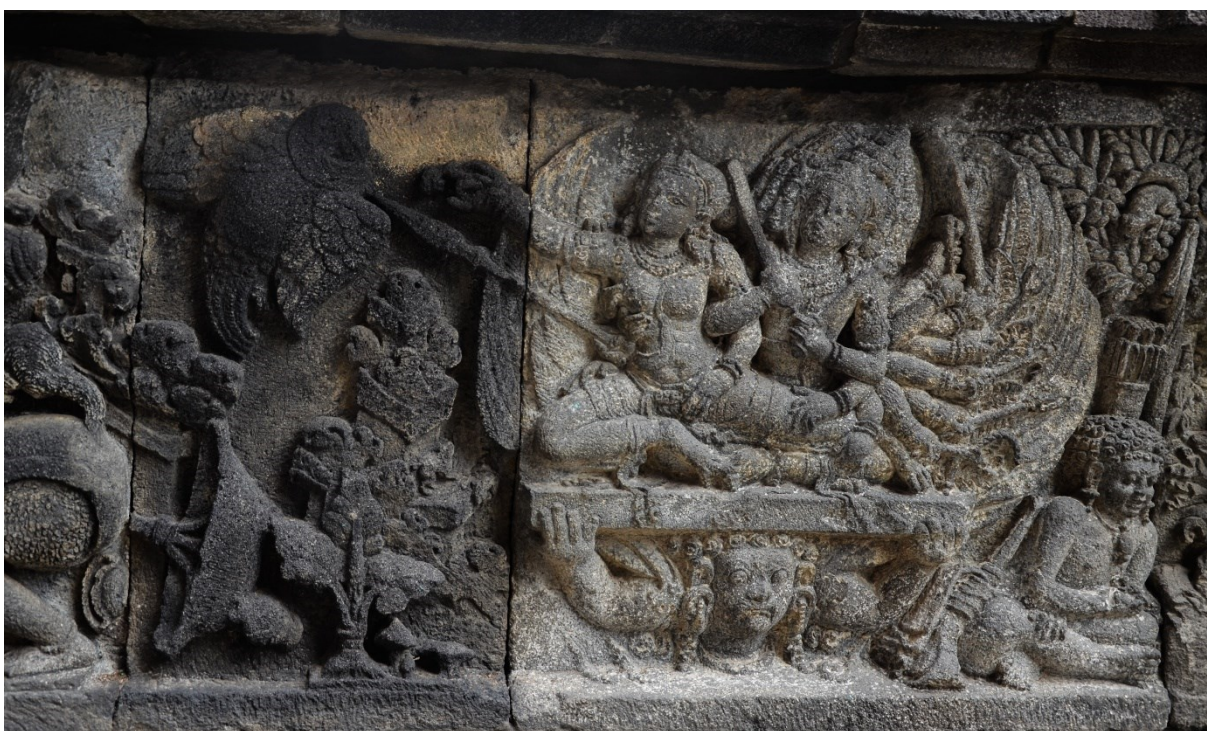
Obrázek 10: Reliéf z Šivova chrámu (komplex Lara Jonggrang), výjev z Rámájany, boj Rávany a mýtického ptáka Džatáju; foto Markéta Losová 2016