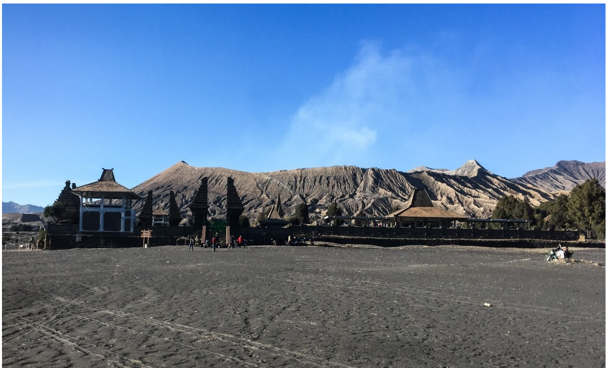
Obrázek 12: Hinduistický chrám Tenggerů pod sopkou Bromo (v pozadí); foto Markéta Losová 2018