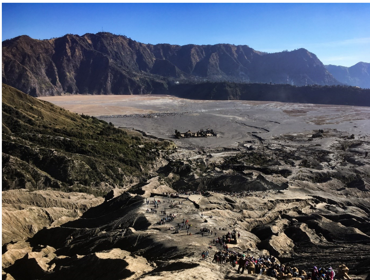
Obrázek 15: Pohled na chrám v sopečné pánvi z vrcholu sopky Bromo