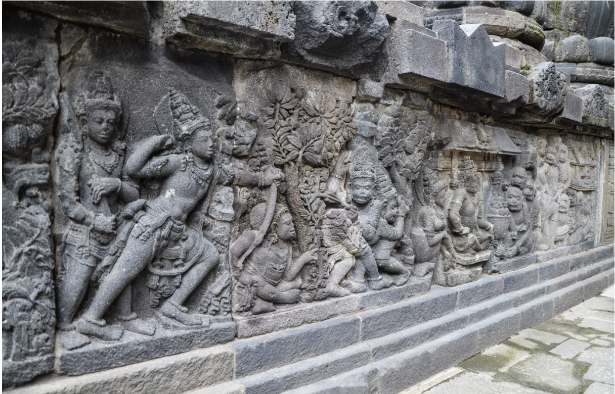
Obrázek 11: Reliéf z Šivova chrámu (komplex Lara Jonggrang), výjev z Rámájany, Ráma bojuje po boku krále opic Surgívvy