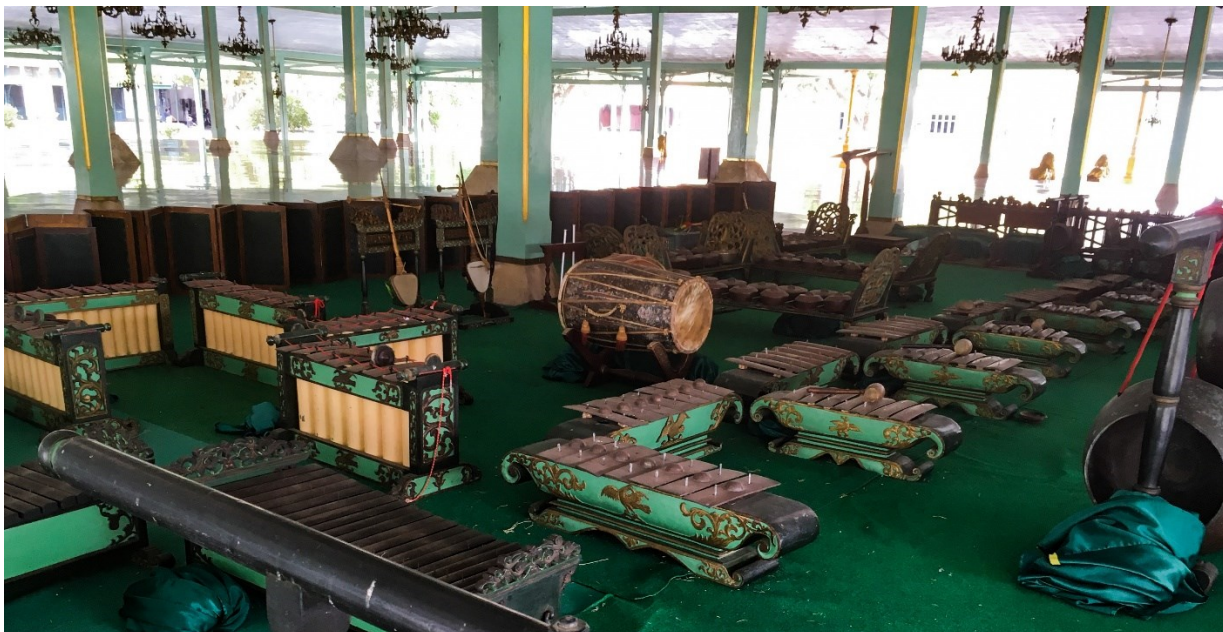
Obrázek 5: Gamelan v paláci Mangkunegaran (Surakarta), uprostřed buben kendhang gendhing ; foto Markéta Losová 2019