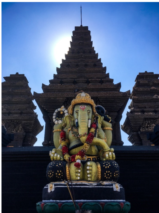
Obrázek 13: Hinduistický chrám pod sopkou Bromo, socha boha Ganéši; foto Markéta Losová 2018