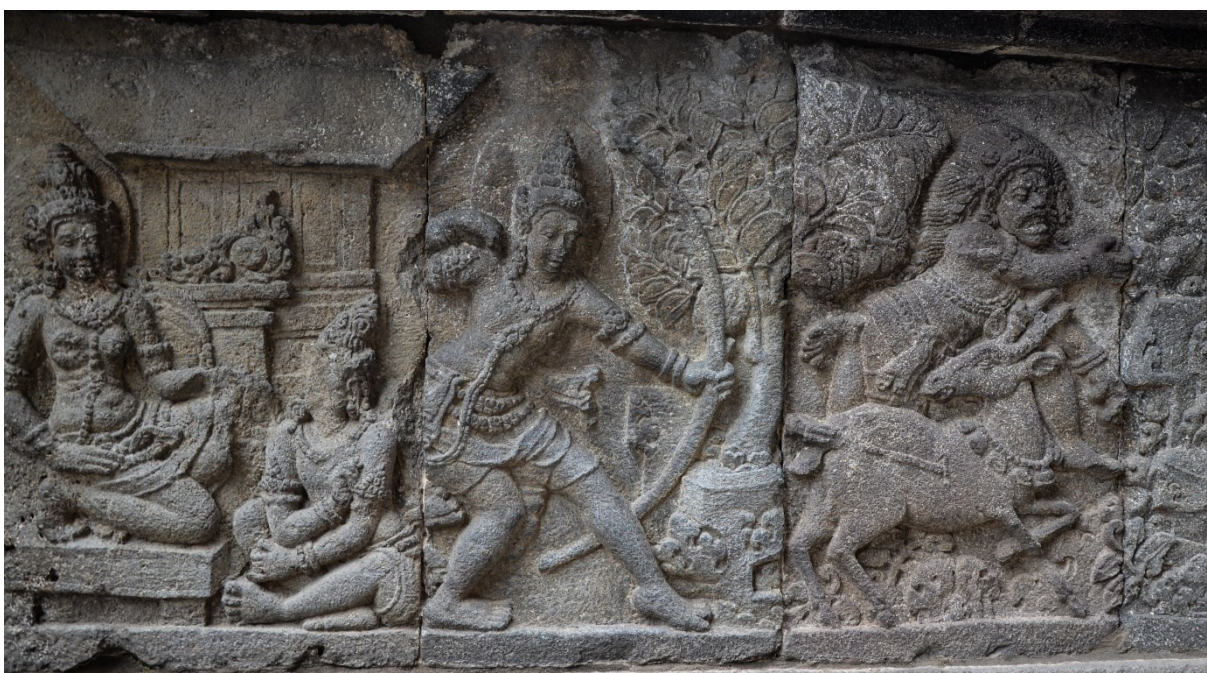
Obrázek 8: Reliéf z chrámového komplexu Lara Jonggrang, Šivův chrám - výjev z Rámájany – Ráma loví zlatou laň pro Sítu, kterou hlídá Lakšmana; foto Markéta Losová 2011