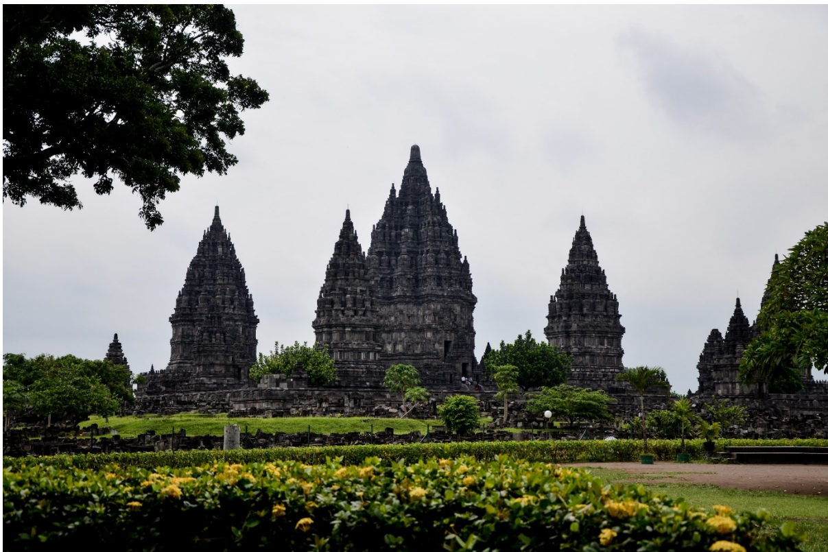
Obrázek 7: Chrámový komplex Lara Jonggrang, Prambanan; foto Markéta Losová 2011