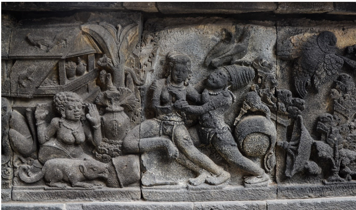
Obrázek 9: Reliéf z Šivova chrámu (komplex Lara Jonggrang), výjev z Rámájany, detail únosu Sítý démonem Rávanou