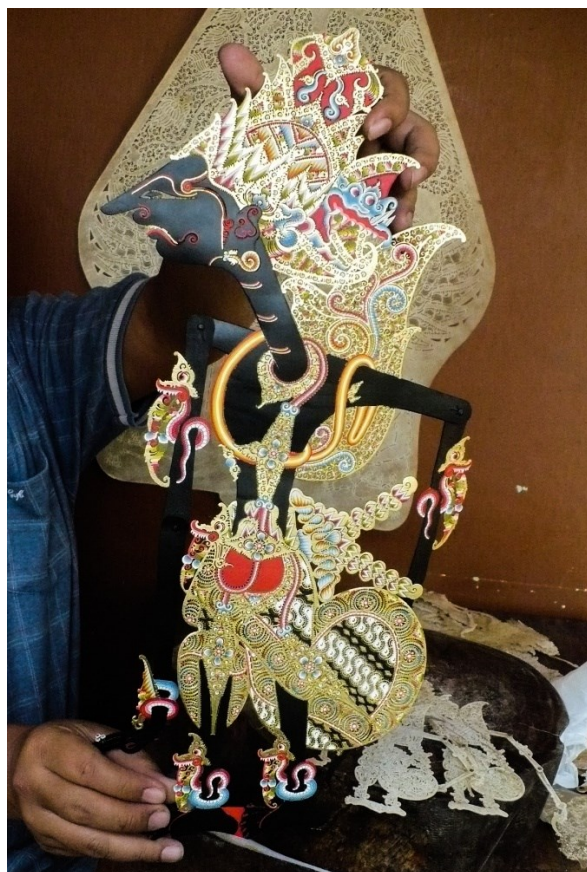
Obrázek 2: Malovaná wayangová loutka