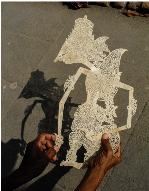
Obrázek 1: Wayangová loutka