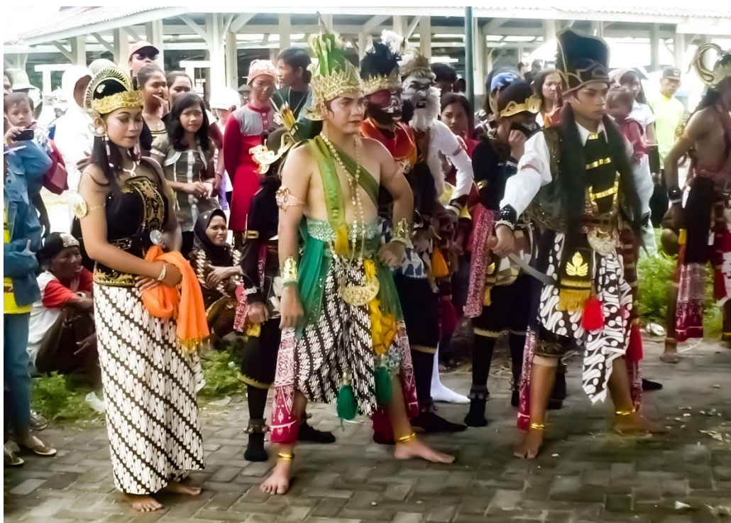
Obrázek 3: Pouliční vystoupení Rámájany; foto Markéta Losová 2012