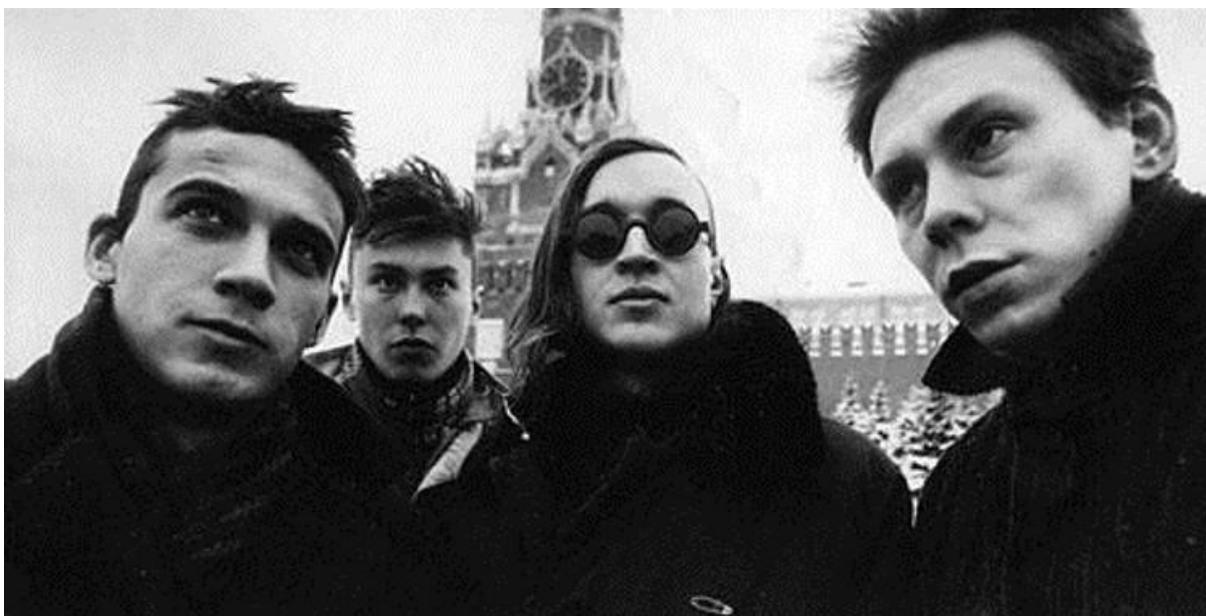
Příloha 12 – Jegor Letov (druhý zprava) a sestava skupiny Graždanskaja oborona z období novosibirských festivalů (1987-1988) na Rudém náměstí v Moskvě