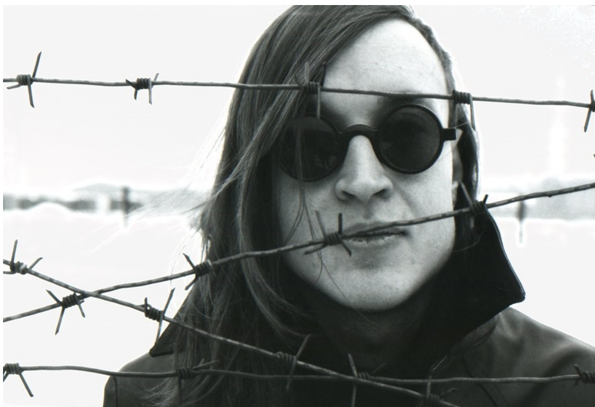
Příloha 9 – ikonická fotografie Letova z roku 1988