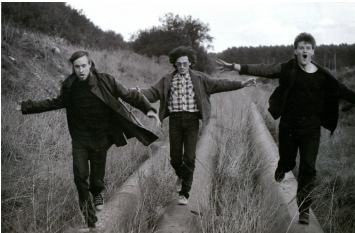
Příloha 11 – zleva Jegor Letov, Konstantin Rjabinov a Oleg Sudakov, fotografie z roku 1989