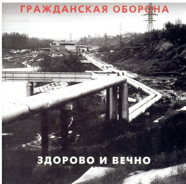
Пříloha 6 – obal alba Zdorovo i večno