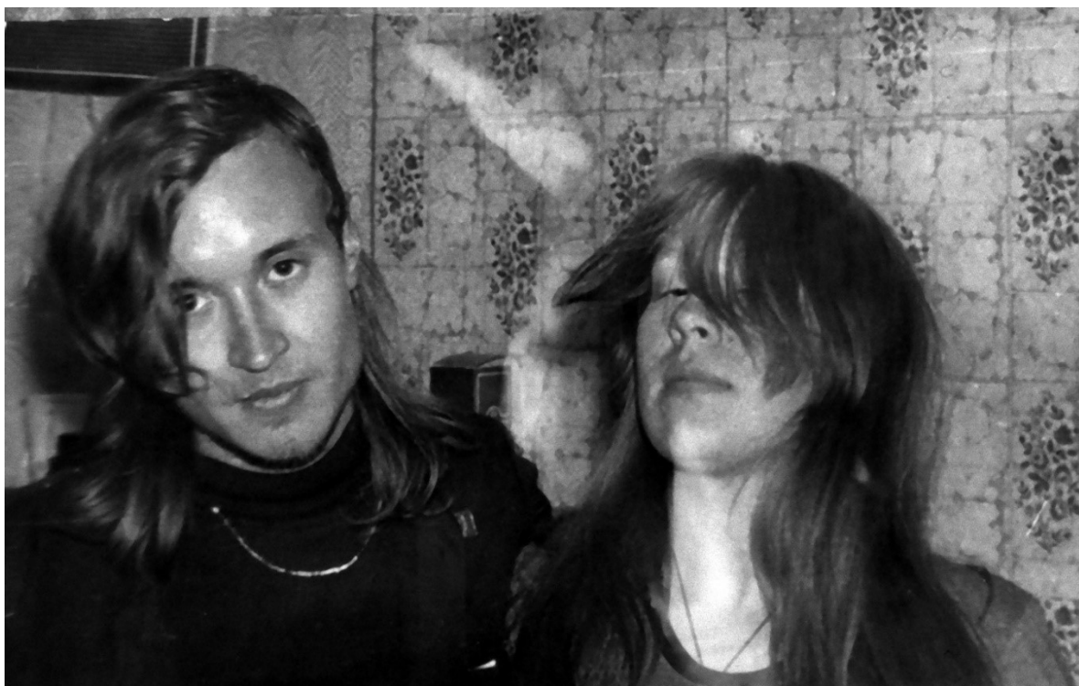
Příloha 10 – Jegor Letov a Janka Ďagileva, fotografie z roku 1988