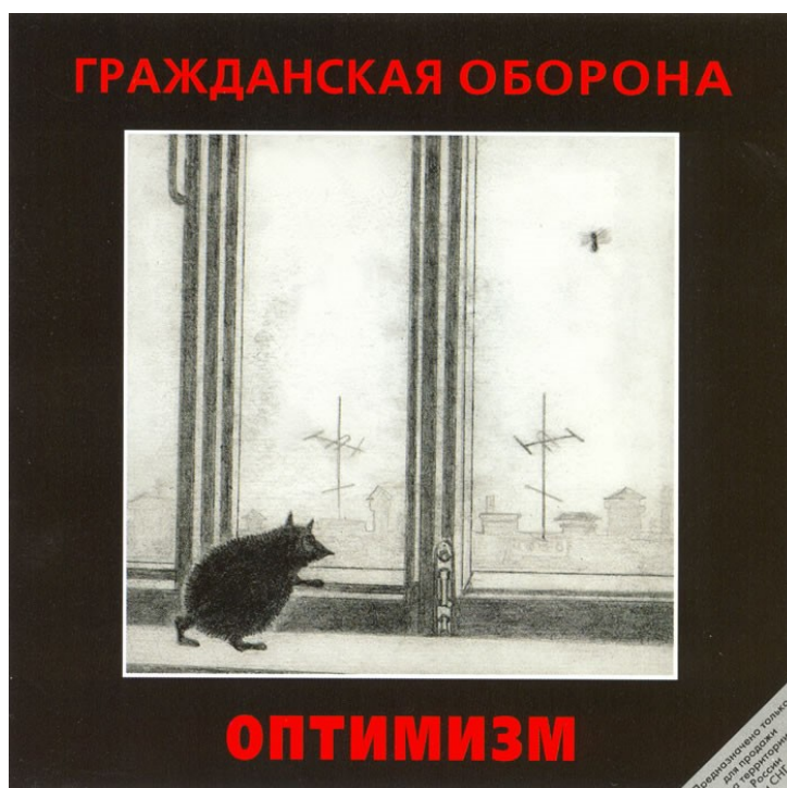
Пříloha 2 – obal alba Optimizm