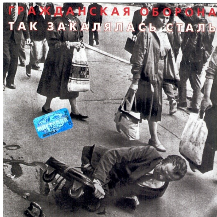
Пříloha 3 – obal 1. vydání alba Tak zakaljalas stal