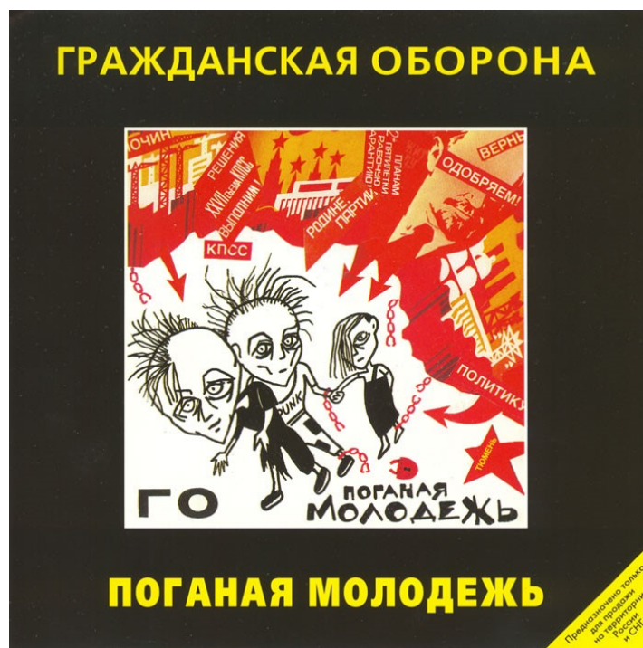
Пříloha 1 – obal alba Poganaja moloděž