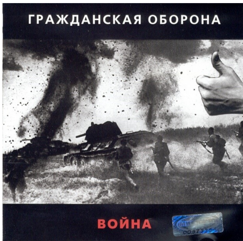
Пříloha 5 – obal alba Vojna