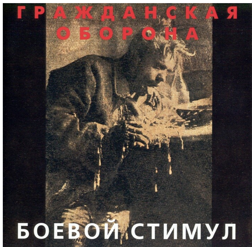
Пříloha 7 – obal alba Bojevoj stimul