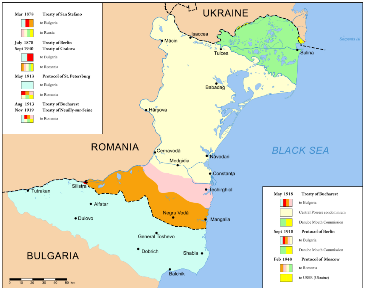
Příloha č. 2: Územní změny v Dobrudži od roku 1878.