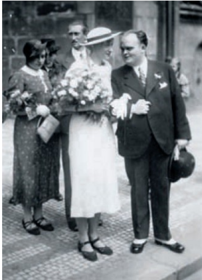
Obr. 5 a 6