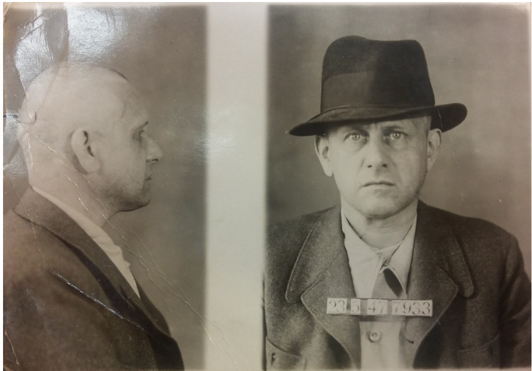
Obr. 23 a 24