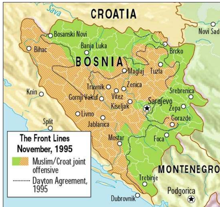
Příloha č.4: Stav sil v Bosně a Hercegovině v listopadu 1995 a daytonská dohoda.

bosenských Srbů měl zastupovat Milošević. Bosenskosrbští zástupci však do jednání nemohli zasahovat. Holbrook představil návrh mírového plánu znepráteleným stranám jako ultimátum. Milošević, Tudjman a Izetbegović neměli v Daytonu prostor ke kličkování a 21. listopadu více či méně z donucení dohodu přijali. 160 Paradoxním výsledkem angažmá mezinárodního společenství bylo, že garanty míru se stali Milošević a Tudjman, kteří sami nesli velký díl odpovědnosti za rozpoutání celého konfliktu. 161