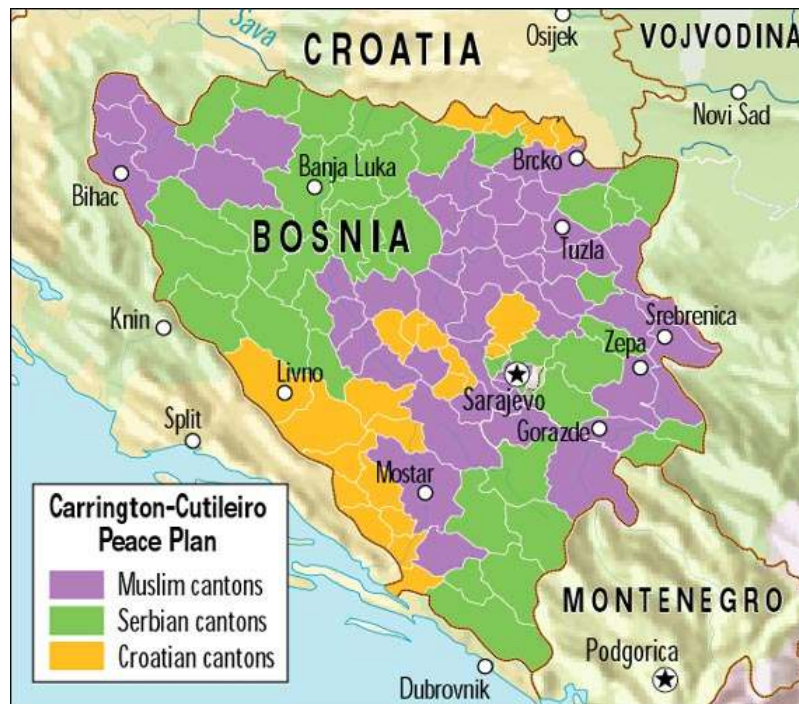
Příloha č.1: Mapa etnicky vymezených kantonů podle Cutileirova plánu z února 1992.

Základem navrhovaného řešení bylo zachování Bosny ve stávajících hranicích a její vnitřní reorganizace na etnicky definované kantony. První verzi dohody z února 1992 odmítla muslimská SDA, březnovou verzi zamítla srbská SDS. 74 Poslední pokus nalézt řešení ještě před uznáním Bosny se uskutečnil v polovině března v Sarajevu. Návrh ES, tzv. Cutileirův plán, spočíval v rozdělení Bosny na tři etnicky definované kantony, které měly mít značnou míru samosprávy. 75 Detaily plánu, například fungování armády a policie, však byly nejasné.