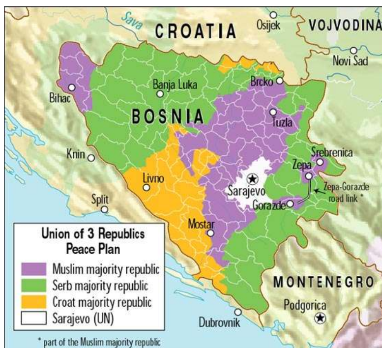
Příloha č.3: Návrh plánu Owen-Stoltenberg ze září 1993.

Plán Owen-Stoltenberg byl v podstatě návratem ke Cutileirově návrhu a stejně jako on zkrachoval na přesném teritoriálním vymezení jednotek. Plán tentokrát odmítli Muslimové, protože by jeho přijetí znamenalo faktické uznání „etnického vyhnání“ z ostatních částí Bosny a Hercegoviny. Na konci roku 1993 byl plán modifikován tak, že muslimské části bylo připsáno o 3 % více území. Ani poté ale neuspěl. 137