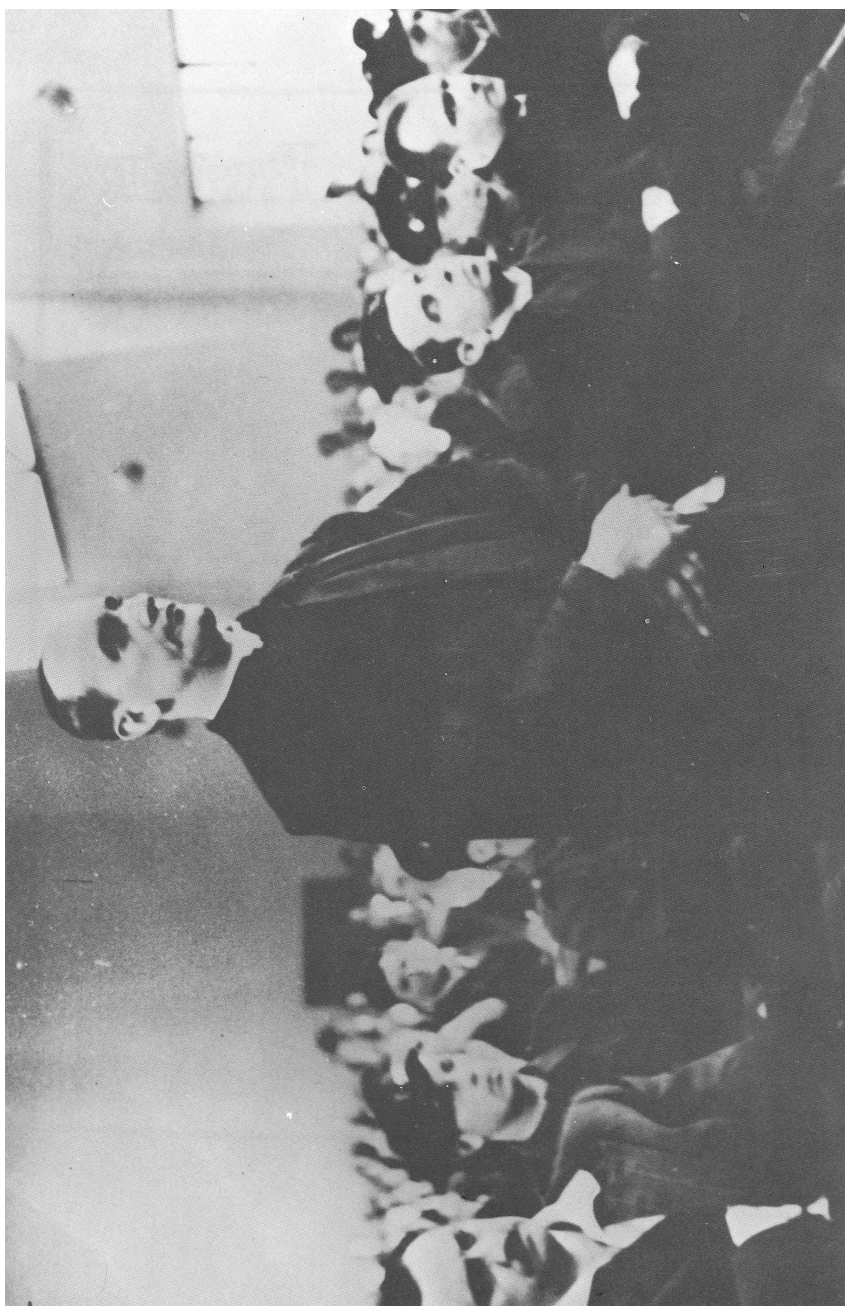
Stepinac před soudem