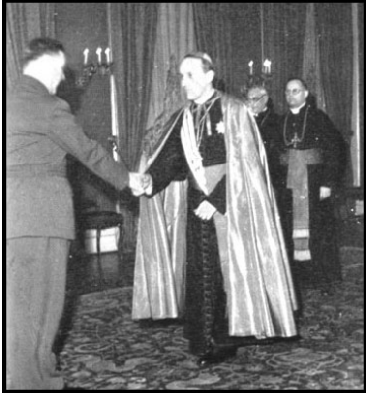
Stepinac a Pavelić při příležitosti oslavy vzniku NDH v roce 1945

Zdroj: Dedijer, Vladimir. Jasenovac – das jugoslawische Auschwitz und der Vatikan. Freiburg: Ahriman-Verl., 1989.