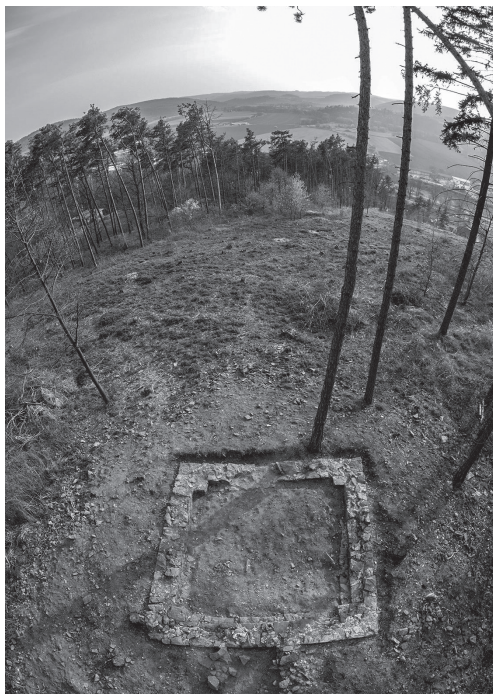
OBR. 3. Tišnov — šibenice. Odkrytý půdorys šibenice (© Miloš Sysel a Václav Kappel).

posledních letech odkryty pozůstatky dvou šibenic studňového typu, postavených na čtvercovém půdorysu s větším množstvím lidských kostí v interiéru. V tišnovské šibenici ležely kosti v neanatomické podobě ve vrstvě nad dnem [Obr. 3] . Naproti tomu u slavkovské šibenice byly ve dně vyhloubeny mělké jámy s neanatomicky uloženými pozůstatky včetně skrumáže lebek [Obr. 1, 4] . Obě šibenice byly postaveny na výrazném místě sledovatelném z důležité komunikace. 15