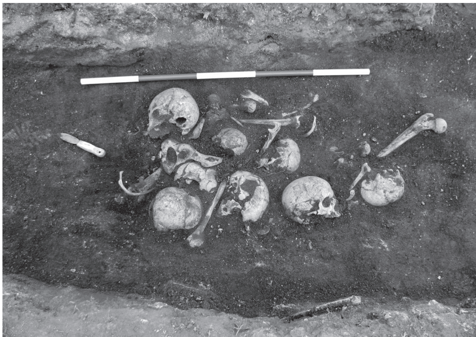
OBR. 1. Slavkov — šibenice. Skrumáž lidských kostí v jámě zahloubené do dna šibenice.

jich do šibenice“. 6 Při té příležitosti se do šibenice mohly dostat i kosti zvířecí. Jindy tělo delikventa ještě před rozpadem odřizli a ponechali buď přímo v šibenici, nebo jednoduše zakopali v blízkém okolí, pro což archeologické výzkumy poskytly celou řadu dokladů. 7 Znáám je i případ, kdy v blízkosti popraviště stál kříž, u něhož se našly pozůstatky popravených. 8 Jindy byla v blízkosti šibenice vykopána větší jáma, do níž byly pozůstatky popravených deponovány. 9 Hromadný hrob byl náhodně objeven roku 1935 v místech, kde stávala šibenice u Velkého Meziříčí. Jednalo se o jámu o rozměrech 2 × 0,9 m zahloubenou jen nízko pod povrch, takže kostry kryla jen vrstva mocná 0,2 m. V hrobu se našlo šest koster ve dvou vrstvách nad sebou tak, že lebky horní vrstvy ležely nad dolními končetinami vrstvy spodní. Tři skelety měly polohu na břicho a jedna lebka ležela samostatně položená na skeletu [Obr. 2] . 10 U Čejkovic se