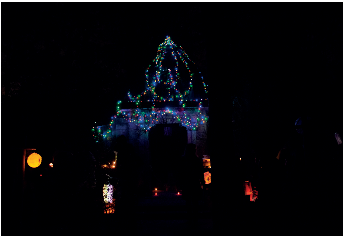
Obr. 8. „Ašrám“ nazdobený světelnými řetězy, lampiony a svíčkami při oslavě Díválí. 3. 11. 2018, Zoo Praha.