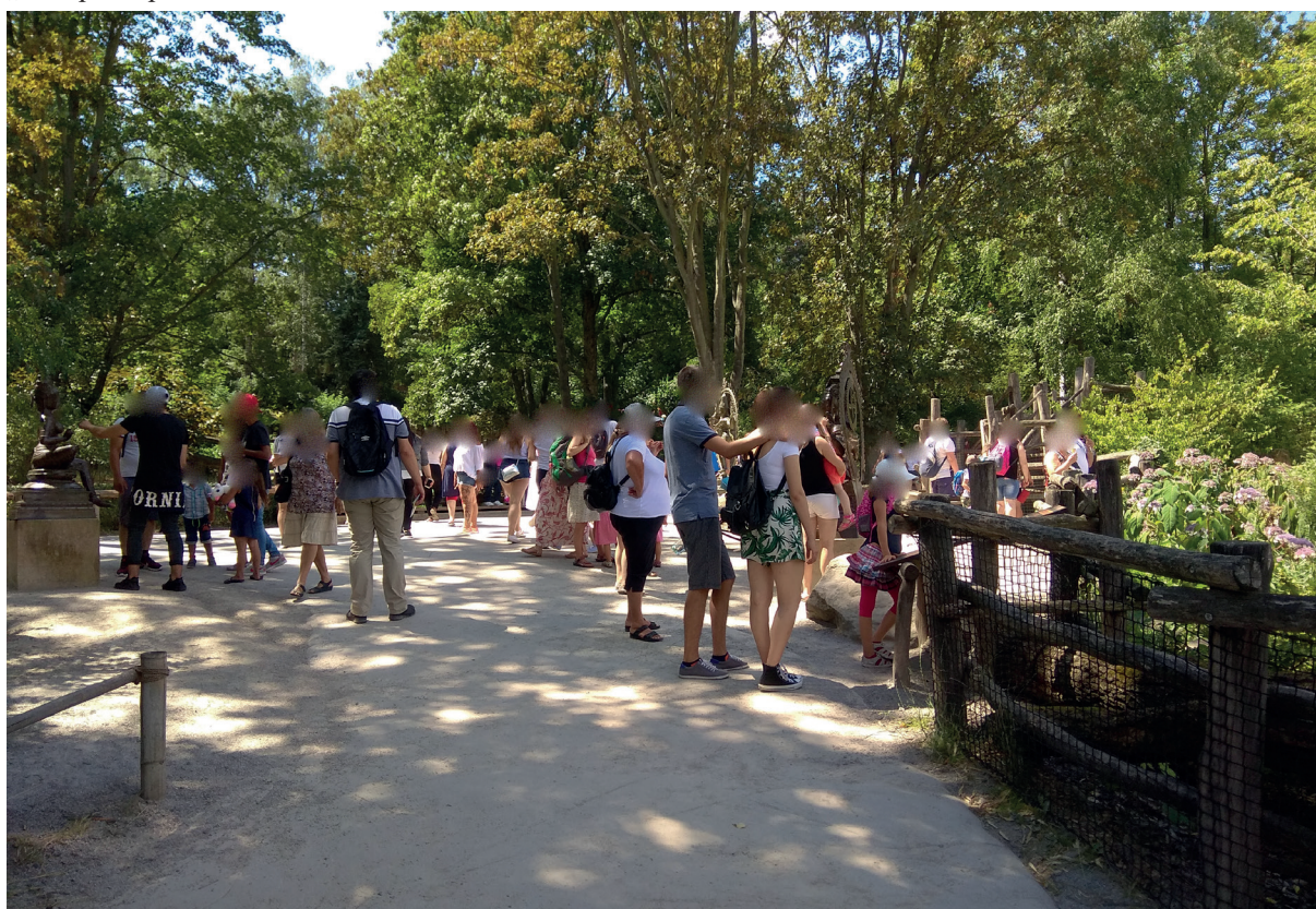
Obr. 2. Prostor u soch božstev v den s vysokou návštěvností. Červenec 2018, Zoo Praha. Párvatí je nalevo, Ganéša a Šiva na pravé straně fotografie.