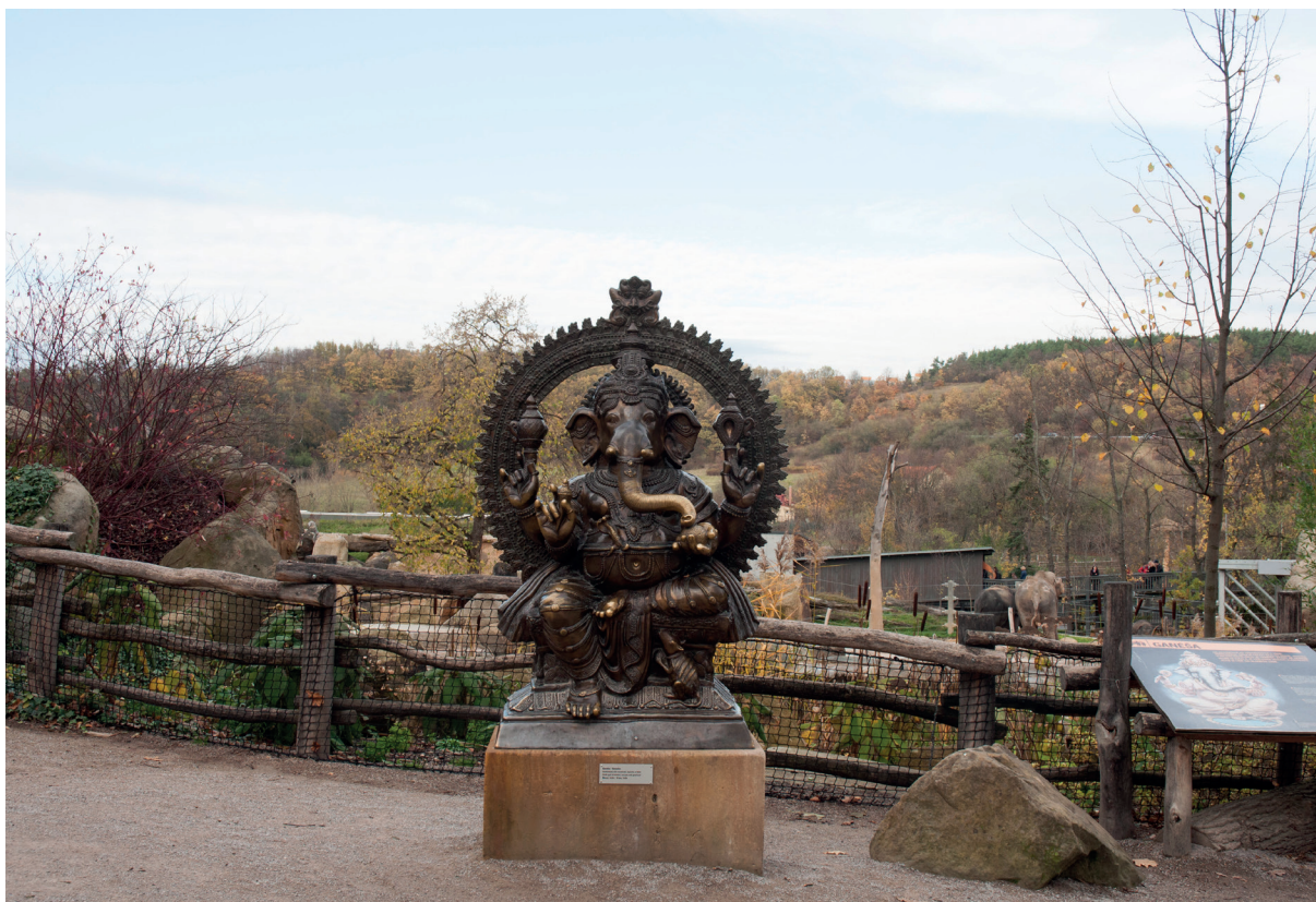
Obr. 3. Ganéša na pozadí výběhu slonů, doprovázený informační tabulí. 2. 11. 2017, Zoo Praha.