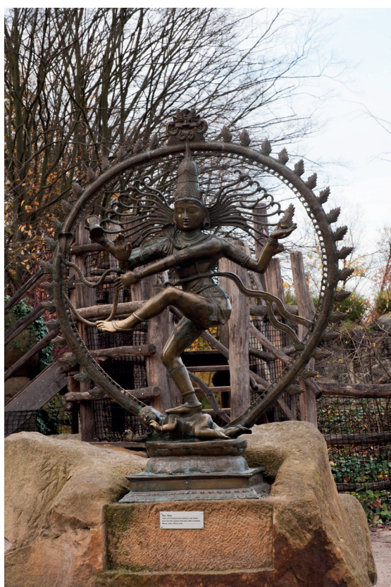
Obr. 4. Šiva Nátarádža. 2. 11. 2017, Zoo Praha.