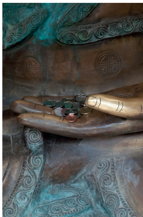
Obr. 12. Detail ruky Buddy Šákjamuniho s mincemi od návštěvníků. Červenec 2018, Zoo Praha.