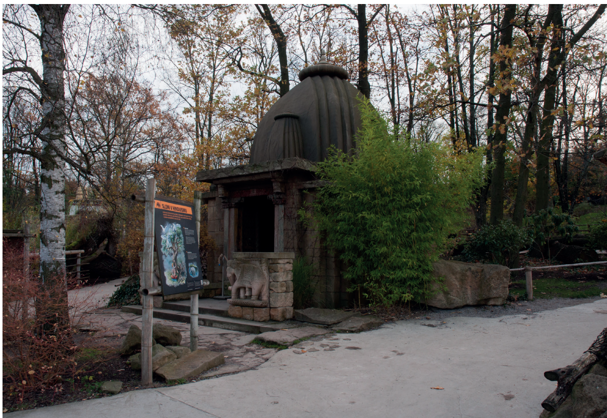
Obr. 6. Pohled ke vstupu do „ašrámu“. 2. 11. 2017, Zoo Praha.