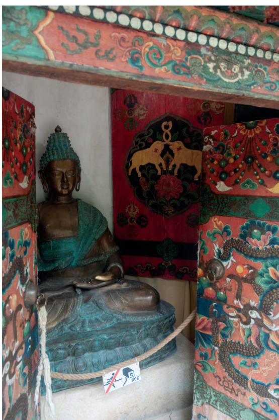
Obr. 11. Socha Buddy Šákjamuniho v „gompě“. Červenec 2018, Zoo Praha. Patrné jsou i detaily malovaných dveří a stěn.