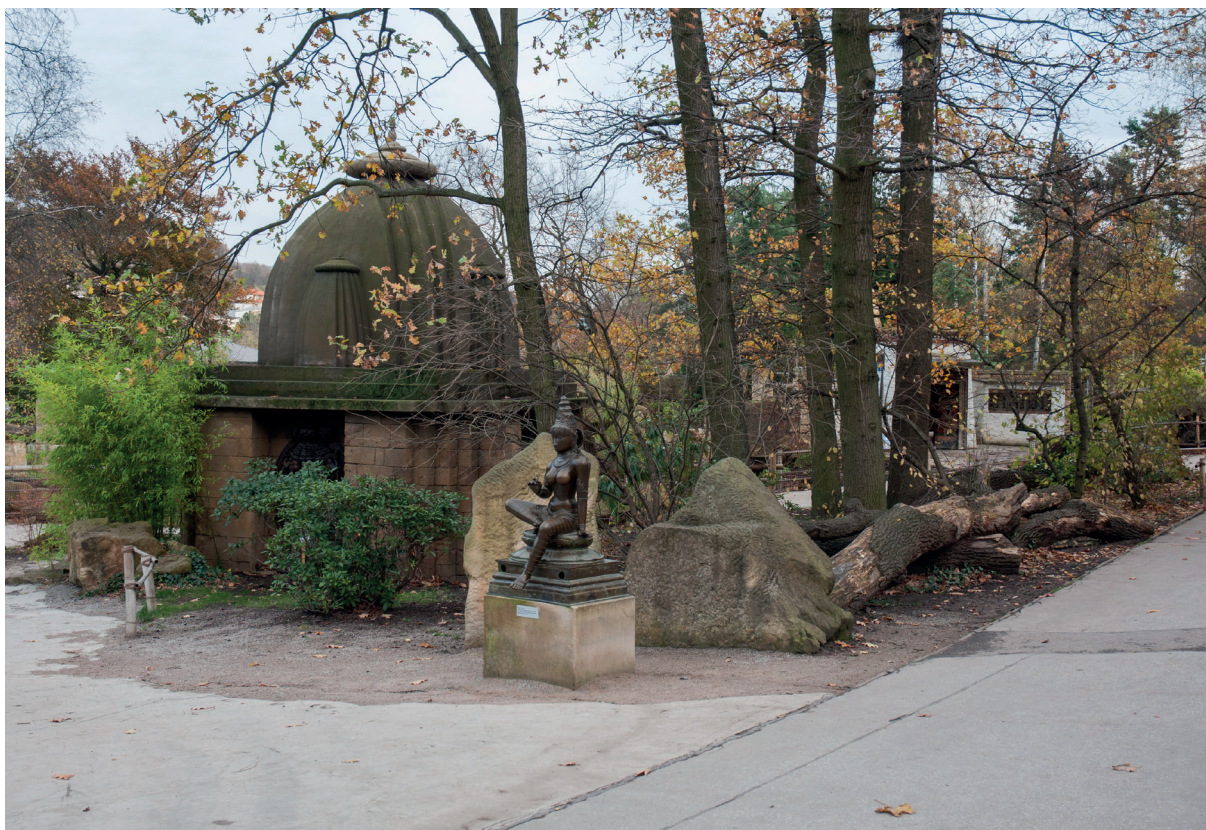
Obr. 1. Pohled na „ašrám“, „gompu“ a sochu Párvatí od hlavní cesty. 2. 11. 2017, Zoo Praha. „Gompa“ v pozadí.