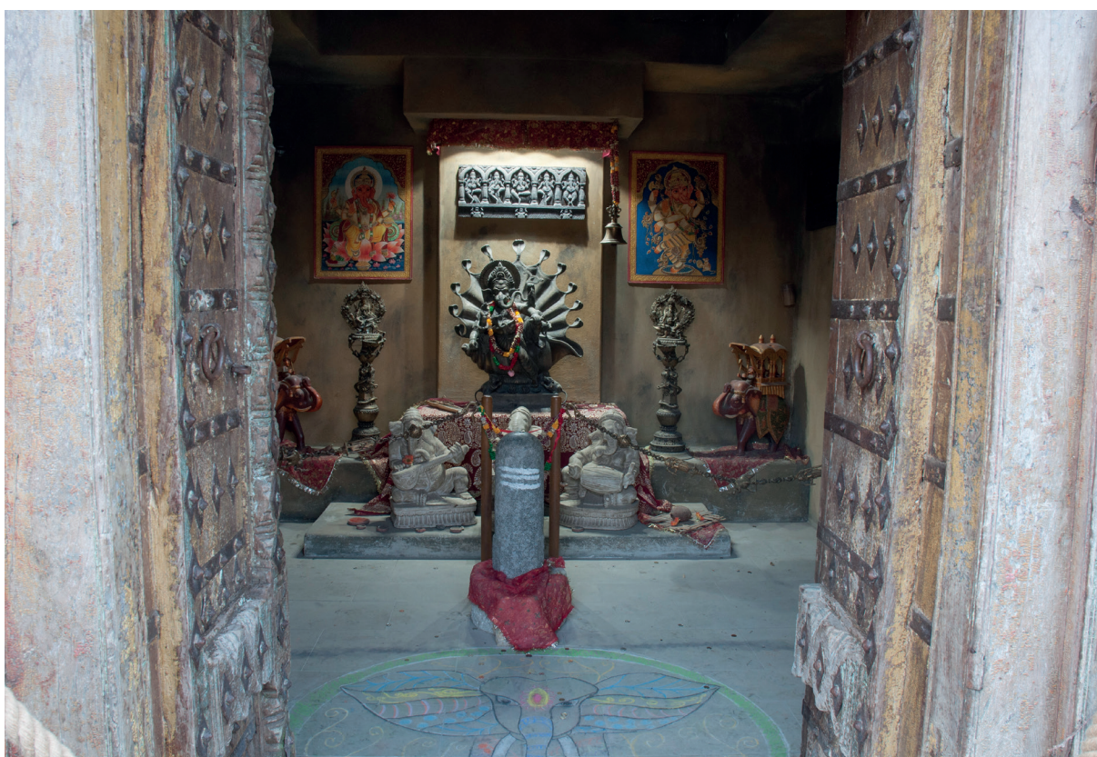
Obr. 7. Pohled dovnitř „ašrámu“. 2. 11. 2017, Zoo Praha. Uprostřed fotografie je lingam se třemi liniemi.