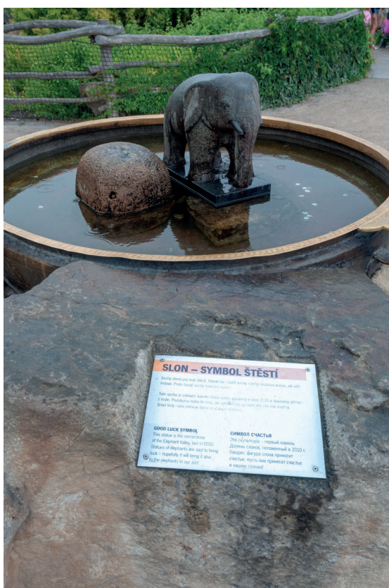
Obr. 16. Základní kámen „Údolí slonů“. Červenec 2018, Zoo Praha.