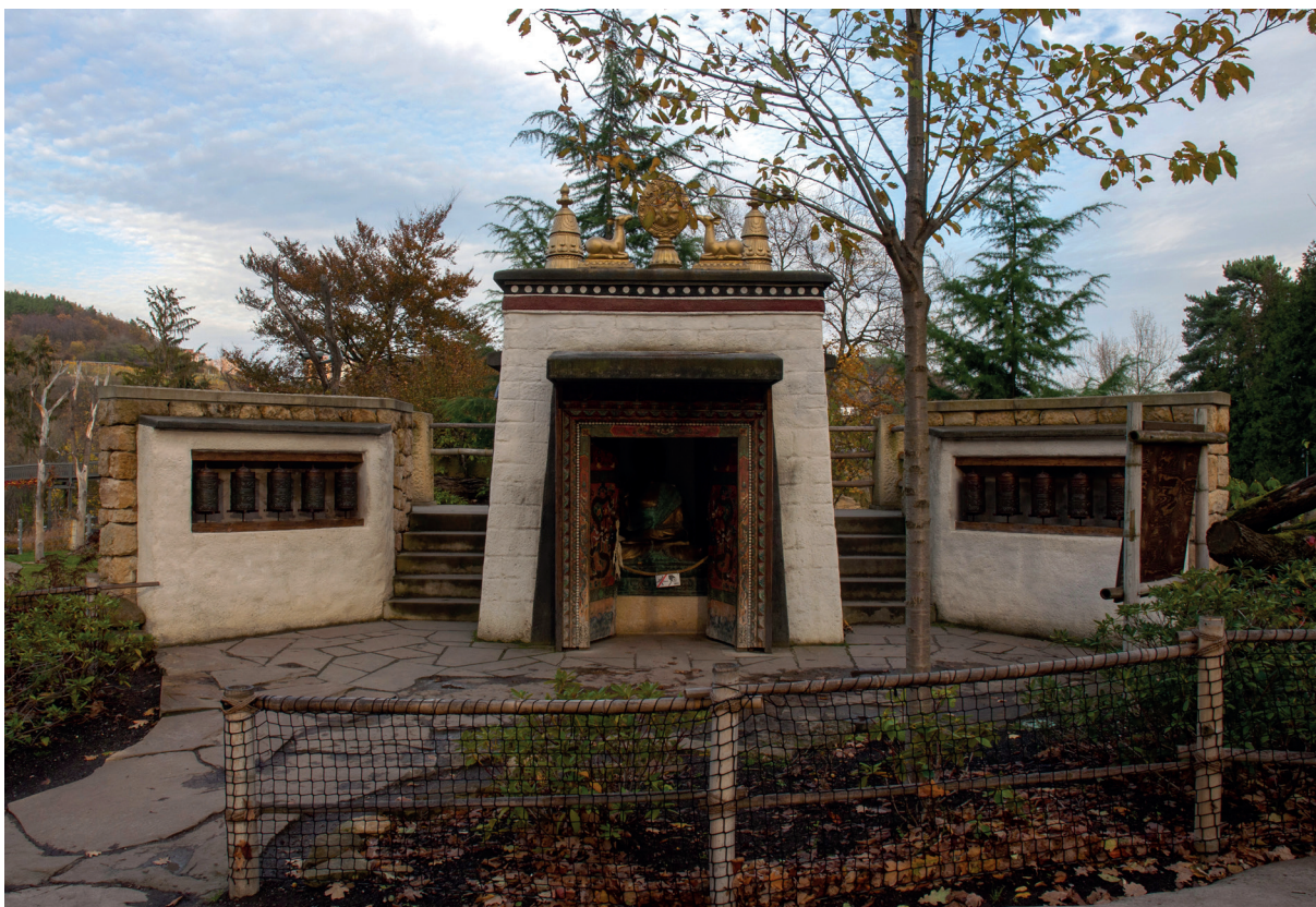
Obr. 10. Pohled na „gompu“ a modlitební mlýnky. 2. 11. 2017, Zoo Praha.