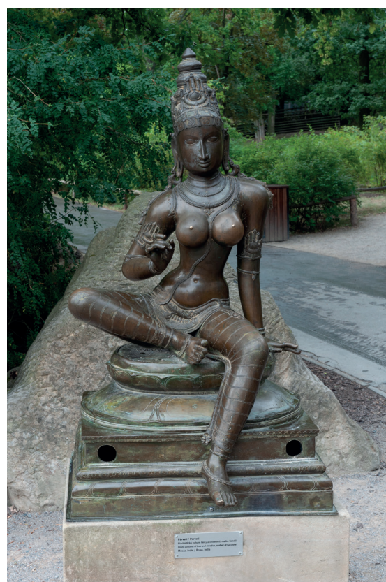
Obr. 5. Párvatí. Červenec 2018, Zoo Praha.