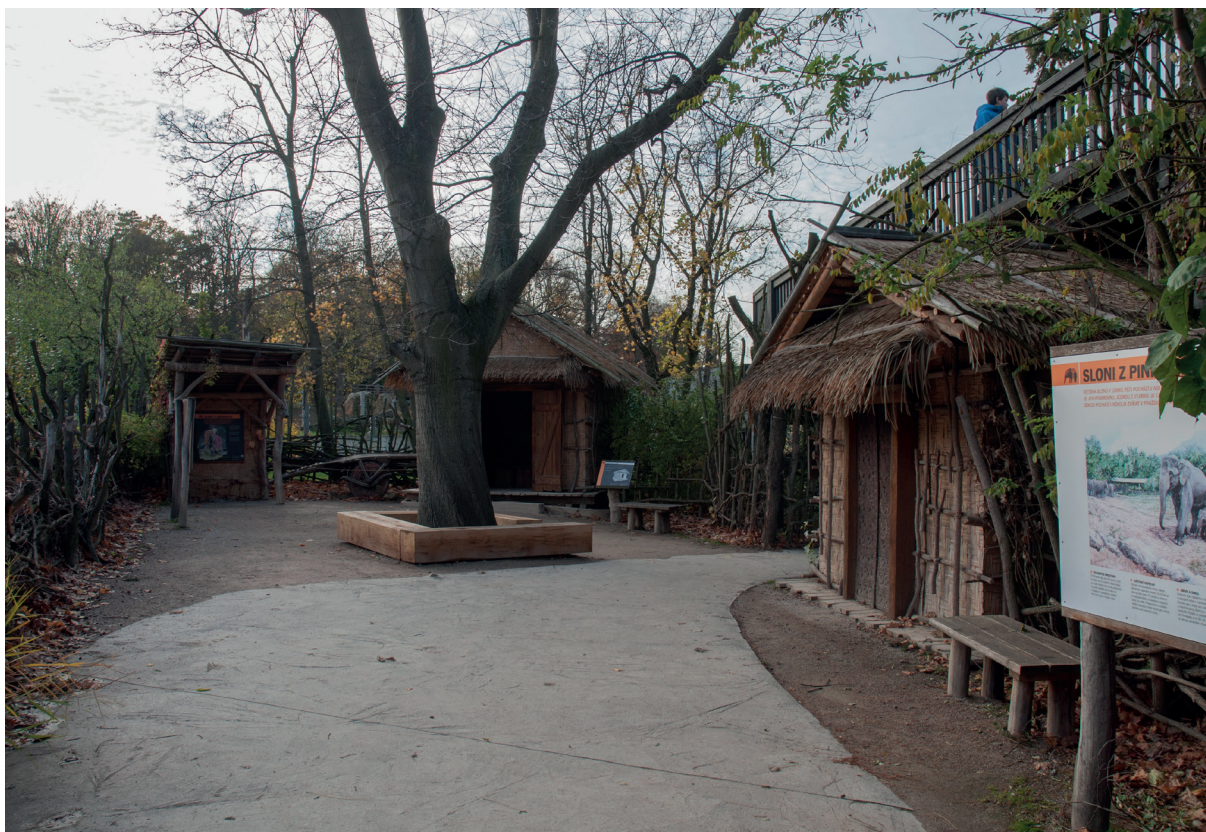
Obr. 15. Pohled k „domorodé vesnici“. 2. 11. 2017, Zoo Praha.