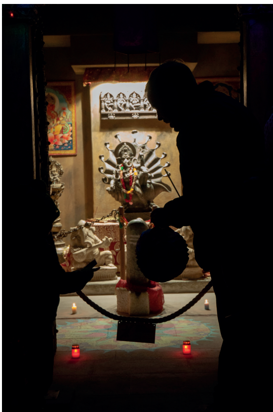
Obr. 9. Pohled dovnitř „ašrámu“ při oslavě Díválí. 3. 11. 2018, Zoo Praha. Na podlaze je patrná nová kresba.