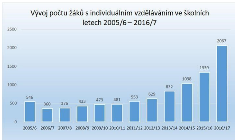
Figure 5 : Évolution du nombre d'enfants instruits à domicile dans les années scolaires 2005/6 – 2016/7

Le graphique montre clairement une baisse de nombre d'enfants entre les années 2005/6 et 2010/11. Nous n'avons pas d'informations concernant les raisons de cet affaiblissement, mais prenons conscience qu'il s'agit du tout début de l'instruction à domicile et des expérimentations faites dans les écoles. On peut donc supposer que les familles ont beaucoup essayé cette nouvelle variante et que leurs avis changeaient au cours des années.