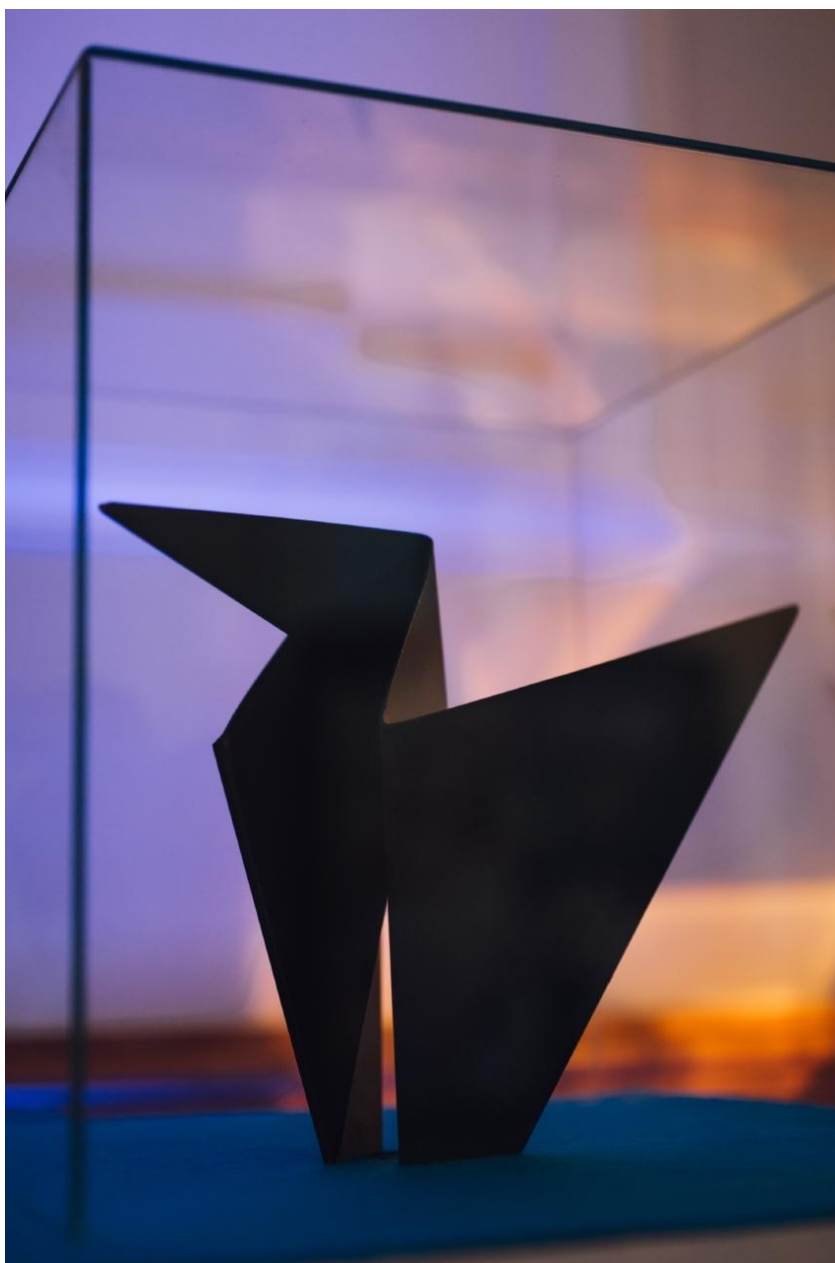
obr. 11: studentská cena 2019