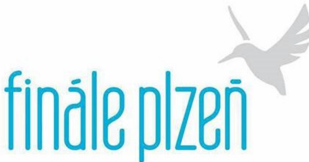
obr. 16: předchozí logo (2012–2015)