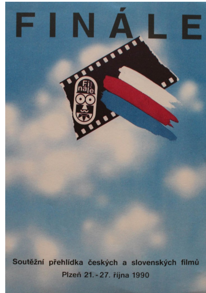
obr. 14: logo 1990