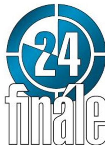
obr. 15: ukázky log z období do roku 2011, kdy bylo jejich součástí pořadové číslo ročníku