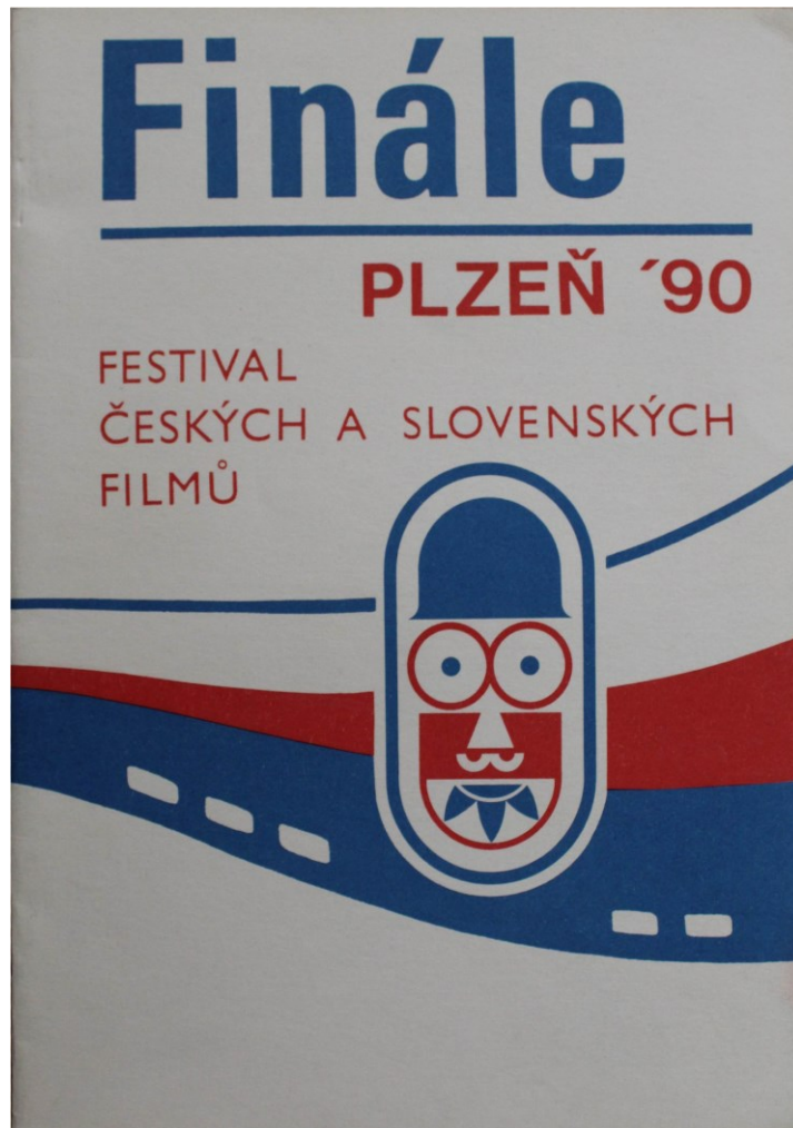
obr. 13: logo 1990