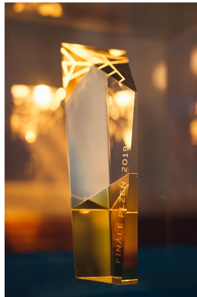
obr. 8: Zlatý ledňáček 2019