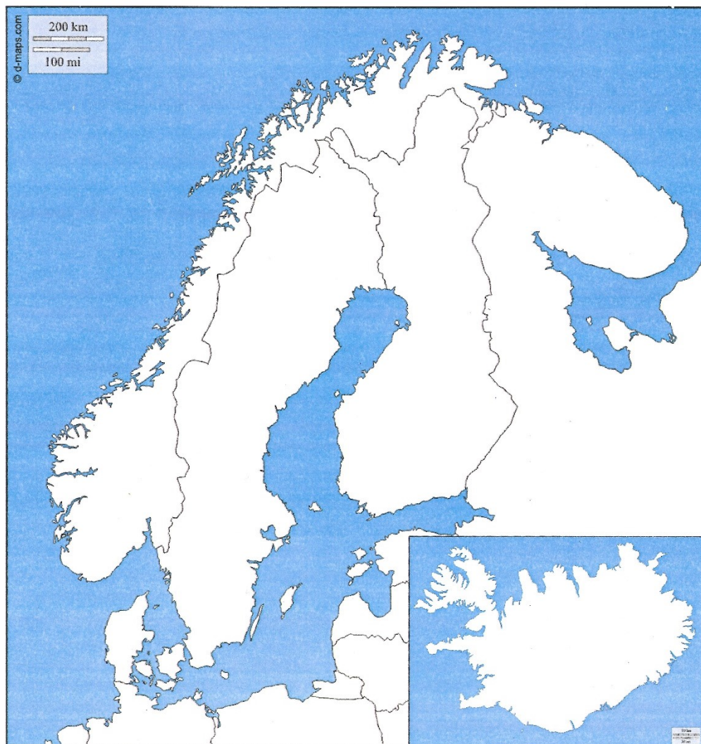
Obrázek 5 - Slepá mapa učitele 2.

Do slepé mapy severní Evropy zakreslí, co si pamatuješ z práce s atlasem a vytvoř tím vlastní originální mapu.