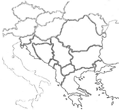
Obrázek 2 - Pracovní list učitele F, první strana.

Pojmenuj a vybarvi v mapě státy, které vznikly rozpadem Jugoslávie. Pokuste se, odvodit 3 příčiny, které vedly v roce 1990 k rozpadu tohoto státu