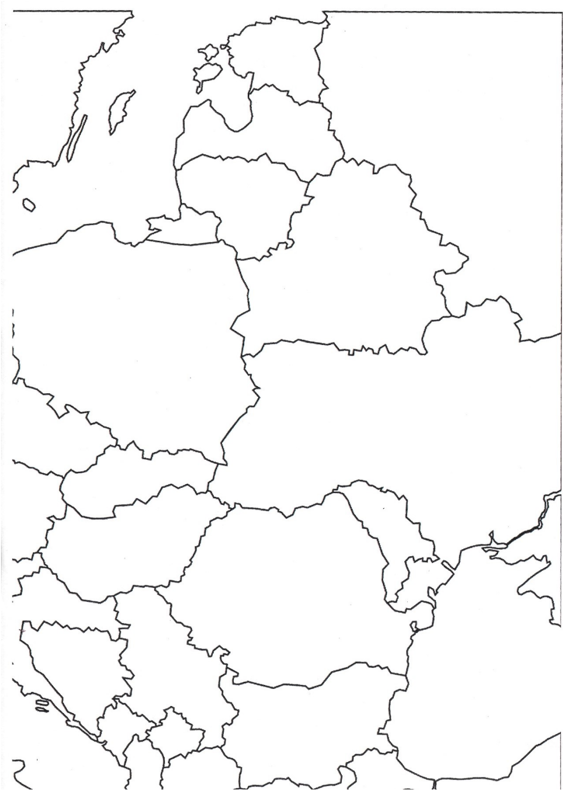
Obrázek 8 - Slepá mapa východní Evropy učitele 3.